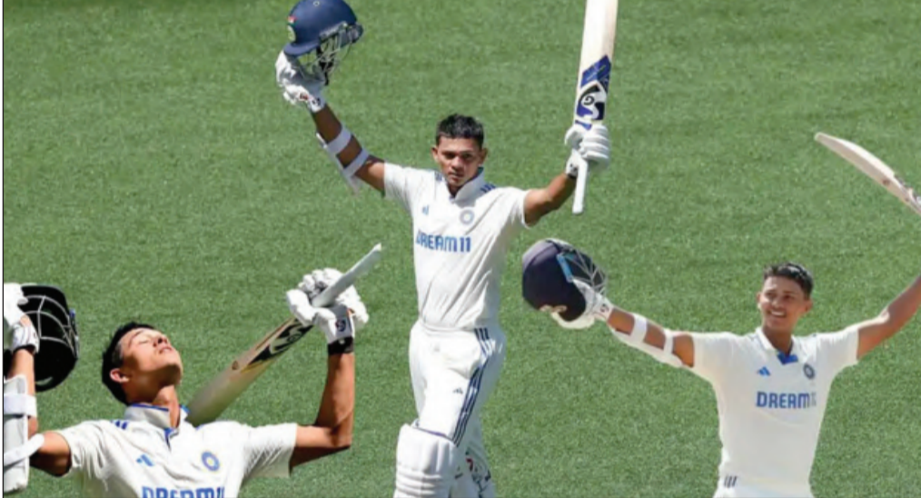
ମୁମ୍ବାଇ, ୨୭।୧୧: ଆଇସିସି ବେଷ୍ଟ ବ୍ୟାଟ୍ସମ୍ୟାନଙ୍କ ତାଲିକାରେ ଯଶସ୍ୱୀ ଜୈସଫାଲ ୨ ନଂ ସ୍ଥାନକୁ ଉଠିଲେ।

ଅଷ୍ଟ୍ରେଲିଆ ବିପକ୍ଷରେ ପ୍ରଥମ ଥର ପାଇଁ ଯଶସ୍ୱୀ ଜୈସଫାଲ ୨ ନଂ ସ୍ଥାନ ଉପରେ ଉଠିଲେ। ସେ ୧୯୯୯ ରାଣ୍ଟିଂଗ୍ ପ୍ରାପ୍ତ ହୋଇଥିଲେ। ଏହି ପଦକ୍ଷେପରେ ଯଶସ୍ୱୀ ଜୈସଫାଲ ୨ ନଂ ସ୍ଥାନକୁ ଉଠିଲେ। ଏହି ପଦକ୍ଷେପରେ ଯଶସ୍ୱୀ ଜୈସଫାଲ ୨ ନଂ ସ୍ଥାନକୁ ଉଠିଲେ।