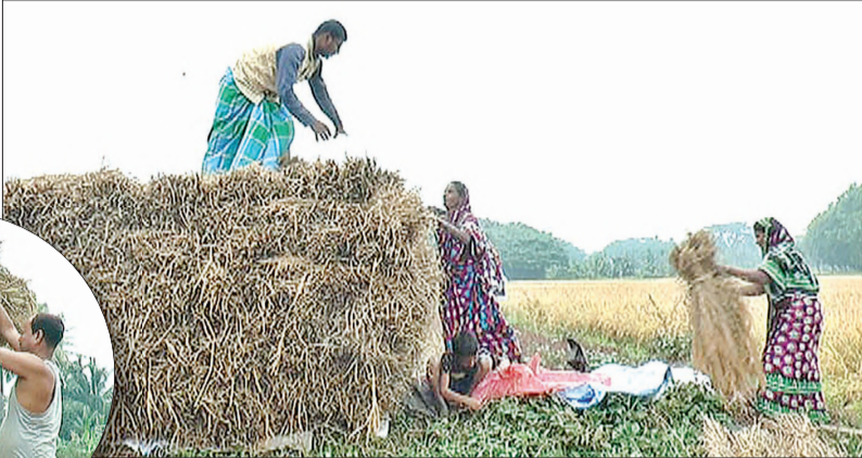
କିନ୍ତୁ ବୃକ୍ଷର ସମସ୍ତ ଫଳାଫଳରେ ୮୦ଭାଗ ଜମିରେ କେବଳ ଧାନ ଚାଷ କରାଯାଇଥାଏ। ଏହି ଏକମାତ୍ର ଫସଲ ଉପରେ ନିର୍ଭର କରି ଲୋକମାନେ ଚଳନ୍ତି। ଅସ୍ତରଙ୍ଗ ଓ କାଳଚପୁର ବ୍ଲକରେ ପୂର୍ବରୁ ବର୍ଷା ଅଭାବରୁ ଚାଷୀମାନେ ଧାନ କରନ୍ତୁ ବୋଲି କିମ୍ବା

କାଳଚପୁର/ଅସ୍ତରଙ୍ଗ, ୨୯।୧୧ (ସଂଚାର ବ୍ୟୁରୋ): ଏବେ କ୍ଷେତରେ ଲହଡ଼ି ମାଉଣ୍ଡି ସୁନାର ଫସଲ ଧାନ। ଅମଳକୁ କେବଳ ଅନାଲ ବସିଛି। ବାତ୍ୟା ଦାନାରେ କିଛି କ୍ଷତି ହୋଇନଥିବା ବେଳେ ଫସଲ ମଧ୍ୟ ଭଲ ହୋଇଛି। କିନ୍ତୁ ବାରମ୍ବାର ଚାଷୀଙ୍କୁ ଛାନିଆ କରୁଛି ଲଘୁଚାପ ଭୟ। ବଙ୍ଗୋପସାଗରର ସୃଷ୍ଟି ହୋଇଥିବା ଲଘୁଚାପରେ ନୂଆ ସମ୍ଭାବନା ସୃଷ୍ଟି ହେବା ଶୁଣି ଫଳରେ ଚାଷୀ ଆତଙ୍କିତ ହୋଇଛି। ହେଲେ ଯୌତୁକାୟନଗଣେଷ ପାଗ କୋହଲା ରହିଥିବା ବେଳେ ବର୍ଷା ସେତେ ମାତ୍ରାରେ ହୋଇନାହିଁ। ପୁରୀ ଜିଲ୍ଲା ଅସ୍ତରଙ୍ଗ ଓ କାଳଚପୁର ରେ ଶୁକ୍ରବାର କିଛି ସ୍ଥାନରେ ଝିପିଝିପି ବର୍ଷା କିଛି ସମୟ ହୋଇଥିବା ବେଳେ ଚିକ୍ତାରେ କିଛି ଚାଷୀ ବିଲରେ କଟାଧାନକୁ ଖଳା କରି ପାଲ ଗୋଡ଼ାଇଛନ୍ତି। ଲଘୁଚାପ ପ୍ରଭାବରେ ରାଜ୍ୟରେ ବର୍ଷା ହେବ ବୋଲି କୁହାଯାଇଛି। ହେଲେ ଲଘୁଚାପ ନାଁ ଶୁଣି ଚାଷୀ ଆତଙ୍କିତ ହୋଇ ପଡ଼ିଛନ୍ତି। ଯାହା ଚାଷୀଙ୍କୁ ଛାନିଆ କରିବା ସହ ଭୟ ଓ ଆଶଙ୍କା ଦେଖାଦେଇଛି। ପୁରୀ ଜିଲ୍ଲା ଅସ୍ତରଙ୍ଗ ଓ କାଳଚପୁର ବ୍ଲକ ଅଞ୍ଚଳବାସୀ କି ଧାନ ହେଉଛି ବର୍ଷିକର ଆହାର।