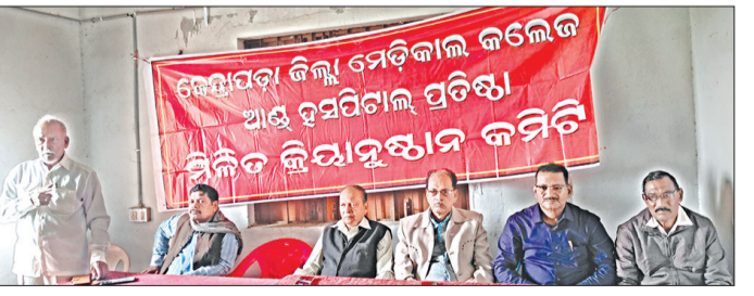
ମେଡିକାଲ କଲେଜ ପ୍ରାପ୍ୟ ଆମର ହକ: ମିଳିତ କ୍ରିୟାନୁଷ୍ଠାନ କମିଟି

କେନ୍ଦ୍ରାପଡ଼ାରେ କେନ୍ଦ୍ରାପଡ଼ା ମେଡିକାଲ କଲେଜ ପ୍ରତିଷ୍ଠା ପାଇଁ ଦାବି କରି ଧରି ବିଭିନ୍ନ ପ୍ରକାରରେ ଦାବି ହେଇ ଆସୁଛି। ଏହାକୁ ଏକ ସାମଗ୍ରିକ ରୂପ ଦେଇ ୨୦୧୬ମସିହାରେ କେନ୍ଦ୍ରାପଡ଼ା ଜିଲ୍ଲା ମେଡିକାଲ କଲେଜ ଓ ହସ୍ପିଟାଲ ପ୍ରତିଷ୍ଠା ପାଇଁ ମିଳିତ କ୍ରିୟାନୁଷ୍ଠାନ କମିଟି ଆନ୍ଦୋଳନ ଆରମ୍ଭ କରିଛି । ଏହି ସଙ୍ଘଠନରେ ବିଭିନ୍ନ ରାଜନୈତିକ ଦଳ ସମେତ ବିଭିନ୍ନ ବର୍ଗର ଜନଗଣ ସାମିଲ ହେଇ ଲଗାତାର ଆନ୍ଦୋଳନ କରି ଆସୁଛନ୍ତି ।