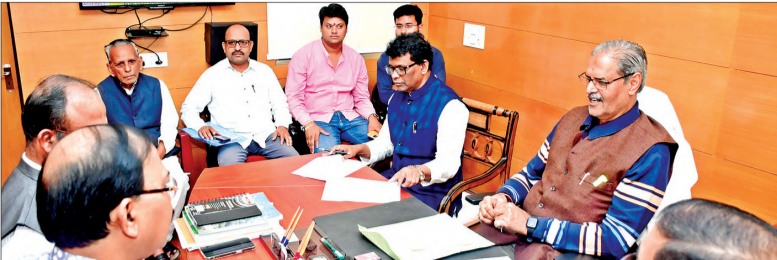
କେଉଁ କହିଥିଲେ ଯେ, ଆମେ ଆପଣମାନଙ୍କ କେନ୍ଦ୍ରପତ୍ର ତୋଳାଳିଙ୍କ ଆୟ ମଧ୍ୟ ବଢ଼ିବା ଆବଶ୍ୟକ। ଏ ନେଇ ଓଡ଼ିଶା କେନ୍ଦ୍ରପତ୍ର ସଂଘ ଉପମୁଖ୍ୟମଣ୍ଡଳୀ ନିକଟରେ ବିଭିନ୍ନ ଦାବି ଉପସ୍ଥାପନ କରିଥିଲେ। ଦାବି ଶୁଣିବା ପରେ ଉପମୁଖ୍ୟମଣ୍ଡଳୀ ଶ୍ରୀ ସିଂହଦେଓ ସଂଘକୁ ଆଶ୍ୱାସନା

ଭୁବନେଶ୍ୱର, ୩୧୨ (ସଂଚାର ବ୍ୟବସ୍ଥା): ଆଜି ବିଧାନସଭାରେ ଉପମୁଖ୍ୟମଣ୍ଡଳୀ ତଥା କୃଷି ଓ କୃଷକ ସଶକ୍ତିକରଣ ଏବଂ ଶକ୍ତିମଣ୍ଡଳୀ ଶ୍ରୀ କନକ ବର୍ଦ୍ଧନ ସିଂହଦେଓଙ୍କ ସହ ଓଡ଼ିଶା କେନ୍ଦ୍ରପତ୍ର ସଂଘ ସଦସ୍ୟଙ୍କ ବୈଠକ ଅନୁଷ୍ଠିତ ହୋଇଯାଇଛି।