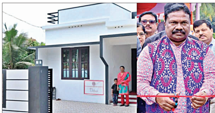
ଗ୍ରାମାଞ୍ଚଳ ମାଧ୍ୟମରେ ଆଲୋଚନା ହେଉଛି ଯେଉଁଠାରେ ବି ଆବାସ ପାଇବାରୁ ବାଦ ପଡ଼ିବେନି। କାହାକୁ ବାଦ ଦିଆଯିବ ନାହିଁ। ଏବେ ଲୋକଙ୍କୁ ପାଖକୁ ଆସାଇଛୁ।