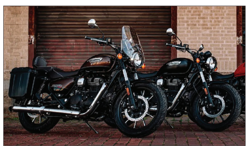
ହିମାଳୟ ୬୫୦ ଲକ୍ଷର ସେୟାର ଟ୍ରେଲିଂ ପ୍ରେମ୍ ଆପଣ ଆଗାମୀ ସମୟରେ ଏହି ଟ୍ରେଲିଂ ବାଇକ୍ ମଧ୍ୟରେ ଉପରେ ଆଧାରିତ ହେବାକୁ ଯାଉଛି।

୪୭.୪ ଲିଟର ପି ଏବଂ ପିକ୍ ଚର୍ଚ୍ଚ ୫୨.୪ ଏବଂ ଏମ୍ କେନେରେଟ୍ କରିବାର ସକ୍ଷମତା ମିଳିଥାଏ।