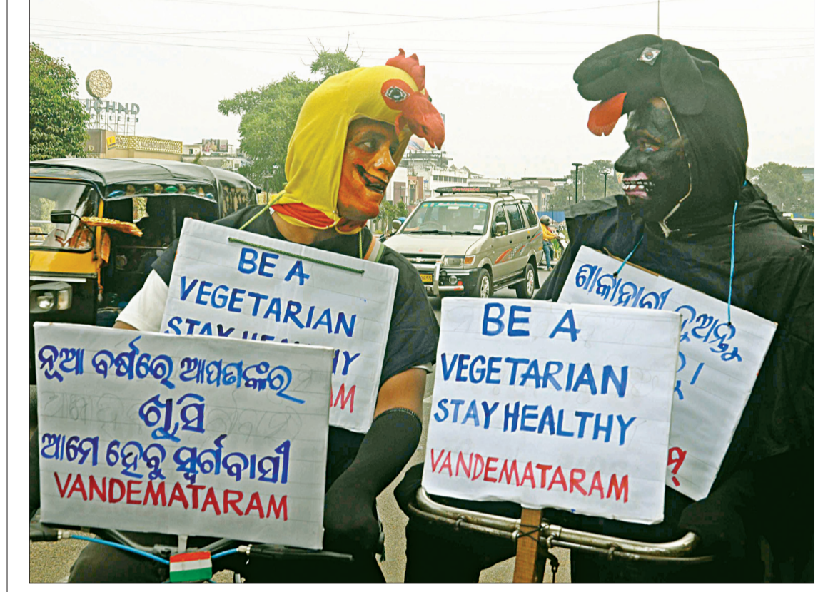
ଆଗକୁ ନୂଆବର୍ଷ : ରାଜଧାନୀ ରାଜରାସ୍ତାରେ କୁକୁଡ଼ା ଓ ହେଲିକ୍ସ ନିରାମିଷ ଆହାର ସପକ୍ଷରେ ସବେତନତା ବାଣୀ।

ପୁରୀ, ୧୮୧୨୨ (ସଂଚାର ବ୍ୟୁରୋ): ସ୍ଥାନୀୟ ମଙ୍ଗଳାଘାଟରେ ଥିବା ଏକ ସାବୁନ ଫ୍ୟାକ୍ଟିରେ ଭୟଙ୍କର ଅଗ୍ନିକାଣ୍ଡ ଘଟିଛି। ଆଜି ମଧ୍ୟାହ୍ନରେ ଅଗ୍ନିକାଣ୍ଡ ଘଟି ଲକ୍ଷାଧିକ ରକ୍ତାକ୍ତ ସମ୍ପତ୍ତି ଭସ୍ମ ହୋଇଯାଇଛି। ସୂଚନା ପାଇ ଅଗ୍ନିଶମ ବାହିନୀ କର୍ମଚାରୀ ପହଞ୍ଚି ନିଆଁ ଲିଭାଇଛନ୍ତି। ପ୍ରାଥମିକ ତଦନ୍ତରୁ ସର୍ବ୍ତେ ସ୍ୱଳ୍ପତଃ ଫ୍ୟାକ୍ଟିରେ ନିଆଁ ଲାଗିଥିବା ଅନୁମାନ କରାଯାଉଛି। ଅଗ୍ନି ବିଭୁଳାକେ ନିଆଁ ଚାରିଆଡ଼େ ବ୍ୟାପି ଯାଇଛି। ଫଳରେ ଫ୍ୟାକ୍ଟିରେ ସାବୁନ ପ୍ରସ୍ତୁତ ପାଇଁ ଥିବା ଚେଳକେ ନିଆଁ ଲାଗି ତାହା ଅଧିକ ଭୟଙ୍କର ହୋଇପାରେ। ନିଆଁ ଝାସରେ ଫ୍ୟାକ୍ଟିର ଆକରଣେଷୁ, କାନ୍ଥ ଆଦି ଗଳି ପଡ଼ିଛି। ନିଆଁ ଲାଗିଥିବା ସମୟରେ ସାବୁନ ଫ୍ୟାକ୍ଟିରେ ବହୁ କର୍ମଚାରୀ କାମ କରୁଥିଲେ। ସେମାନଙ୍କ ମଧ୍ୟରୁ କିଏ ମୃତ୍ୟୁ ହେବ କିମ୍ବା ଆହତ ହୋଇଥିବା ବେଳେ କିଛି ସୂଚନା ମିଳିପାରିନି। ଫ୍ୟାକ୍ଟିରେ ଅଗ୍ନି ନିରାପତ୍ତା ବ୍ୟବସ୍ଥା ଠିକ୍ ଭାବେ କାର୍ଯ୍ୟକାରୀ ହେଉଛି ନା ନାହିଁ ତାହାର ବି ସାଫ୍ତ ହେବ ବୋଲି ଅଗ୍ନିଶମ ଅଧିକାରୀ ସୂଚନା ଦେଇଛନ୍ତି।