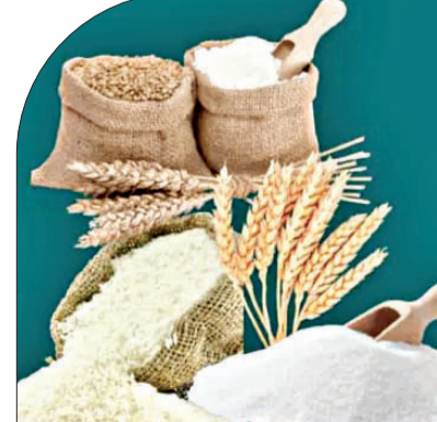
ଆଉ ୭ଲକ୍ଷ ଚନ୍ଦ୍ର ଶାସ୍ୟଶାସ୍ୟ ବାଟମାରଣ ହୋଇଛି। ସରକାରୀ ତଥ୍ୟ ମୁତାବକ, କାର୍ତ୍ତାୟ ଶାସ୍ୟ ସୁରକ୍ଷା ଆଇନ୍ ଅଧିନରେ ଓଡ଼ିଶାରେ ୧୨,୭୭,୪୯୧ ପରିବାର ୩,୨୫,୯୩,୮୭୫ ହିତାଧିକାରୀ

ଭୁବନେଶ୍ୱର, ୧୮୧୨୨: ପ୍ରଧାନମନ୍ତ୍ରୀ ଗରିବ କଲ୍ୟାଣ ଅନ୍ନ ଯୋଜନାରେ ଓଡ଼ିଶାକୁ ମିଳୁଥିବା ଚାଉଳକୁ ପାଖାପାଖି ୨୫ ପ୍ରତିଶତ ବାଟମାରଣ ହେଉଥିବା ଜଣାପଡ଼ିବାପରେ ପ୍ରକୃତି ହିତାଧିକାରୀଙ୍କୁ ଚଳଣି କରି କାର୍ଯ୍ୟକାରୀକୁ ବାଦ୍ ଦେବାପାଇଁ କୋରୋନା ରତ୍ୟମ ଚାଲିଛି। ଫଳରେ ଅଧିକାଂଶ ହିତାଧିକାରୀଙ୍କ ସ୍ଥାନରେ ଆଉ ନୂଆ ଯୋଗ୍ୟ ହିତାଧିକାରୀ ଯୋଡ଼ି ହେବେ। ଇଣ୍ଡିଆନ୍ କାର୍ପୋରାସନ୍ ଫର୍ ରିସର୍ଭ ଅଫ୍ ଇଣ୍ଡିଆରେ ସରକାରୀ ଚାଉଳ ଓଡ଼ିଶା କାର୍ପୋରାସନ୍ ଦେଶରେ ଏଭଳି ଲୁଚ୍ ଚାଲିଛି। କାର୍ତ୍ତାୟ ସ୍ତରରେ ୨୮ ପ୍ରତିଶତ ମାଗଣା ଚାଉଳ ଓ ଗହମ ଲୁଚ୍ ହେଉଥିବାବେଳେ ଓଡ଼ିଶାରେ ଏହାର ପରିମାଣ ୨୪.୭ ପ୍ରତିଶତ ବୋଲି କୁହାଯାଉଛି। ଏହି ରିପୋର୍ଟର ତଥ୍ୟ ମୁତାବକ ୨୦୨୨-୨୩ ବର୍ଷରେ ଓଡ଼ିଶାକୁ ୨.୮୨ ନିୟୁଟ ଚନ୍ଦ୍ର ଶାସ୍ୟ କାର୍ତ୍ତାୟ ଶାସ୍ୟ ସୁରକ୍ଷା ଆଇନ୍ ଆଧାରରେ ମିଳିଥିଲା। ଏଥିରୁ ୨.୧୩ ନିୟୁଟ ଚନ୍ଦ୍ର ଚାଉଳ ହିତାଧିକାରୀଙ୍କ ନିକଟକୁ ଯାଇଥିବାବେଳେ