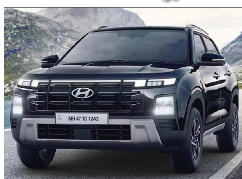
ଏହାର ପ୍ରଶ୍ନରେ ଚାର୍ଜ ପୋର୍ଟ ପାଇଁ ସ୍ଥାନ ଯୋଗାଇ ଦିଆଯିବ ଏବଂ ଏହାର ଆଲ୍-ଏ ସ୍ପିଡ୍ ଗୁଡିକ ଡିଜାଇନରେ ଭିନ୍ନ ହେବ।

ନୂଆଦିଲ୍ଲୀ, ୧୮/୧୨: ସାଉଥ କୋରିଆର ଅଟୋମୋବାଇଲ୍ ନିର୍ମାତା କମ୍ପାନୀ ହୁଣ୍ଡାଇ ଦ୍ୱାରା ଭାରତରେ ଅନେକ ଦମଦାମ କାର ଲକ୍ଷ କରିଥାଏ।