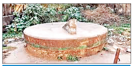
ଜିଲ୍ଲାପାଳଙ୍କୁ ପର୍ଯ୍ୟଟନ ବିଭାଗର ଚିଠି