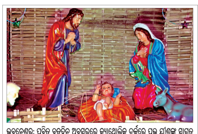
ଭୁବନେଶ୍ୱର: ପବିତ୍ର ବଡ଼ଦିନ ଅବସରରେ କ୍ୟାଥୋଲିକ୍ ଚର୍ଚ୍ଚରେ ପ୍ରଭୁ ଯୀଶୁଙ୍କୁ ସ୍ୱାଗତ

୨୫ ତାରିଖ (ଗୁରୁବାର)ଠାରୁ କାର୍ତ୍ତିକ ୨ ତାରିଖ ପର୍ଯ୍ୟନ୍ତ ରତ୍ନଭଣ୍ଡାର ମରାମତି ସ୍ଥିତି ରଖାଯାଇଛି।