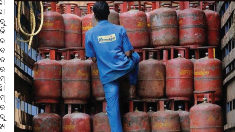
ସିଲିଣ୍ଡର ବ୍ୟବହାର କରାଯାଇଥାଏ। ସେମାନଙ୍କୁ ୧୪ କିଲୋଗ୍ରାମ ଘରୋଇ ସିଲିଣ୍ଡର ବ୍ୟବହାର କରିବାକୁ ଅନୁମତି ନାହିଁ। ସୂଚନାଯୋଗ୍ୟ, ତିସେମ୍ବର ମାସରେ ଏଲପିଜି ସିଲିଣ୍ଡର ଦାମ୍ ବଢ଼ିଥିଲା। କର୍ମସିଧା ଏଲପିଜି ଦାମ୍ ୧୪ କିଲୋଗ୍ରାମ ଘରୋଇ ସିଲିଣ୍ଡର ବ୍ୟବହାର ୧୬.୫୦ ବଢ଼ିଥିଲା। ଏହାପୂର୍ବରୁ ନଭେମ୍ବରରେ ମଧ୍ୟ ଏଲପିଜି ସିଲିଣ୍ଡର ଦାମ୍ ବଢ଼ିଥିଲା।