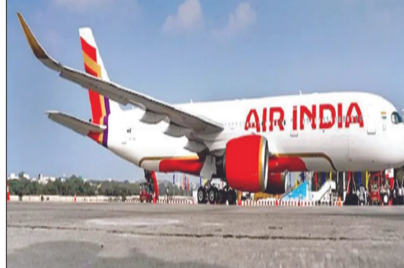
ଏହା ଆରମ୍ଭ ହୋଇଛି ଏୟାର ଇଣ୍ଡିଆ ସମୟ ସହିତ ଏହାର କାହାଣୀର ଅନ୍ୟ ବିମାନରେ ଏହି ସେବା

ନୂଆଦିଲ୍ଲୀ, ୧୧: ନୂଆବର୍ଷ ଅବସରରେ ଏୟାର ଇଣ୍ଡିଆ ଏହାର ଯାତ୍ରୀମାନଙ୍କୁ ଏକ ବଡ଼ ଉପହାର ଦେଇଛି। ଘରୋଇ ବିମାନରେ ମାଗଣା ଡ୍ରାଇ-ଫାଇ ଇଣ୍ଡିଆରେ ଲକ୍ଷ କରିଥିବା ଏୟାର ଇଣ୍ଡିଆ ପ୍ରଥମ ଭାରତୀୟ ବିମାନ କମ୍ପାନୀ ହୋଇପାରିଛି। ଏୟାର ଇଣ୍ଡିଆ ଦ୍ୱାରା କାର୍ତ୍ତିକ ଏକ ପ୍ରେସ ବିଷୟରେ କୁହାଯାଇଛି ଯେ ଏୟାରବସ୍ ଏମ୍‌୫୦, ବୋଇଙ୍ଗ୍ ୭୮୭-୯ ଏବଂ ଏୟାରବସ୍ ଏମ୍‌୩୨୧ନିଓ ବିମାନରେ ଥିବା ଯାତ୍ରୀମାନଙ୍କ ଇଣ୍ଡିଆରେ ଗ୍ରାହକ କରିପାରିବେ, ଯୋଡିଆଲ୍ ମିଡିଆ ଦେଖିପାରିବେ, ୧୦୦୦୦ ଫୁଟ ଉପରେ ଉଡ଼ିବା ସମୟରେ ବି ଇଣ୍ଡିଆରେ ବ୍ୟବହାର କରି ଗ୍ରାହକଙ୍କୁ କରିପାରିବେ। ଏହାପୂର୍ବରୁ ଏୟାର ଇଣ୍ଡିଆର ଆଡ଼ିଟିଭିଭିଟି ରୁଟ୍ ନ୍ୟୁୟର୍କ, ଲଣ୍ଡନ, ପ୍ୟାରିସ୍ ଏବଂ ସିଙ୍ଗାପୁରରେ ଏହି ସେବା ଯୋଗାଇ ଦିଆଯାଇଛି। ବର୍ତ୍ତମାନ ପାଇଲଟ୍ ପ୍ରୋଜେକ୍ଟ୍ ପ୍ରୋଗ୍ରାମ ଅଧୀନରେ ଘରୋଇ ମାର୍ଗରେ