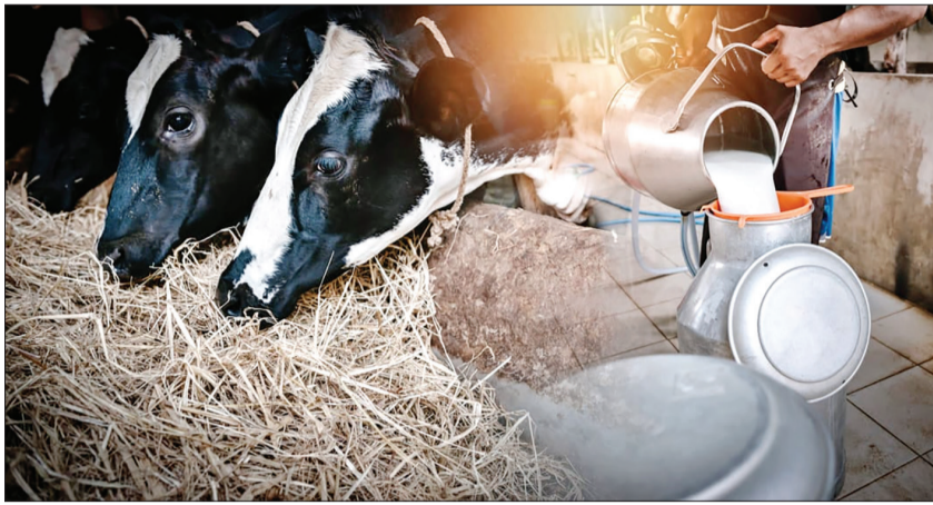
ମହଙ୍ଗା ଯୁଗରେ ପରିବାର ଚଳିବ କେମିତି ?

କେନ୍ଦ୍ରାପଡ଼ା, ୧୧ (ସଂଚାର ବ୍ୟୁରୋ) : ବଜାରରେ ବିକ୍ରୀ ହେଉଥିବା କ୍ଷୀର ଦର ଦିନକୁ ଦିନ ବୃଦ୍ଧି ପାଇବାରେ ଲାଗିଛି। ବିକ୍ରି ହେଉଥିବା ପ୍ୟାକେଟ୍ କ୍ଷୀର ଲିଟର ପିଛା ଦର ବଡ଼ି ୫୬ ଟଙ୍କାରେ ପହଞ୍ଚିଲାଣି। ଦର ବଡ଼ିବା ସହ ଗ୍ରାହକ ଦକ୍ଷିଣ ଦିଗରେ କ୍ଷୀର ପ୍ୟାକେଟ୍ କିଣୁଛନ୍ତି କିନ୍ତୁ ଏଥିରେ ଚାଷୀ ଟଙ୍କାଟିଏ ବି ଲାଭ ପାଇପାରୁନାହାନ୍ତି। ସହରର ଚାଷୀ ଏକ ନିର୍ଦ୍ଦିଷ୍ଟ ଘରୋଇ ପ୍ରତିଷ୍ଠାନକୁ ଲିଟର ପିଛା ସର୍ବାଧିକ ୩୮ ରୁ ୪୦ ଟଙ୍କାରେ କ୍ଷୀର ବିକ୍ରି କରୁଥିବାବେଳେ ସେଥିରେ ବୃଦ୍ଧି ହେଉନଥିବା ଯୋଗୁଁ ଚାଷୀମାନଙ୍କ ମହଲରେ ଅସନ୍ତୋଷ ପ୍ରକାଶ ପାଇଛି। ବଜାରରେ ପ୍ୟାକେଟ୍ କ୍ଷୀର ଦାମ ବଡ଼ିଥିବା ଯୋଗୁଁ ଚାଷୀଙ୍କ ଠାରୁ କ୍ଷୀର କିଣାଯାଉଥିବା ଉଚ୍ଚ ସଂଖ୍ୟା ଦେଖି ଅନୁପାତରେ ବୃଦ୍ଧି କରିବା ଆବଶ୍ୟକ ବୋଲି ଚାଷୀ ମହଲରେ ଦାବି ହେଉଛି। ଚାଷୀ କ୍ଷତି ସହୁଥିବାବେଳେ ଉଚ୍ଚ ସଂଖ୍ୟା ଗୁଡ଼ିକ ମୂଳାଫଳ କମାଉଥିବା କେନ୍ଦ୍ରାପଡ଼ା ଜିଲ୍ଲାର ଅଧିକାଂଶ ଚାଷୀ ଏବେକି ଉପଦେଶ ପ୍ରକାଶ କରିଛନ୍ତି।