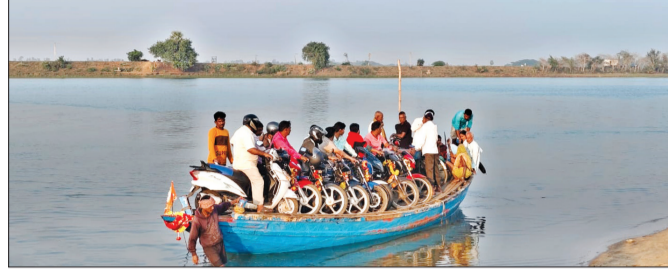
ଲାଭପୂ ଜ୍ୟାକେଟ, ପଞ୍ଜିକରଣ, ଲାଭସେନ୍ଦ୍ର ନେଇ ଆଶଙ୍କା ତଥ୍ୟ ଦେଉଳି ମହାକାଳପଡ଼ା ପଞ୍ଚାୟତ ସମିତି

ମହାକାଳପଡ଼ା, ୪୧୧ (ସଂଚାର ବ୍ୟୁରୋ): ତେର ଗାଁ-ମହାକାଳପଡ଼ା ଘାଟକୁ ନେଇ ଏବେ ସମେତ ବନ୍ଧିଛି । ବିନା ଲାଭ ପ୍ରାପ୍ତି ଘଟଣାରେ ବିପଦପୂର୍ଣ୍ଣ ନୌକା ଯାତ୍ରା ସମ୍ପର୍କରେ ସଂଚାରରେ ଗତ ୨୭ ତିଥିସମ୍ପର୍କରେ ଖବର ପ୍ରକାଶ ପାଇଥିଲା । ପ୍ରତିଦିନ ଶହ ଶହ ଲୋକେ ଜୀବନକୁ ପାଣି ଛାଡ଼ି ଚାଲିବାର, ଜୀବନ ଓ ଦରକାରୀ କାର୍ଯ୍ୟ ପାଇଁ ଏହି ଘାଟ ଉପରେ ନିର୍ଭର କରନ୍ତି । ହେଲେ ବିନା ଲାଭ ପ୍ରାପ୍ତି ଘଟଣାରେ ଆବଶ୍ୟକତା ଠାରୁ ଅଧିକ ଲୋକେ ଜୀବନ ଘାଟିଆ ତଳା ଚଳାଇବା ଉପରେ ରହିଥିଲା । ହେଲେ ଆଜି ସଂଚାର ହାତରେ ଯେଉଁ ଚପା ଲାଗିଛି ତାହା ସମ୍ପୂର୍ଣ୍ଣ ଆଶ୍ଚର୍ଯ୍ୟଜନକ ।