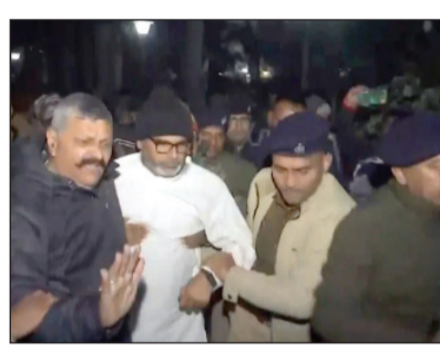
ଗାନ୍ଧୀ ମୈଦାନ ଖାଲିକଲା ପୁଲିସ

ପାଟଣା, ୬:୧: ଅନେକଙ୍କର ଦସିଆଁ ବେଳେ ଭୋର ୪ଟାରେ ଉଠାଇନେଇଥିଲା ପୁଲିସ। ପରେ ସକାଳେ ଗିରଫ କରିଥିଲା। ଏବେ ମଧ୍ୟାହ୍ନରେ ମିଳିଲା ଜାମିନ।