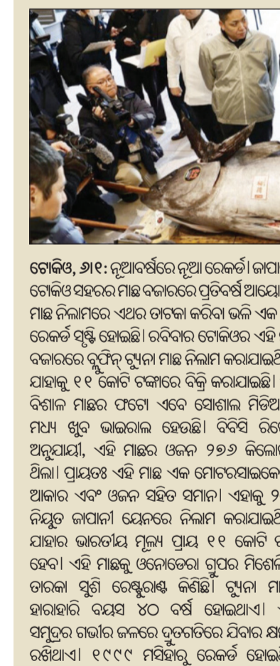
ଗୋଟିଏ, ୬:୧: ନୂଆଦିଲ୍ଲୀରେ ନୂଆ ରେକର୍ଡ଼। କାପାଳର ଗୋଟିଏ ସହରର ମାଛ ବଜାରରେ ପ୍ରତିଦିନ ଆୟୋଜିତ ମାଛ ନିଲାମରେ ଏଥର ତାଟକା କରିବା ଭଳି ଏକ ବଡ଼ ରେକର୍ଡ଼ ସୃଷ୍ଟି ହୋଇଛି।

ଦମ୍ପତି ଅନୁଯାୟୀ, ଗୋଟିଏ ମାଛ ମାର୍କେଟରେ ଦର୍ଶନ ପ୍ରଥମ ନିଲାମରେ ଏହା ହେଉଛି ଦ୍ୱିତୀୟ ସର୍ବାଧିକ ମୂଲ୍ୟ। ମିଶେଲିନ୍ ଦ୍ୱାରା ଉନ୍ନତତରା ଗୁପ୍ତ ସୂତ୍ରୀ ରେକର୍ଡ଼ରୁ ଏହା ସ୍ୱୀକୃତି ପାଇଥିଲା।