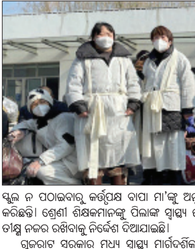
ସ୍ୱଳ୍ପ ନ ପଠାଇବାରୁ କର୍ତ୍ତୃପକ୍ଷ ବାପା ମା'ଙ୍କୁ ଅନୁରୋଧ

ନୂଆଦିଲ୍ଲୀ, ୬:୧: ଭାରତକୁ ପୁଣି ଚରାଇବା ଆରମ୍ଭ କରିଛି ତାଜିକିସ୍ତାନ ଆତଙ୍କ ଖୋଲାଯିବା ଏବଂ ଏମପିଭି ଭାଇରସ। କରୋନା ଭଳି ଶ୍ୱାସକ୍ରିୟାରେ ସମସ୍ୟା ସୃଷ୍ଟି କରୁଥିବା ଏହି ଭାଇରସରେ ଭାରତରୁ ୩ ଜଣ ଚିକିତ୍ସ ହୋଇସାରିଲେଣି।