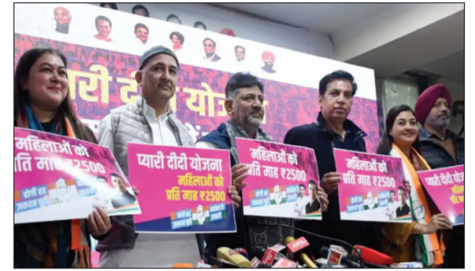
ମହିଳା ଭୋଟରଙ୍କ ପାଇଁ କଂଗ୍ରେସର ଘୋଷଣା

ଏହା ନିଶ୍ଚିତ ଭାବେ ଏକ ବିଚାର ବିଷୟ। ଏଭଳି ପରିସ୍ଥିତିରେ ଜାତୀୟ ସଙ୍ଗୀତ ତଥା ଭାରତୀୟ ସମ୍ବିଧାନର ଅଧିକାର ଅଂଶବିଶେଷ ନ ହୋଇ ରାଜ୍ୟପାଳ ଅଧିକାରୀଙ୍କ ଦାୟିତ୍ୱ କରାଯାଇପାରେ।