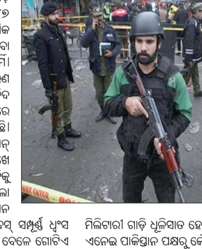
ପାକିସ୍ତାନ ସେନା ଗାଡ଼ି ଉପରେ ଆତ୍ମଘାତୀ ହମଲା

ଘଟଣାସ୍ଥଳରେ, ୬:୧: ପାକିସ୍ତାନ ସେନା ଗାଡ଼ି ଉପରେ ଆତ୍ମଘାତୀ ହମଲା। ବିଶ୍ୱେରଗଡ଼ରେ ୪୭ ମୃତ୍ୟୁକର୍ମୀ ନିହତ ହୋଇଛନ୍ତି।