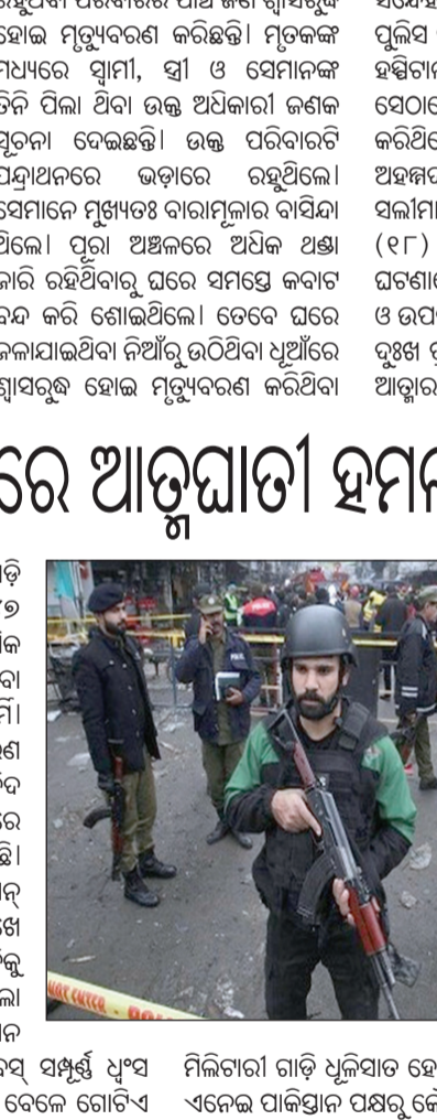
ଘଟଣାସ୍ଥଳରେ ପହଞ୍ଚିଥିବା ପୁଲିସ୍ ଅଫିସର

ଶ୍ରୀନଗର, ୬:୧: ବନ୍ଦୁରୁ ୫ ଜଣଙ୍କ ମୃତଦେହ ମିଳିଥିବା ବେଳେ ସେମାନେ ସମସ୍ତେ ଶୋଇଥିବା ଅବସ୍ଥାରେ ଶ୍ୱାସରୁଦ୍ଧ ହୋଇ ମୃତ୍ୟୁବରଣ କରିଥିବା ଜଣାପଡ଼ିଛି।