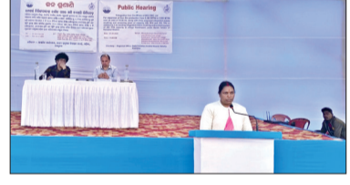
ଲୋକଙ୍କ ସର୍ତ୍ତମୂଳକ ସମର୍ଥନ

ଯୋଡ଼ା, ୭୧୧ (ସଂଚାର ବ୍ୟୁରୋ) : କେନ୍ଦୁଝର ଜିଲ୍ଲା, ବଡ଼ବିଲ ତହସିଲ ଅନ୍ତର୍ଗତ ଓଡ଼ିଶା ଖଣି ନିଗମ (ଏ-ଏମସି)ଲିମିଟେଡ଼ର ମେସର୍ସ ତିରିଙ୍ଗା ପାହାଡ଼ ଲୋହି ପଥର ଖଣିରୁ ଖଣିକ ଉତ୍ପାଦନ ବୃଦ୍ଧି ନିମନ୍ତେ ଜନ ଶୁଣାଣି ଅନୁଷ୍ଠିତ ହୋଇଯାଇଛି । କୁନ୍ଦୁରପାଣି ଗ୍ରାମରେ ୭୯.୩୦ ହେକ୍ଟର ପରିମିତ ଅଂଚଳରେ ଲୋହି ଖଣିକ ଉତ୍ପାଦନ କ୍ଷମତା ବାର୍ଷିକ ୦.୩୨୮ ଏମଟିପିଏବୁ ୦.୯୯୫ ଏମଟିପିଏବୁ ବୃଦ୍ଧି କରି ବର୍ତ୍ତମାନ ବିଦ୍ୟମାନ ୧ ଟି ୨୦୦ ଟିପିଏବୁ କ୍ଷମତା ବିକ୍ଷିପ୍ତ ଇଣ୍ଡିଗ୍ରେଟେଡ ମୋବାଇଲ କ୍ରିସି ଏବଂ ସିନି ପ୍ରକଳ୍ପ ସହିତ ଅତିରିକ୍ତ ପ୍ରସାଦିତ ୨୦୦ ଟିପିଏବୁ ଏବଂ ୨୫୦ ଟିପିଏବୁ କ୍ଷମତା ବିକ୍ଷିପ୍ତ ୨ଟି ଇଣ୍ଡିଗ୍ରେଟେଡ ମୋବାଇଲ କ୍ରିସି ଏବଂ ସିନି ପ୍ରକଳ୍ପ ପ୍ରକଳ୍ପ କରିବା ନିମନ୍ତେ ରାଜ୍ୟ ପରିବେଶ ପ୍ରଦାନ ମୁକାବଳୀ କର୍ତ୍ତୃପକ୍ଷ ଓଡ଼ିଶା ଦ୍ଵାରା ପରିବେଶୀୟ ମଞ୍ଜୁରୀ ନିମନ୍ତେ ଜନ ଶୁଣାଣି ଅନୁଷ୍ଠିତ ହୋଇ ଯାଇଛି । ପରିବେଶୀୟ ମଞ୍ଜୁରୀ ଅନୁମୋଦନ ନିମନ୍ତେ ରାଜ୍ୟ ପ୍ରଦେଶ ନିୟନ୍ତ୍ରଣ ବୋର୍ଡ, ଓଡ଼ିଶା ଏବଂ ଉପସ୍ଥାପନ କରାଯାଇଥିଲା । ପ୍ରକଳ୍ପ ହେବା ଦ୍ଵାରା କେଉଁ ସବୁ ପ୍ରଭାବ ପଡ଼ିବ ଏବଂ ତାହାର ନିରାକରଣ କିପରି କରାଯିବ ସେନେଇ ସେ ସର୍ବଶେଷ ତଥ୍ୟ ପ୍ରଦାନ କରିଥିଲେ । ଏହାପରେ ଖଣି କାର୍ଯ୍ୟ ଦ୍ଵାରା ପ୍ରଭାବିତ ହେବାକୁ ଥିବା ଗ୍ରାମବାସୀ ଜନଶୁଣାଣୀରେ ନିଜର ମତାମତ ବ୍ୟକ୍ତ କରିଥିଲେ, ଯାହାକୁ ଲିପିବଦ୍ଧ କରାଯିବା ସହ ଭିତ୍ତି ଓ ରେକର୍ଡି କରାଯାଇଥିଲା । ପ୍ରକଳ୍ପକୁ ସମର୍ଥନ ଜଣାଇବା ସହିତ ସ୍ଥାନୀୟ ଅଞ୍ଚଳରେ ପ୍ରଭାବିତ ଗ୍ରାମ ଗୁଡ଼ିକରେ ଶିକ୍ଷା, ସ୍ଵାସ୍ଥ୍ୟ, ଗମନାଗମନ, ପାନୀୟ ଜଳର ସୁବିଯୋଗ, ଫଳ ଦୁଗ୍ଧ ଯୋଗ୍ୟ ଏବଂ ନିୟୁତ୍ ଆଦି ଦାବି କରିଥିଲେ ଗ୍ରାମବାସୀ । ତେବେ ଲୋକଙ୍କ ଦାବିକୁ ସମ୍ମାନ ଜଣାଇ ସେବେଦୁଳି ଯଥା ସମ୍ଭବ ପୂରଣ କରିବା ପାଇଁ ଏ-ଏମସି ପକ୍ଷରୁ ପ୍ରତିଶ୍ରୁତି ଦିଆଯାଇଥିଲା । କୁନ୍ଦୁରପାଣି, ଖଣ୍ଡପଡ଼ା, କୋଲ୍‌ହୋ ରୋଡ଼ା, ଭୂୟାଁ ରୋଡ଼ା, ଦଳପାହାଡ଼ ସମେତ ଅନ୍ୟ ଗ୍ରାମର ପ୍ରାୟ ୨ ହଜାରରୁ ଅଧିକ ପ୍ରଭାବିତ ଗ୍ରାମବାସୀ ଜନଶୁଣାଣୀରେ ସାମିଲ ହୋଇଥିଲେ ।