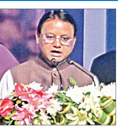
ତ୍ରିନିଦାଦ ଓ ଡୋବାଗୋର ରାଷ୍ଟ୍ରପତି କ୍ରିଷ୍ଣନ୍ କର୍ଲା କର୍ମାଳୁଙ୍କୁ ଧନ୍ୟବାଦ ଦେଇଛନ୍ତି। ତାଙ୍କ ଅଭିଭାଷଣରେ ମୁଖ୍ୟମନ୍ତ୍ରୀ କହିଛନ୍ତି ଯେ ତାଙ୍କ ଦର୍ଶନ ପ୍ରବାସୀ ଭାରତୀୟ ଦିବସର ବିଷୟବସ୍ତୁ 'ଏକ ବିକଶିତ ଭାରତରେ ପ୍ରବାସୀଙ୍କ ଅବଦାନ', ଯାହା ଅମୃତ କାଳରେ

ଭୁବନେଶ୍ୱର : ବିଶ୍ୱପ୍ରସିଦ୍ଧ ଭିଜିଭିଏମ୍, ନିବେଶକ ଅନୁକୂଳ ନୀତି ଏବଂ ଯୁବ, କୁଶାଳୀ ଶ୍ରମଶକ୍ତି ସହିତ ଓଡ଼ିଶା ବ୍ୟବସାୟ ଓ ଉଦ୍ୟୋଗୀମାନଙ୍କ ପାଇଁ ଉପଯୁକ୍ତ ଗଢ଼ବ୍ୟୟନ। ପ୍ରଧାନମନ୍ତ୍ରୀ ନରେନ୍ଦ୍ର ମୋଦିଙ୍କ ପୂର୍ବୋଦ୍ଦେଶ୍ୟ, ଭିଜିଭିଏମ୍ କେନ୍ଦ୍ରରେ ରହିଛି ଓଡ଼ିଶା। ପ୍ରଧାନମନ୍ତ୍ରୀଙ୍କ ମାର୍ଗଦର୍ଶନରେ ଓଡ଼ିଶାର ବିକାଶ ଯାତ୍ରାର ସୁବର୍ଣ୍ଣ ଯୁଗ ଆରମ୍ଭ ହୋଇଯାଇଛି ବୋଲି ଆଜି ଏଠାରେ ପ୍ରବାସୀ ଭାରତୀୟ ସମ୍ମିଳନୀର ଉଦଘାଟନା ଉତ୍ସବରେ ମତ ଦେଇଛନ୍ତି ମୁଖ୍ୟମନ୍ତ୍ରୀ ଗୋବିନ୍ଦ ଚରଣ ମାଣି। ସେ କହିଛନ୍ତି ଯେ ବିଶ୍ୱ ପ୍ରବାସୀ ଭାରତୀୟଙ୍କ ସହଯୋଗ ଭାବେ ଆପଣମାନେ ବିଶ୍ୱରେ ଆମର ରାଷ୍ଟ୍ରକୁ ଓଡ଼ିଶା ଓ ଭାରତର ଉନ୍ନତ ଭବିଷ୍ୟତ ଗଢ଼ିବା ଦିଗରେ ଆପଣମାନେ ପ୍ରସ୍ତୁତ ହୁଅନ୍ତୁ। ଆମେ ସମସ୍ତେ ମିଶି ପ୍ରଧାନମନ୍ତ୍ରୀଙ୍କ ସୁପୁଲ୍ ସାଧାରଣ କରିପାରିବା। ଏହି ଅବସରରେ ମୁଖ୍ୟମନ୍ତ୍ରୀ ଭର୍ତ୍ତୀୟ ପୁରୁଷମାନଙ୍କୁ ମୁଖ୍ୟ ଅଭିଯି ଭାବେ ଯୋଗଦେଇଥିବାରୁ