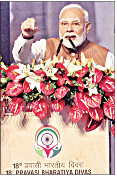
18th Pravasī Bhāratīya Divas 18th Pravasī Bhāratīya Divas

ଭୁବନେଶ୍ୱର, ୯୧୧ (ସଂଚାର ବ୍ୟୁରୋ): ପ୍ରଧାନମନ୍ତ୍ରୀ ନରେନ୍ଦ୍ର ମୋଦି ଆଜି ଏଠାରେ ଅଷ୍ଟାଦଶ ପ୍ରବାସୀ ଭାରତୀୟ ଦିବସ ସମ୍ମିଳନୀକୁ ଉଦଘାଟନ କରିଛନ୍ତି। ବିଶ୍ୱର ବିଭିନ୍ନ କୋଣରୁ ଆସିଥିବା ପ୍ରତିନିଧି ଓ ପ୍ରବାସୀ ଭାରତୀୟଙ୍କୁ ସ୍ୱାଗତ କରି ପ୍ରଧାନମନ୍ତ୍ରୀ କହିଛନ୍ତି ଯେ ଭାରତ ସବୁବେଳେ ଶାନ୍ତି ବାଣୀ ଦେଇଆସିଛି। ବିଶେଷକରି ଓଡ଼ିଶାର ଐତିହାସିକ ଶାନ୍ତିପ୍ରସ୍ତୁତ ଧରଣ ଶାନ୍ତିବାଣୀ ପ୍ରଦାନ କ୍ଷେତ୍ରରେ ମୁକ୍ତସାକ୍ଷୀ ଭାବେ ଛିଡ଼ା ହୋଇଛି। ସମଗ୍ର ବିଶ୍ୱ ଯେତେବେଳେ ଖଡ଼ଗର ମାର୍ଗ ବାଛି ସାମ୍ରାଜ୍ୟ ବିସ୍ତାର କରୁଥିଲା, ସମ୍ରାଟ ଅଶୋକ ଏଠାରେ ଶାନ୍ତିର ମାର୍ଗ ବାଛିଥିଲେ। କାରଣ ବିଶ୍ୱର ଭବିଷ୍ୟତ ଯୁଦ୍ଧରେ ନୁହେଁ ବରଂ ବୁଦ୍ଧଙ୍କ ଉପରେ ନିର୍ଭର କରେ ବୋଲି ଭାରତର ପରମ୍ପରା ବିଶ୍ୱକୁ ବାଣୀ ଦେଇଛି । ଓଡ଼ିଶାର ଭୂମିକୁ ସମଗ୍ରଙ୍କୁ ସ୍ୱାଗତ କରିବା ତାଙ୍କ ପାଇଁ ଅତ୍ୟନ୍ତ ସ୍ୱତନ୍ତ୍ର ବୋଲି ଶ୍ରୀ ମୋଦି କହିଛନ୍ତି।