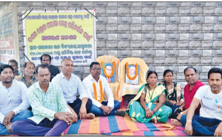
ଅନଶନ ଜାରି ରଖିଥିବା ଜଣାପଡିଛି। ଘଟଣାକୁ ନେଇ ଅଞ୍ଚଳରେ ଏକ ପ୍ରକାର ଅସନ୍ତୋଷ ଦେଖାଦେଇଥିବା ବେଳେ ଅଭିଭାବକ ଓ ବୃଦ୍ଧିକାରୀ ମହଲରେ ବିସ୍ମୟ ପ୍ରକାଶ ହୋଇଛି। ସୂଚନା ଅନୁଯାୟୀ ସରକାରଙ୍କ ନିୟମକୁ ଉଲ୍ଲଙ୍ଘନ କରି ୨୫କିମି ଦୂରରେ ଥିବା ମୁନିଗୁଡ଼ା ଠାରେ ଦୀର୍ଘ ୧୦ ବର୍ଷ ହେବ ପରୀକ୍ଷା କେନ୍ଦ୍ର କରାଯାଇଛି, ଯାହାକୁ ବିରୋଧକରି ଏହି ଆନ୍ଦୋଳନ ଆରମ୍ଭ କରାଯାଇଥିବା ଜଣାପଡିଛି। ମୁନିଗୁଡ଼ା ପରୀକ୍ଷା କେନ୍ଦ୍ର ଯିବା ସମୟରେ ଛାତ୍ରଛାତ୍ରୀ ଅନେକ ଅସୁବିଧାର ସମ୍ମୁଖୀନ ହେଉଛନ୍ତି।