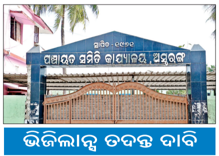
ଭିଜିଲାନ୍ସ ତଦନ୍ତ ଦାକି

କାକଟପୁର/ଅସ୍ତରଙ୍ଗ, ୧୨୧୧ (ସଂଚାର ବ୍ୟୁରୋ): ସରକାର ବୃଦ୍ଧତା, ଅସହାୟ, ବିଧବା ମହିଳା ଓ ଦିବ୍ୟାଙ୍ଗଙ୍କୁ ସାମାଜିକ ସୁରକ୍ଷା ଯୋଗାଇ ଦେବା ପାଇଁ ବିଭିନ୍ନ ଭାଗ ପ୍ରଦାନ କରୁଛନ୍ତି। ହେଲେ ପୁରୀ ଜିଲ୍ଲା ଅସ୍ତରଙ୍ଗ ବ୍ଲକ୍ ୧୫ଗୋଟି ପଂଚାୟତରେ ଏହି ଯୋଜନାରେ ବଡ଼ କେଳେଙ୍କାରୀ ହୋଇଥିବା ନକରକୁ ଆସିଛି। କେଉଁଠି ଭେଣ୍ଡିଆଙ୍କୁ ବାଉଳ୍ୟ ଭଉଁ ପ୍ରଦାନ କରାଯାଉଛି ତ ଆଉ କେଉଁଠି ବିଧବାଙ୍କୁ ବିଧବା ଭଉଁ ଦିଆଯାଉଛି। କେବଳ ସେତିକି ନୁହେଁ ୮୦ ବର୍ଷରୁ କମ୍ ବୃଦ୍ଧତାକୁ ୮୦ ବର୍ଷ ବର୍ଦ୍ଧିତ ଭଉଁ ପ୍ରଦାନ କରାଯାଉଛି। ଏପରିକି ପୁରୁଷଙ୍କୁ ମଧ୍ୟ ବିଧବା ଭଉଁ ପ୍ରଦାନ କରାଯାଉଥିବା ଭଳି ସାଂଘାତିକ କେଳେଙ୍କାରୀ ନକରକୁ ଆସିଛି। ଏହାକୁ ନେଇ ସାଧାରଣ ଚର୍ଚ୍ଚା ହେଉଛି।