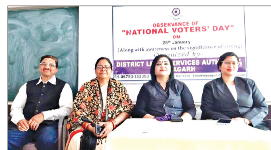
ମାନଙ୍କୁ ମତଦାତାଙ୍କ ସଂକଳ୍ପପାଠ କରାଉଥିଲେ । “ଆମେ ଭାରତର ନାଗରିକ ଭୂତ, ଗଣତନ୍ତ୍ରରେ ନିଜର ପୂର୍ଣ୍ଣ ଆତ୍ମତା ରଖି ଏହି ଶପଥ ନେଉଛୁ କି ଆମେ ନିଜ ଦେଶର ଗଣତାନ୍ତ୍ରିକ ପରମ୍ପରା ମର୍ଯ୍ୟଦା