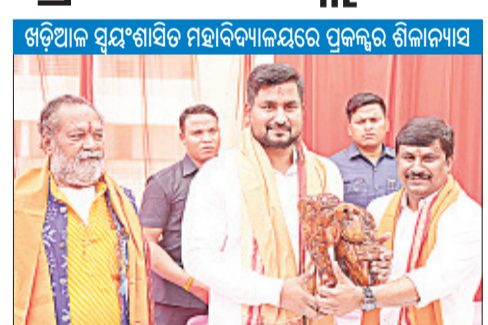
ଖଡ଼ିଆଳ ସ୍ୱୟଂଶାସିତ ମହାବିଦ୍ୟାଳୟରେ ପ୍ରକଳ୍ପର ଶିଳାନ୍ୟାସ