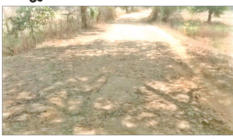
ଜିଲ୍ଲା ପ୍ରଶାସନ ନିକଟରେ ଦାବି କରିଛନ୍ତି । ଏବେ ଯାତାୟତ କରିବା ପାଇଁ ଏହି ରାସ୍ତାକୁ ନେଇ ଜନଅସନ୍ତୋଷ ହେଉଛି । ଏହା ଉପରେ ମୁଁକିଛି କହିପାରିବି ନାହିଁ । ସେହି ବିଭାଗର ଅଧିକାରୀ ତାର ଉତ୍ତର ଦେବେ ଏହାକୁ କୁହନ୍ତି ଯିଏ ଏହି ବିଭାଗର ଅଧିକାରୀ ସେମାନଙ୍କ ସହ ।

ଖପ୍ରାଖୋଲ, ୨୮୧୧ (ସଂଚାର ବ୍ୟୁରୋ) : ଖପ୍ରାଖୋଲ ବୁକ୍ ବଡ଼ଗୁଳିଭଙ୍ଗା ଠାରୁ ଘୁନସର ବନ୍ଦାର ପର୍ଯ୍ୟନ୍ତ ଯାଉଥିବା ରାସ୍ତାର ଅବସ୍ଥା ଗୋଟାଏ ହୋଇପାରି ନାହିଁ । ଏହି ରାସ୍ତା ଚିକିତ୍ସା ଚାରି ବର୍ଷ ଧରି ଏଭଳି ପରିସ୍ଥିତି ଯୋଗୁଁ ଲୋକଙ୍କ ପାଇଁ ଏବେ ଏହା ମରଣସଙ୍ଗା ପାଲଟିଛି । ଫଳରେ ଏହି ରାସ୍ତା ଉପରେ ନିର୍ଭରଶୀଳ ଜନସାଧାରଣ ଓ ଯାନ ବାହାନ ଯାତାୟତ କରୁଥିବା ଲୋକେ ଯୋଗ ଅସୁବିଧାର ସମ୍ମୁଖୀନ ହେଉଛନ୍ତି । ବିଶେଷ କରି ରାତ୍ରି ସମୟରେ ଏହି ରାସ୍ତାରେ ଯାତାୟତ ଅସମ୍ଭବ ହୋଇପାରେ । କାରଣ ରାସ୍ତା ସାରା ଖାଲଖାଳ ଭରିରହିଥିବା ଯୋଗୁଁ କେତେକେଲେ କେବଳ ସମୟରେ ଦୁର୍ଘଟଣା ଘଟିବାର ସମ୍ଭାବନା କୁ ଏଭଳି ଅଧିକାରୀଙ୍କୁ ସୂଚନା ଦେବାକୁ ପଡ଼ିଛି ।