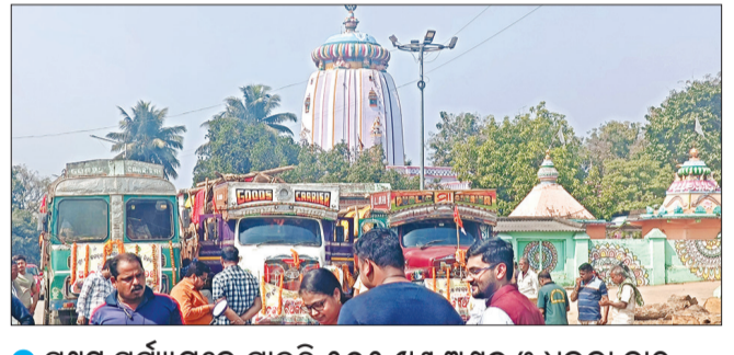
ପ୍ରଥମ ପର୍ଯ୍ୟାୟରେ ଯାଇ ୧୦୧ ଖଣ୍ଡ ଅଶନ ଓ ଧଉରା କାଠ