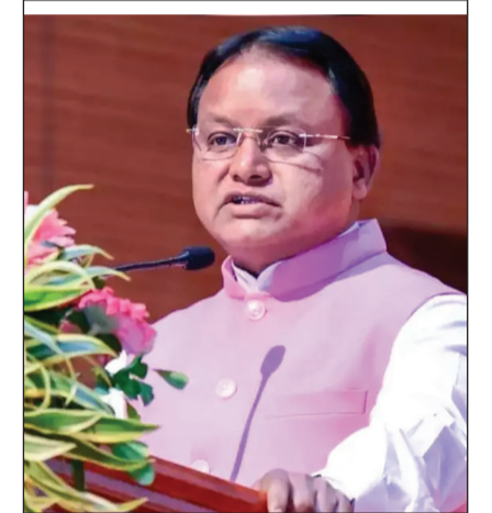
ପଞ୍ଚା ବହି ସାଙ୍ଗକୁ ଉତ୍ତରବେଙ୍ଗ ସୁବିଧା ମିଳିବ। ସକାଳ ୯ଟାରୁ ରାତି ୯ଟା ପର୍ଯ୍ୟନ୍ତ ଏହା ଖୋଲା ରହିବ। ପ୍ରତିଯୋଗିତାମୂଳକ ପରୀକ୍ଷା ପାଇଁ ପ୍ରସ୍ତୁତ ହେଉଥିବା ପିଲାମାନେ ଏଠାରେ ସ୍ୱଳ୍ପ ଦେୟ ଦେବେ ୯-ପୃଷ୍ଠା-୬

ଟଙ୍କାର ପାଞ୍ଚ ଆବଣ୍ଟନ ହେବ। ପ୍ରତି ଗାଁରେ ଭଲ ରାସ୍ତା ନିର୍ମାଣ ପାଇଁ ଟଙ୍କା ଦିଆଯିବ। ଗାଁରେ ବୁକ୍ ଟ୍ୟୁ ଟୋର୍, କଂପ୍ୟୁଟର ଓ ପେଭର ବୁକ୍ ରାସ୍ତା ତିଆରି ହେବା ଆବଶ୍ୟକ ସ୍ଥାନରେ ଟ୍ରେକ୍ ବି ନିର୍ମାଣ ହେବ। ତେବେ ପଞ୍ଚାୟତକୁ ମିଳିଥିବା ମୋଟ ପାଞ୍ଚର ୩୫ ପ୍ରତିଶତ କେବଳ ରାସ୍ତା ନିର୍ମାଣ ପାଇଁ ଖର୍ଚ୍ଚ ହେବ। ଏହାଠାରୁ ଅଧିକ ଟଙ୍କା ରାସ୍ତା ନିର୍ମାଣ ପାଇଁ ଖର୍ଚ୍ଚ କରିହେବନାହିଁ। ସଂରକ୍ଷିତ କଳ୍ପ ଓ କଳ୍ପ ଅଞ୍ଚଳରେ ରହିଥିବା ଲୋକଙ୍କ ପାଇଁ ମଧ୍ୟ ମୋଟାମୋଟା ମାନର ରାସ୍ତା ନିର୍ମାଣ କରାଯିବ। ପୂର୍ବରୁ ଆମ ଓଡ଼ିଶା, ନବୀନ ଓଡ଼ିଶା ଯୋଜନାରେ କଳ୍ପ ଅଞ୍ଚଳରେ ରାସ୍ତା ତିଆରି ଉପରେ କଟକଟା ଥିଲା। ଏଣିକି ଏହି ଯୋଜନା ଅଧୀନରେ ପ୍ରତି ବ୍ଲକ୍ରେ ରିଡିଂ ରୁମ୍ ବା ପଠନ ଗୃହ ବ୍ୟବସ୍ଥା କରାଯିବ। ଏଠାରେ