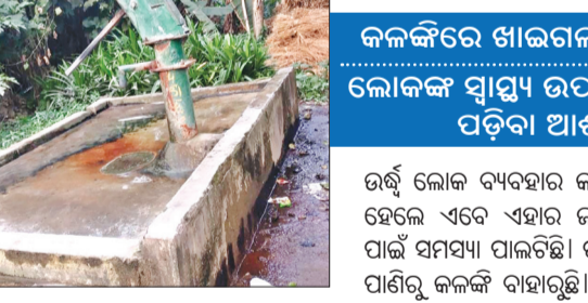
ନଳକୂପରୁ ବାହାରୁଛି କଳଙ୍କି, ହେଉନି ଜଳ ପରୀକ୍ଷଣ

ପରୀକ୍ଷା କରାଯାଉଛି, ନା ଲୋକଙ୍କୁ ପାଣି ସମ୍ପର୍କରେ ସୂଚନା ପ୍ରଦାନ କରାଯାଇଛି । କାର୍ଯ୍ୟକ୍ରମ ପାଇଁ ଛାତ୍ରଛାତ୍ରୀଙ୍କୁ ମୁହଁରେ କପଡ଼ା ବାନ୍ଧି ଲୋକେ ସେହି ନଳକୂପ ପାନୀୟ ଜଳ ଭାବରେ ବ୍ୟବହାର କରୁଛନ୍ତି । ବିଭାଗୀୟ କର୍ମଚାରୀ କେବଳ ନଳକୂପରେ ଭଙ୍ଗ ମାରି ତାଙ୍କର କାମ ସାରିଦେଉଛନ୍ତି । ଏମିତି ଅଭିଯୋଗ ଆଣି ଲୋକେ ବିଭାଗୀୟ ଅଧିକାରୀଙ୍କ ଉପରେ ପ୍ରଶ୍ନ ବଢ଼ିଛନ୍ତି । ଏଠି ପ୍ରଶ୍ନ ଯଦି ନଳକୂପରୁ ଏମିତି ପାଣି ବାହାରୁଛି ତେବେ ଏ ପାଣି ବ୍ୟବହାର କରି ଲୋକଙ୍କ ସ୍ୱାସ୍ଥ୍ୟ ଠିକ୍ ରହିବ ତ ? ଦୁର୍ଘଟ ବିଭାଗୀୟ ଅଧିକାରୀ ଏଥିପ୍ରତି ଦୃଷ୍ଟି ଦେଇ ନଳକୂପ ମରାମତି ସହ କଳଙ୍କି ସୂକ୍ଷ୍ମ ନୁହାଁ ଶରୀରକୁ ବଦଳାଇ ଲୋକଙ୍କ ପାଇଁ ବିଶୁଦ୍ଧ ପାନୀୟ ଜଳ ଯୋଗାଇ ଦେବାକୁ ଦାବି ହେଉଛି ।