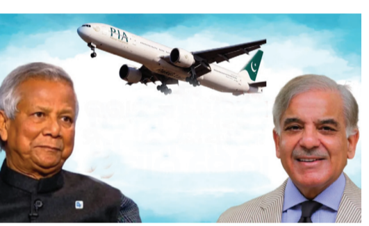
ପାକ ଏୟାରଲାଇନ୍ସକୁ ଅନୁମତି ଦେଲେ ଯୁନୁସ୍ ସରକାର

ଢାକା, ୪୧: ବାଂଲାଦେଶର ମହାନନ୍ଦ ଯୁନୁସ୍ କେନ୍ଦ୍ରୋଧାନ ମଧ୍ୟବର୍ତ୍ତୀକାଳୀନ ସରକାର କରାତୀ ଏବଂ ଢାକା ମଧ୍ୟରେ ସିଧାସଳଖ ବିମାନ ସେବା ପାଇଁ ଏକ ପାକିସ୍ତାନୀ ଘରୋଇ ବିମାନ କମ୍ପାନୀକୁ ଅନୁମୋଦନ ଦେଇଛନ୍ତି। ଦଶନ୍ଧି ପରେ ବାଂଲାଦେଶ-ପାକିସ୍ତାନର ଦୁଇଟି ପ୍ରମୁଖ ସହର ମଧ୍ୟରେ ବିମାନ ସଂଯୋଗ ପୁନଃସ୍ଥାପନ ପାଇଁ ବାଟ ଖୋଲିଛି। ଗତ କିଛି ମାସ ମଧ୍ୟରେ ବାଂଲାଦେଶ ଏବଂ ପାକିସ୍ତାନ ମଧ୍ୟରେ ସମ୍ପର୍କରେ ବୃତ୍ତ ଉନ୍ନତି ହୋଇଛି। ଏହି ନିଷ୍ପତ୍ତି ମଧ୍ୟ ଏହିପରି ଏକ ବଡ଼ ପଦକ୍ଷେପ। ଗତ ବର୍ଷ ଅଗଷ୍ଟ ମାସରେ ବ୍ୟାପକ ବିରୋଧ ପୂର୍ବକ ପରେ ପୂର୍ବତନ ବାଂଲାଦେଶ ପ୍ରଧାନମନ୍ତ୍ରୀ ଶେଖ ହସିନାଙ୍କ ସରକାରର ପତନ ଘଟିଥିଲା। ଶେଖ ହସିନାଙ୍କୁ ଭାରତ-ସମର୍ଥନ ଭାବରେ ଦେଖାଯାଏ। ହସିନାଙ୍କ ପତନ ବାଂଲାଦେଶର ମଧ୍ୟବର୍ତ୍ତୀକାଳୀନ ସରକାରଙ୍କ ନେତୃତ୍ୱ ନେଉଥିବା ମହାନନ୍ଦ ଯୁନୁସ୍ ପାକିସ୍ତାନ ସହିତ ସମ୍ପର୍କ ଉନ୍ନତ କରିବା ଉପରେ ଧ୍ୟାନ ଦେଇଛନ୍ତି। ଦି ନ୍ୟୁସ୍ ରିପୋର୍ଟ ଅନୁଯାୟୀ, ବାଂଲାଦେଶର ବେସାମରିକ ବିମାନ ଚଳାଚଳ କର୍ତ୍ତୃପକ୍ଷ (ସିଏଏସ୍) ର ଅଧ୍ୟକ୍ଷ ଏୟାର ଇଣ୍ଡିଆ ପାଇଁ ମହାନନ୍ଦ ଯୁନୁସ୍ କରାତୀ କରାତୀ ପୂର୍ବରୁ ପାକିସ୍ତାନୀ ବିମାନ କମ୍ପାନୀକୁ ବାଂଲାଦେଶରେ ଏକ ଲିଏସଏ ନିୟୁତ୍ତ କରିବାକୁ ଅନୁମତି ଦିଆଯାଇଛି। ତଥାପି, କାର୍ଯ୍ୟ ଆରମ୍ଭ