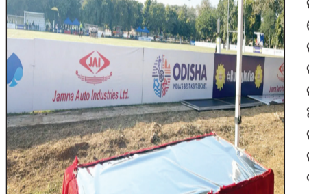
ଦଳ ଅଂଶଗ୍ରହଣ କରୁଛନ୍ତି। ଏଥିରେ ଦିହାର, ଝାଡ଼ଖଣ୍ଡ, ଉତ୍ତରାଖଣ୍ଡ, କାଶ୍ମିର ଇତ୍ୟାଦି ଭଳି ଦଳ ଅଂଶଗ୍ରହଣ କରୁଥିଲା ବେଳେ ଜାତୀୟ ରଗ୍‌ବିରେ ସବୁବେଳେ ଭଲ କରି ଆସୁଥିବା ଓଡ଼ିଶା ଖେଳାଳିମାନେ ନିଜ ପ୍ରତିଭା ପ୍ରଦର୍ଶନରୁ ବଞ୍ଚିତ ହେବାକୁ ଯାଉଛନ୍ତି। ସୁତନାନ୍ତୁ ଯାଉଥିବାବେଳେ ବିକେଡ଼ିରେ ସମ୍ଭାଷଣ ଓ କ୍ରୀଡ଼ାସଂଘ ଦ୍ୱାରା ନିର୍ଦ୍ଧାରିତ ଓ ପାଠିତ ନେତାମାନଙ୍କ ଗତିବିଧି ଉପରେ ଏବେ ସମସ୍ତଙ୍କ ନଜର ରହିଛି।

ସରକାର ଏବଂ ବିଭିନ୍ନ କ୍ରୀଡ଼ା ସଂଘ ମଧ୍ୟରେ ଯେ ସମନ୍ୱୟର ଘୋର ଅଭାବ ସୃଷ୍ଟି ହୋଇଛି, ତାହା ମଧ୍ୟ ଜଳଜଳ ଦେଖାଯାଉଛି। ଜାତୀୟ ୧୫ବର୍ଷରୁ କମ୍ ରଗ୍‌ବି ପ୍ରତିଯୋଗିତାରେ ଉଭୟ ଦଳ ଓ ବାଲିକା ଦଳରେ ୧୧ଟି ଲେଖାଏଁ ହୋଇଥିଲା। ରାଜ୍ୟ ସଂଘ ଏଥିଲାଗି ଆବଶ୍ୟକ ଅର୍ଥ ଯୋଗାଇବା ଲାଗି କ୍ରୀଡ଼ା ବିଭାଗକୁ ମଧ୍ୟ କଣ୍ଠାକ୍ଷେପ ଦେଇ ଥିଲା। କିନ୍ତୁ ତାଙ୍କୁ ଅନୁମତି ମାଗିଥିଲା। ଏହା ପରିବର୍ତ୍ତେ କ୍ରୀଡ଼ା ବିଭାଗ ପରବର୍ତ୍ତୀ ସମୟରେ ଆବଶ୍ୟକ ଅର୍ଥ ଭରଣା କରିବେ ବୋଲି ଅଣାଧିକାରୀ ଭାବେ ସଂଘର କର୍ମଚାରୀଙ୍କୁ କଣ୍ଠାକ୍ଷେପ ଦେଇଥିଲା। ରାଜ୍ୟ ସଂଘ ବି ବେପରୁଆ ଭାବେ ସମୟ ପୂର୍ବରୁ ଖେଳାଳିଙ୍କ ଟିକେଟ କରି ନଥିଲା। ଯାହା ଆଖ୍ୟାୟିକ କଥା। କାରଣ କେବଳ ରାଜ୍ୟ ସଂଘ ନୁହେଁ, ଏହି ପ୍ରତିଯୋଗିତାରେ ଅଂଶଗ୍ରହଣ କରିବା ଲାଗି ରଗ୍‌ବି ଇଣ୍ଡିଆ ମଧ୍ୟ ଏକ ନିର୍ଦ୍ଦିଷ୍ଟ ଅଙ୍କର ଅନୁଦାନ ପ୍ରଦାନ କରିଥାଏ। ତଥାପି ରାଜ୍ୟ ସଂଘ, ରାଜ୍ୟ ସରକାର କିମ୍ବା ରଗ୍‌ବି ଇଣ୍ଡିଆ ସହ ସମନ୍ୱୟ ରଖି କରି ଖେଳାଳିଙ୍କୁ ପୁଲିୟର୍ ପଠାଇବାକୁ କାହିଁକି ବ୍ୟବସ୍ଥା କରାନଗଲା, ତାହା କ୍ରୀଡ଼ାପ୍ରୋମାଙ୍କୁ ବିସ୍ମିତ କରିଛି। ରାଜ୍ୟ କ୍ରୀଡ଼ା ବିଭାଗର ଅଧିକାରୀମାନେ ମଧ୍ୟ ଏହି ବିଷୟକୁ ଆଗେ ଗୁରୁତ୍ୱ ନଦେବା ପରିଚାପର ବିଷୟ। ଯେଉଁଠି ପାଇଁ ଓଡ଼ିଶା ଖେଳାଳି ଏବେ ଜାତୀୟ ପ୍ରତିଯୋଗିତାକୁ ବଞ୍ଚିତ ହୋଇଛନ୍ତି। ଏଥର ଆମେ ଉଭୟ ଦଳରେ ପଦକ ଚିତ୍ତବାର ଯଥେଷ୍ଟ ସମ୍ଭାବନା ଥିଲା। ହେଲେ ରାଜ୍ୟ ସଂଘ ଏବଂ ରାଜ୍ୟ ସରକାରଙ୍କ କଂଗ୍ରେସର ସହାପତି ଭାବେ ଭଲକି ନିୟୁତ୍ତି ଯାଉଥିବାବେଳେ ବିକେଡ଼ିରେ ସମ୍ଭାଷଣ ଓ କ୍ରୀଡ଼ାସଂଘ ଦ୍ୱାରା ନିର୍ଦ୍ଧାରିତ ଓ ପାଠିତ ନେତାମାନଙ୍କ ଗତିବିଧି ଉପରେ ଏବେ ସମସ୍ତଙ୍କ ନଜର ରହିଛି।