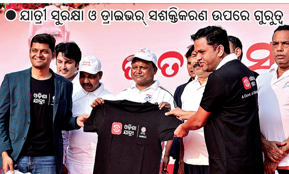
ଯାତ୍ରା ସୁରକ୍ଷା ଓ ଡ୍ରାଇଭର ସଶକ୍ତିକରଣ ଉପରେ ଗୁରୁତ୍ୱ ଏବେ ରାଜ୍ୟବ୍ୟାପୀ ଆହୁରି ବିସ୍ତାର ପାଇଁ ପ୍ରସ୍ତୁତ ହେଉଛି । ଭବିଷ୍ୟତର ଉନ୍ନତରେ ରିଅଲ୍-ଟାଇମ୍ ଟ୍ରିପ୍ ଟ୍ରାକିଂ, ଓଡ଼ିଶା ସହ ସମନ୍ୱୟ, ଏଆଇଆଇଆଇ ସୁରକ୍ଷା ପ୍ରୋଗ୍ରାମ୍ ଓ ମଲ୍ଟି-ମୋଡାଲ୍ ଯାତ୍ରା ଯୋଜନା ଏଥିରେ ଅନ୍ତର୍ଭୁକ୍ତ । ଏହି ବିକାଶଗୁଡ଼ିକ ଓଡ଼ିଶାର ସ୍ୱାର୍ଥ ଓ ସ୍ୱାସ୍ଥ୍ୟ ଗତିଶୀଳତା ଇକୋସିଷ୍ଟମ୍ ମେନ୍ତେ ଉନ୍ନତ ହେଉଛି । ଏହା ଓଡ଼ିଶା ଯାତ୍ରାକୁ ଆହୁରି ସୁଦୃଢ଼ କରିବ ଏବଂ ଲକ୍ଷ ଲକ୍ଷ ଯାତ୍ରୀ ଓ ଡ୍ରାଇଭରଙ୍କୁ ସଶକ୍ତ କରିବ ବୋଲି ଗ୍ରାମ୍ୟ ଯାତ୍ରା ପ୍ରଚଳନ କର୍ତ୍ତାମାନେ କହିଛନ୍ତି ।

ଭୁବନେଶ୍ୱର, ୧୯/୨ (ସଂଚାର ବ୍ୟୁରୋ): ମୁଖ୍ୟମନ୍ତ୍ରୀ ମୋହନ ଚରଣ ମାଝୀଙ୍କ ଉଦ୍ଦେଶ୍ୟରେ ହେବାର ୪୫ ଦିନ ଭିତରେ ଯାତ୍ରାସେବା କ୍ଷେତ୍ରରେ ଉଲ୍ଲେଖନୀୟ ସଫଳତା ହାସଲ କରିଛନ୍ତି ରାଜ୍ୟର ଅଗ୍ରଣୀ ଗତିଶୀଳତା ଆର୍ଥିକ ଓଡ଼ିଶା ଯାତ୍ରା । ଏହି ୪୫ ଦିନ ମଧ୍ୟରେ ଏହି ସେବାଟି ଫାଇଦା ରାଜ୍ୟର ଲକ୍ଷକୋଟି ଉର୍ଦ୍ଧ୍ୱ ଜନସାଧାରଣ ଉଠାଇସାରିଛନ୍ତି । ଫଳରେ ଏହି ଅନଲାଇନ୍ କ୍ୟାସ୍ ପୋର୍ଟାଲ୍ ଉପରେ ଭୁବନେଶ୍ୱର ଓ କଟକ ଯାତ୍ରାଙ୍କ ବିଶ୍ୱାସ ଯଥେଷ୍ଟ ମାତ୍ରାରେ ବୃଦ୍ଧି ପାଇଛି । 'ଓଡ଼ିଶା ଯାତ୍ରା' ଏହାର ଯାତ୍ରାମାନଙ୍କୁ ସୁରକ୍ଷା, ସୁବିଧା ଓ ସୁବିଧା ପ୍ରଦାନ ପାଇଁ ପ୍ରତିଶ୍ରୁତି ଦେଇ ଥିବାବେଳେ ଆଗାମୀ ଦିନରେ ଏହା ରାଜ୍ୟର ସବୁ ସ୍ଥାନରେ ଉପଲବ୍ଧ ହେବା ଦିଗରେ ପ୍ରସ୍ତୁତି ରାଖିଛନ୍ତି । ରାଜ୍ୟ ସରକାରଙ୍କ ସହାୟତାରେ 'ଓଡ଼ିଶା ଯାତ୍ରା' ଦୈନିକ ଯାତ୍ରାମାନଙ୍କ ପାଇଁ ପ୍ରଥମ ପଦକ୍ଷେପ ଗ୍ରହଣ କରାଯାଇଛି । ଯାତ୍ରା ସୁରକ୍ଷା ଓ ଡ୍ରାଇଭର ସଶକ୍ତିକରଣକୁ ପ୍ରାଥମିକତା ଦେବା ପାଇଁ ଚିନ୍ତାଧାରା କରାଯାଇଥିବା 'ଓଡ଼ିଶା ଯାତ୍ରା' ରିଅଲ୍-ଟାଇମ୍ ଟ୍ରିପ୍ ଟ୍ରାକିଂ, ସୁବିଧାମୂଳକ ନିର୍ଦ୍ଦେଶ ଓ ଓଡ଼ିଶା ପୁଲିସ୍ ୧୧୨ କର୍ତ୍ତୃତାଙ୍କ ମାଧ୍ୟମରେ ବ୍ୟବସ୍ଥା ସହ ସମନ୍ୱୟ ଭଳି ପ୍ରମୁଖ ବୈଶିଷ୍ଟ୍ୟଗୁଡ଼ିକ ଉପରେ ଆଧାରିତ । ଯାତ୍ରାମାନେ ସେମାନଙ୍କ ଯାତ୍ରା ବିବରଣୀ ପରିବାର ଓ ବନ୍ଧୁମାନଙ୍କ ସହ ଶେୟାର କରିବାର ବ୍ୟବସ୍ଥା ଓଡ଼ିଶା ଯାତ୍ରାକୁ ସାଧାରଣ ଯାତ୍ରାଙ୍କ ବିଶ୍ୱାସନୀୟତା ବୃଦ୍ଧି କରିଛି । ଏହି ବୈଶିଷ୍ଟ୍ୟଗୁଡ଼ିକ ଆପଣ ସରକାରୀ ସମର୍ଥନ ସହ ମିଳିତ ଭାବେ ବାରମ୍ବାର