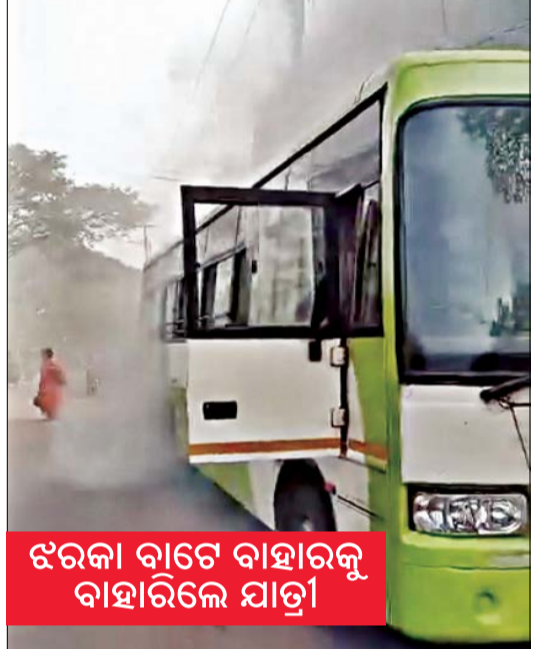
ଝରକା ବାଟେ ବାହାରକୁ ବାହାରିଲେ ଯାତ୍ରୀ