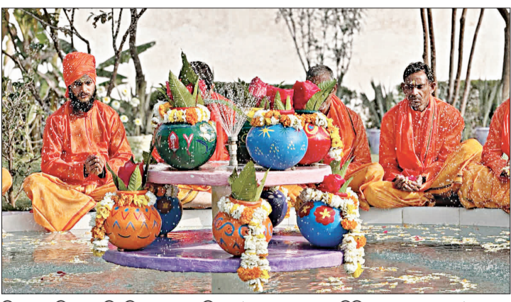
ନିଆଯାଇଥିବା କହିଛନ୍ତି କେଳ ଅଧିକାରୀ ମହାକୁମ୍ଭ ରାଧିକାରୀଙ୍କ କର୍ମଚାରୀମାନେ କାହିଁକି ସେଥିରୁ ବଞ୍ଚିତ ରହିବେ ଭାବି ଏଭଳି ସୁପାସ ଚନ୍ଦ୍ର ଶାନ୍ତ । ପ୍ରୟାଗରାଜରେ

ପ୍ରୟାଗରାଜ, ୨୩/୨ : କୁମ୍ଭ ଜଳରେ ଗାଧୋଇଲେ ପାଖାପାଖି ୯୦ ହଜାର କର୍ମଚାରୀ । ୨୫ଟି କୋଲରେ ବନ୍ଦା ଥିବା କର୍ମଚାରୀଙ୍କୁ କୁମ୍ଭ ଜଳରେ ସ୍ନାନ କରିବା ପାଇଁ ସୁଯୋଗ ଦେଇଛି ଉତ୍ତର ପ୍ରଦେଶର ସରକାର । ପ୍ରୟାଗରାଜ ସଙ୍ଗମକୁ କର୍ମଚାରୀଙ୍କ ପାଇଁ ଆସିଛି ଜଳ । ଯେଉଁ ଜଳରେ ସ୍ନାନ କରି ପୁଣ୍ୟ ଅର୍ଜନ କରିଛନ୍ତି କର୍ମଚାରୀ । ତ୍ରିବେଣୀ ସଙ୍ଗମକୁ ଆସିଥିବା ଜଳକୁ ସାଧାରଣ ଜଳରେ ମିଶାଇ କର୍ମଚାରୀଙ୍କୁ ଗାଧୋଇବା ପାଇଁ ଦିଆଯାଇଛି । ତାହା ପୁଣି କେଳ ପରିସରରେ କେଳ ଭିତରେ ରହି ମଧ୍ୟ ସାହି ସ୍ନାନ କରି ପ୍ରାର୍ଥନା କରିଛନ୍ତି କର୍ମଚାରୀ । ମାନସିକ ଶାନ୍ତି ସହ ସେମାନଙ୍କ ମଧ୍ୟରେ ଆଧ୍ୟାତ୍ମିକତା ଆଣିବା ପାଇଁ ଏଭଳି ପଦକ୍ଷେପ