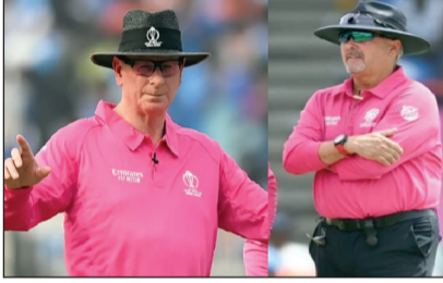
ଚାଣ୍ଡିୟରୁ ଟୁଟି ଫାଇନାଲ ମ୍ୟାଚ୍ ପାଇଁ ଅତିସାଧାରଣ ଘୋଷଣା କରାଯାଇଛି।