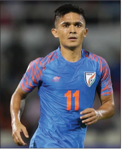
ଅବସରରୁ ଫେରିଲେ ଫୁଟବଲ ଆଇକନ ସୁନୀଲ ଛେଟ୍ରୀ।

ରୁଆବିଲ୍ଲା, ୭ମା: ତଳିତ ମାସରେ ହେବାକୁଥିବା ଗୁରୁତ୍ୱପୂର୍ଣ୍ଣ ମ୍ୟାଚ୍ରେ ଭାରତୀୟ ଦଳକୁ ସାହାଯ୍ୟ କରିବା ଲାଗି ଭାରତୀୟ ଫୁଟବଲ ଆଇକନ ସୁନୀଲ ଛେଟ୍ରୀ ଅଭିନୀତ ଅବସରରୁ ପୁରୀ ଫେରିବେ।