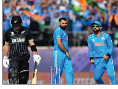
ଦୁବାଇ ଦଙ୍ଗାଲ୍: ଫାଇନାଲ ମ୍ୟାଚରେ ପଟିଶ ବର୍ଷ ତଳର ପ୍ରତିଶୋଧ ନେବ ଭାରତ।

ଦୁବାଇ, ୭ମା: ୨୫ ବର୍ଷର ପ୍ରତିଶୋଧ ନେବ ଭାରତ। ୨୫ ବର୍ଷ ତଳେ ଯେଉଁ ଦାଗ ଲାଗିଥିଲା ସେ ଦାଗ ଏଥର ଲିଭାଇବ ଭାରତ ଆଉ ୨୫ ବର୍ଷ ତଳର ସେ ଦରଜକୁ ବି ଦିଶାଉଛି।