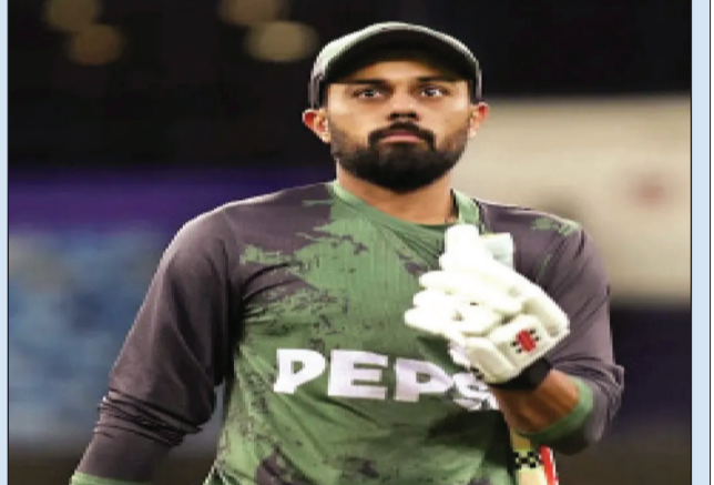
ମ୍ୟାଚ୍ ବେଳେ ଶୋଇପଡ଼ି ଟାଇମ୍ ଆଉଟ୍ ହେଲେ ସକିଲ୍।

ରାଘବପତି, ୭ମା: ପାକିସ୍ତାନର ପ୍ରଥମଶ୍ରେଣୀ କ୍ରିକେଟ୍ ପ୍ରତିଯୋଗିତା 'ପ୍ରେସିଡେଣ୍ଟସ କପ୍' ଅବସରରେ ଏକ ଅକ୍ଷୟ ଘଟଣା ଘଟିଛି।