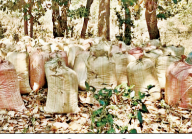
ରୁଡ଼େଶିପଙ୍କ ଗ୍ରାମ ନିକଟସ୍ଥ ଜଙ୍ଗଲରେ ଚୋରା କରାଯାଇଥିଲା। ସେଠାରୁ ୩୬୭୫୫ କେଜି ଗଞ୍ଜେଇ ପୁଲିସ ଜବତ କରିଛି। ପ୍ରାୟ ୧୦୩ କ୍ୱିଣ୍ଟାଲ ଗଞ୍ଜେଇ ଗଞ୍ଜେଇ ବିଲବାଡ଼ି ପଞ୍ଚାୟତ ନିକଟସ୍ଥ ଗ୍ରାମ ଜଙ୍ଗଲରେ ଗାତ ଖୋଳି ଗଞ୍ଜେଇ ରଖି ଚୋରା ଚାଲାଇ କରୁଥିଲେ। କନ୍ଧମାଳ ଜିଲ୍ଲାର ଗୋଛାପଡ଼ା ଥାନା ପୁଲିସ କାର୍ଯ୍ୟକ୍ରମ ଆଞ୍ଚଳିକ ଗଞ୍ଜେଇ ଜବତ ହୋଇଛି। ଏଥିସହ

ଭୁବନେଶ୍ୱର, ୧୧ ମାର୍ଚ୍ଚ (ସଂଚାର ବ୍ୟୁରୋ): କନ୍ଧମାଳ ଓ ଗଜପତି ଜିଲ୍ଲା ପୁଲିସ ଆଜି ୧୦୩ କ୍ୱିଣ୍ଟାଲ ଗଞ୍ଜେଇ ଜବତ କରିଛି। ଗଞ୍ଜେଇ ବେପାରୀମାନେ କନ୍ଧମାଳରେ ଗାତ ଖୋଳି ଗଞ୍ଜେଇ ରଖି ଚୋରା ଚାଲାଇ କରୁଥିଲେ। କନ୍ଧମାଳ ଜିଲ୍ଲାର ଗୋଛାପଡ଼ା ଥାନା ପୁଲିସ କାର୍ଯ୍ୟକ୍ରମ ଆଞ୍ଚଳିକ ଗଞ୍ଜେଇ ଜବତ ହୋଇଛି। ଏଥିସହ