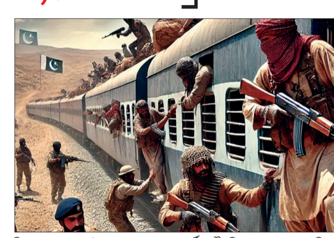
ବିଏଲଏର ଆତଙ୍କୀମାନେ ୩୦ ଜଣ ପାକ୍ତିକ ଆତଙ୍କୀଙ୍କୁ ହତ୍ୟା କରିଥିବା ଦାବି କରିଥିଲେ। ଏଥିସହ ଆହୁରି ଆକାଶମାର୍ଗରୁ ଯାତ୍ରୀମାନଙ୍କୁ ଉଦ୍ଧାର କରିବା ସକାଶେ ଉତ୍ତମ ହୋଇଥିବା ଆର୍ମି ବିଏଲଏର ସଦସ୍ୟମାନେ ଗୋଟିଏ ଟ୍ରେନ୍‌କୁ ବି ନଷ୍ଟ କରିଦେଇଛନ୍ତି। ଅଧିକତମ ଅପହରଣ ପରେ ବିଏଲଏ ଏକ ବୟାନ କରିଥିଲା ଯେ ଏଥିରେ ଆରମ୍ଭ କରାଯିବା ପରେ ପାଖାପାଖି ୩ ଶହ ଯାତ୍ରୀଙ୍କୁ ଉଦ୍ଧାର କରାଯାଇଥିବା ଦାବି କରାଯାଇଛି। କିନ୍ତୁ ଏହା ପୂର୍ବରୁ

ନିକଲ୍ ବାୟା କଲା ବଲ୍ଲୁର ଲିବରେସନ୍ ଆର୍ମି ଉତ୍ତର ଉତ୍ତମ ହେଲେ ସବୁ ପଶବନ୍ଦୀଙ୍କୁ ହତ୍ୟା କରିବାକୁ ଧମକ ୩୦ ଯବାନଙ୍କୁ ହତ୍ୟା ସହ ଟ୍ରେନ୍ ନଷ୍ଟ କଲା ବିଏଲଏ