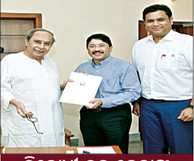
ବିରୋଧୀ ଦଳ ନେତାଙ୍କୁ ଭେଟିଲେ ଷ୍ଟାଲିନଙ୍କ ପ୍ରତିନିଧି