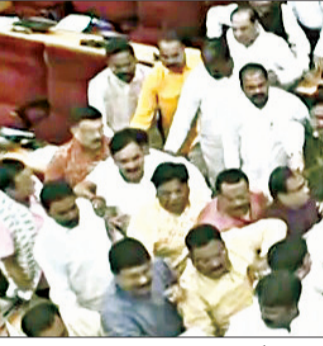
କଂଗ୍ରେସ ରାଜ୍ୟରେ ନାରୀ ନିର୍ଯ୍ୟାତନା ବହୁଥିବା ଅଭିଯୋଗ କରି କଂଗ୍ରେସ ହତବଳ କରିଆସିଥିଲା। ଗତକାଲି ପରି ଆଜି ମଧ୍ୟ ପ୍ରଶ୍ନକାଳ ଆରମ୍ଭ ହେବା ପୂର୍ବରୁ କଂଗ୍ରେସ ବିଧାୟକମାନେ ସ୍ପୋଗାନ ଦେଉଥିବା ବେଳେ ବିଜେଡି ବିଧାୟକମାନେ ମୁହଁରେ କଳାପତ୍ରି ବାନ୍ଧି କନ୍ୟାବାହୁଡ଼ି କରିବାକୁ ମନ୍ତ୍ରଣା ଉପରେ ମୁଖ୍ୟମନ୍ତ୍ରୀଙ୍କ ସ୍ୱାକ୍ଷରକରଣ ଦାବି କରିବା ସହ ଗୃହ ସଂପୃକ୍ତ-୬

ଭୁବନେଶ୍ୱର, ୧୧ ମାର୍ଚ୍ଚ (ସଂଚାର ବ୍ୟୁରୋ): ଓଡ଼ିଶା ବିଧାନସଭା ଇତିହାସରେ ଯୋଡ଼ିହେଲା କଳଙ୍କିତ ଅଧ୍ୟାୟ। ଗୃହ ମଧ୍ୟଭାଗରେ ହାତୀହାତି ହେଲେ ଶାସକ ଓ ବିରୋଧୀ ବିଧାୟକ। ପରିସ୍ଥିତି ଏମିତି ହୋଇଥିଲା ଯେ ବିରୋଧୀ ବିଧାୟକମାନେ ଗୃହ ଓ ନଗର ଉନ୍ନୟନ ମନ୍ତ୍ରୀଙ୍କ ମାଲକ ଛତାଭାଙ୍ଗି ଉନ୍ନୟନ କରିଥିଲେ। ଆଉ ଏହାର ପ୍ରତିବନ୍ଧକ କରି ମାଟିଆସିଥିଲେ ବିଜେପି ବିଧାୟକ।