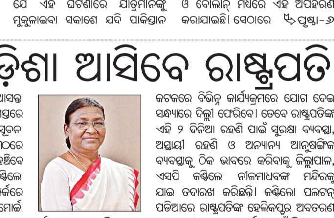
କଟକରେ ବିଭିନ୍ନ କାର୍ଯ୍ୟକ୍ରମରେ ଯୋଗ ଦେଇ ସମ୍ବଲରେ ଦିଲ୍ଲୀ ଫେରିବେ। ତେବେ ରାଷ୍ଟ୍ରପତିଙ୍କ ଏହି ୨ ଦିନିଆ ଗସ୍ତ ପାଇଁ ସୁରକ୍ଷା ବ୍ୟବସ୍ଥା, ଅସୁବିଧା ରକ୍ଷଣ ଓ ଅନ୍ୟାନ୍ୟ ଆନୁଷ୍ଠାନିକ ବ୍ୟବସ୍ଥା ଠିକ ଭାବରେ କରିବାକୁ ଜିଲ୍ଲାପାଳ, ଏସପି କଞ୍ଚିଲେ ନୀଳମାଧବଙ୍କ ମନ୍ଦିରକୁ ଯାଇ ତଦାରଖ କରିଛନ୍ତି। କଞ୍ଚିଲେ ପଲଟନ୍ ପତିଆରେ ରାଷ୍ଟ୍ରପତିଙ୍କ ହେଲିକପ୍ଟର ଅବତରଣ କରିବ। ଏହାପରେ ସେ ନୀଳମାଧବଙ୍କ ଦର୍ଶନ ପାଇଁ ଯିବେ। ୨୫ ତାରିଖରେ ରେଭେନ୍ସା ମହାବିଦ୍ୟାଳୟ ଚାଷାଳ ସମାରୋହରେ ମୁଖ୍ୟ ଅତିଥି ଭାବରେ ଯୋଗ ଦେବେ। ଏହାପରେ