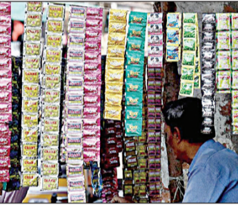
ଏବଂ ତମାଖୁର ପ୍ରଚାର ଉପରେ ନିଷେଧ କରିବାକୁ ସୁପାରିଶ କରିଥିଲା। ଆଇସିସି ମ୍ୟାଚ୍ ସମୟରେ ଝାଡ଼ିୟମ ବିତରଣ ଏବଂ ବାହାରେ ପ୍ରସାରଣ ପୁରସ୍କାରରେ ସମୟ ପ୍ରକାରେ ତମାଖୁ ଏବଂ ମଦ୍ୟପାନ ବିଜ୍ଞାପନକୁ ନିଷିଦ୍ଧ ରହିବ। ଝାଡ଼ିୟମ ଏବଂ ଆଇସିସି ମ୍ୟାଚ୍ ଖେଳାଯାଉଥିବା ଝାଡ଼ିୟମ ନିକଟରେ ଏବଂ ମଦ୍ୟପାନ ବିକ୍ରୟ ନିଷେଧ। ସୁବିଚିତ୍ କି ପାଇଁ ଆଦର୍ଶ ହୋଇ, କ୍ରୀଡ଼ା ଜଗତ ସହିତ ଜଡ଼ିତ ଲୋକମାନେ କୌଣସି ପ୍ରକାର ମଦ

ନୂଆଦିଲ୍ଲୀ, ୧୧ମାର୍ଚ୍ଚ: ଇଣ୍ଡିଆର ପ୍ରିମିୟର ଲିଗର ୧୮ତମ ସଂସ୍କରଣ ମାର୍ଚ୍ଚ ୨୨ରୁ ଆରମ୍ଭ ହେବ। ଏଥିପାଇଁ ସମସ୍ତ ଦଳ ନିଜ ନିଜ ସ୍ତରରେ ପ୍ରସ୍ତୁତ ଆରମ୍ଭ କରିସାରିଛନ୍ତି। ହେଲେ ଏବେ ସ୍ୱାସ୍ଥ୍ୟସେବା ମହାନିର୍ଦ୍ଦେଶାଳୟ ଆଇସିସି ସମୟରେ ସରୋଗେଟ୍ ବିଜ୍ଞାପନ ଏବଂ ତମାଖୁ ମଦ ବିଜ୍ଞାପନ ନିଷେଧ କରିବାକୁ ଆଇସିସି ଅଧ୍ୟକ୍ଷଙ୍କୁ ଏକ ଚିଠି ଲେଖିଛନ୍ତି। ଚିଠିରେ ଲେଖାଯାଇଛି ଯେ, ବର୍ତ୍ତମାନ ଭାରତରେ ମଧୁସୂକ୍ଷ୍ମ, ପୁସ୍ତକ୍ଷେତ୍ର, ଗୋଟା, କର୍ମ ଲାଗି ଗମ୍ଭୀର ରୋଗ ଦ୍ରୁତ ଗତିରେ ବୃଦ୍ଧି ପାଉଛି। ଏହି ରୋଗଗୁଡ଼ିକର ବୃଦ୍ଧିର ମୁଖ୍ୟ କାରଣ ହେଉଛି ତମାଖୁ ଏବଂ ମଦ୍ୟପାନ। ତମାଖୁ ଯୋଗୁଁ ସର୍ବାଧିକ ମୃତ୍ୟୁବ୍ୟୟ ହୁଏ। ଭାରତ ଦ୍ୱିତୀୟ ସ୍ଥାନରେ ଅଛି। ପ୍ରତିବର୍ଷ ଭାରତରେ ୧୪ ଲକ୍ଷ ଲୋକ ମଦ୍ୟପାନ ଯୋଗୁଁ ମୃତ୍ୟୁବରଣ କରନ୍ତି। ପୂର୍ବରୁ, ସ୍ୱାସ୍ଥ୍ୟ ମନ୍ତ୍ରାଳୟ ମଧ୍ୟ ବୃଦ୍ଧିମୋକ୍ଷ ସମୟରେ ମଦ୍ୟପାନ