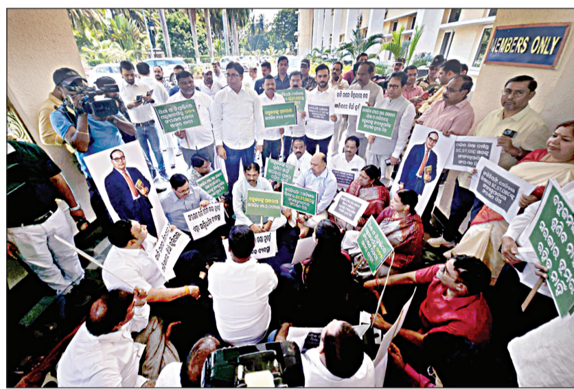
ଭୁବନେଶ୍ୱର, ୨୫ମାର୍ଚ୍ଚ (ସଂଚାର ବ୍ୟୁରୋ): ପୂର୍ବରୁ ଶେଷ ହେବା ପରେ ଗୃହକୁ ଫେରିଥିଲେ। କିନ୍ତୁ ଆଜି ବିଶୁଦ୍ଧତା ଆନ୍ଦୋଳନ ପାଇଁ କଂଗ୍ରେସର ଜଣେ ବିଧାୟକ ୧୨ ଦିନ ପାଇଁ ନିଲମ୍ବିତ ହୋଇଥିଲେ। କିଛିଦିନ ତଳେ ସେ ନିଲମ୍ବିତ ଆବେଦନ ଅବଧି