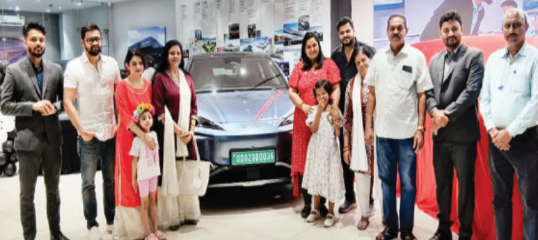
ଡିଜି କ୍ୟାମେରା, ଏକାଧିକ ଏୟାରବ୍ୟାଗ୍ ଯାହା ଉଭୟ ଗାଡ଼ିରେ ଦସିଥିବା ଲୋକ ଓ ପଥଚାରୀଙ୍କ ସୁରକ୍ଷା ନିଶ୍ଚିତ କରୁଛି। ବିଘ୍ନାକର୍ତ୍ତୀ ସିଲାଇନ୍ ୭ ଏସୟୁଇର ପ୍ରାରମ୍ଭିକ ମୂଲ୍ୟ ୪୮.୯୦ ଲକ୍ଷ ଟଙ୍କା ରହିଛି। ଏହା ୬୯୦ ଏନ୍‌ଏମ୍ ଟର୍କ୍ ଓ ୫୨୩

ଏଥିରେ ରହିଛି ଉନ୍ନତ ରେକ୍ଡ୍ ପ୍ରସ୍ତୁତି, ଯାହା ଦ୍ୱାରା ଗାଡ଼ିକୁ ଅଧିକ ଦୂର ଯିବାକୁ ଚାହା ୫୦୦ କିମିରୁ ଅଧିକ ଯାତ୍ରା କରିପାରେ। ଗାଡ଼ିରେ ପରିବେଶ ଅନୁକୂଳ ଉପକରଣ ବ୍ୟବହାର କରାଯାଇଛି। ଏହାର ଡିଜାଇନ୍ ୪.୦ ଲନଫୋଟୋନେସ୍ ବ୍ୟବସ୍ଥା ଅନେକ ସୁବିଧା ପ୍ରଦାନ କରୁଛି। ସୁରକ୍ଷା ଦୃଷ୍ଟିରୁ ସିଲାଇନ୍ ୭ରେ ରହିଛି ସ୍ୱୟଂକ୍ରିୟ ଗାଡ଼ିଚାଳନା ସହାୟତା, ୩୬୦