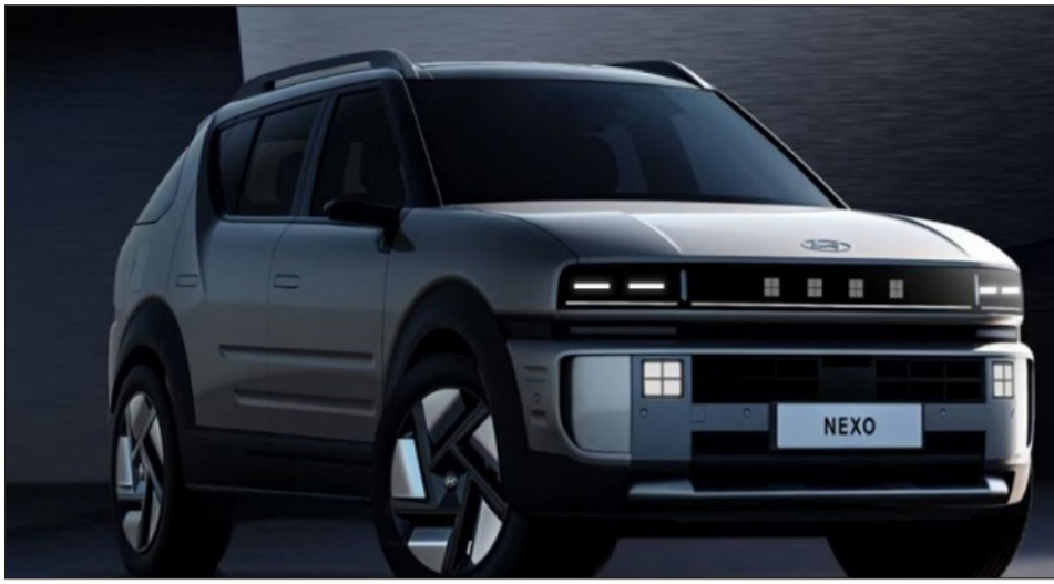
ଏକ ମର୍ଡନ ଡିଜିଟାଲ୍ ଏକ୍ସପେରିଏନ୍ସ ପ୍ରଦାନ କରିବା ପାଇଁ ହୁଣ୍ଡାଇ ନେକ୍ସୋ ଉଚ୍ଚର ପାର୍ଟି ଡିଜାଇନ୍ କରିଛି। ସିଏ;ରେ ୧୨.୩ ଲକ୍ଷର ଟର୍ଟୋରୋ ଲନଫୋଟୋନେସ୍ ସିଏସ୍ ସାମିଲ୍ ଅଛି। ଯାହା ମିଳିତ ଭାବରେ ଗାଡ଼ି ଚାଳନକୁ

ନୂଆଦିଲ୍ଲୀ, ୫୪: ହୁଣ୍ଡାଇ କୋରିଆରେ ସିଓଲ୍ ମୋଟରସ୍ ଯୋଗେ ନିଜର ଅପକମିଙ୍ଗ ହାଇଡ୍ରୋଜେନ୍ ଏସୟୁଇ 'ନେକ୍ସୋ ଏଫସିଇଭି'କୁ ଉପସ୍ଥାପନ କରିଛି। ଏହା ଏକ ପ୍ୟୁଏଲ୍ ଇଲେକ୍ଟ୍ରିକ୍ ଗାଡ଼ି। ଯାହା ୭୦୦ କିଲୋମିଟରରୁ ଅଧିକ ରେଞ୍ଜ ଦେବାରେ ଦାବି କରେ। ଖାସ୍ କଥା ହେଉଛି ଯେ ହାଇଡ୍ରୋଜେନ୍ ପ୍ୟୁଏଲ୍ ପାଇଁ ମାତ୍ର ୫ ମିନିଟ୍ ସମୟ ଲାଗେ। ଏହି ଏସୟୁଇ କେବଳ ଟେକ୍ନୋଲୋଜିକାଲ୍ ଟୁଷ୍ଟିଓ ଆଡଭାନ୍ସ ନୁହେଁ ବରଂ ଏହା ଏହାର ଡିଜାଇନ୍ ଏବଂ ପାରମ୍ପାଗିକ୍ କ୍ଷେତ୍ରରେ ପ୍ରିମିୟମ୍ ଏକ୍ସପେରିଏନ୍ସ ମଧ୍ୟ ପ୍ରଦାନ କରେ। ହୁଣ୍ଡାଇ ର 'Art of Steel' ଡିଜାଇନ୍ ଫିଲୋସଫି ଦ୍ୱାରା ଡିଆରି କରାଯାଇଥିବା ଏହି ଗାଡ଼ି ଏକ ପ୍ରିମିୟମ୍ ବକ୍ସ ଲୁକ୍ ସହିତ ଉପସ୍ଥାପନ ହୋଇଛି। ହୁଣ୍ଡାଇ ନେକ୍ସୋ ଡିଜାଇନ୍ ଗ୍ରାହକ ପ୍ରିମିୟମ୍ ଇଭି ଆୟୋଜନିକ୍ & ସହିତ ପ୍ରାୟ ସମାନ। ଏହାର ପ୍ରାୟ ୩୫ ଏଟିଏମ୍ ଏବଂ ଏକ ଉଚ୍ଚ-ପ୍ରଦର୍ଶନୀୟ ସେଟ୍‌ଅପ୍ ଦ୍ୱାରା ଗଠିତ ପଏଣ୍ଟରେ ଡିଜାଇନ୍ କରାଯାଇଛି। ଯାହା କାରର ସ୍ଥିରତା ହୁଣ୍ଡାଇ ମଧ୍ୟ ଦେଖାଯାଏ। ଏହି ଗାଡ଼ିଟି ଲୁକ୍ ଫେଣ୍ଡର ଫ୍ରେମ୍, ଯୋଗ୍ୟ ଡିଜାଇନ୍ ଏବଂ ସି-ପିଲର ସହିତ ଏକ ଦମତାଡ଼ ଏସୟୁଇ ସାଇଡ୍ ପ୍ରୋଫାଇଲ୍ ପାଇଛି।