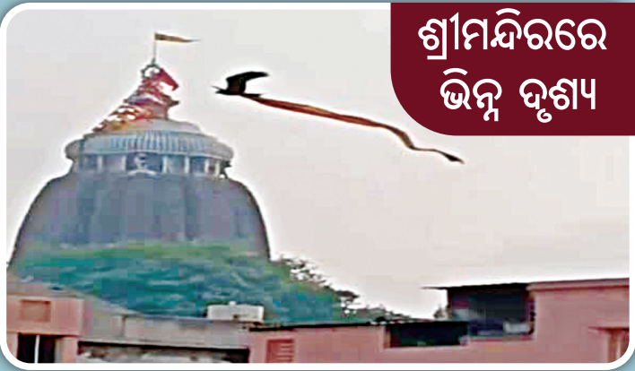
ଶ୍ରୀମନ୍ଦିରରେ ଭିନ୍ନ ଦୃଶ୍ୟ