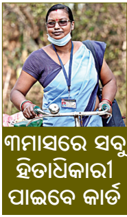
ମାସରେ ସବୁ ହିତାଧିକାରୀ ପାଇବେ କାର୍ଡ

ଭୁବନେଶ୍ୱର, ୧୩୪ (ସଂଚାର ବ୍ୟୁରୋ): ଗତ ୧୧ ତାରିଖରେ ରାଜ୍ୟରେ ଆୟୁଷ୍ମାନ ଯୋଜନା ଆରମ୍ଭ ହୋଇଥିବା ବେଳେ ଆଶା ଦିଦିଙ୍କୁ କାର୍ଡ ବାଣ୍ଟିବାର ଦାୟିତ୍ୱ ଦିଆଯାଇଛି। ସ୍ୱାସ୍ଥ୍ୟ ଓ ପରିବାର କଲ୍ୟାଣ ବିଭାଗ ତରଫରୁ ଜନସେବା କେନ୍ଦ୍ର ଓ ୪୮ ହଜାର ଆଶାକର୍ମୀଙ୍କୁ ଏହି ଦାୟିତ୍ୱ ଦିଆଯାଇଛି। ପ୍ରତି ବ୍ୟକ୍ତି ପିଛା କାର୍ଡ ଆଧାରରେ ଆଶାକର୍ମୀମାନେ ଘରକୁ ଘର ଯାଇ ଇ-କେଣ୍ଟ୍ରାଲିସ ମାଧ୍ୟମରେ କାର୍ଡ ବଣ୍ଟନ କରିବେ। ସମସ୍ତେ ନୂଆ ସ୍ୱାସ୍ଥ୍ୟ କାର୍ଡ ପାଇବା ପୂର୍ବରୁ ଯଦି କେହି ଜରୁରୀ ଚିକିତ୍ସା ସେବା ଆବଶ୍ୟକ କରନ୍ତି, ତା'ହେଲେ ସେମାନେ ନିଜ ଆଧାର କାର୍ଡ ମାଧ୍ୟମରେ ନିର୍ଦ୍ଦିଷ୍ଟବେଳେ ଚିକିତ୍ସା ଥିବୁଷ୍ଟି-୬