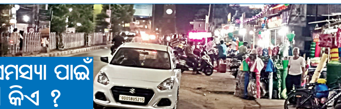
ଗ୍ରାମିକ ସମସ୍ୟା ପାଇଁ ଦାୟୀ କିଏ ?

କଟକ, ୧୩୪ (ସଂଚାର ବ୍ୟୁରୋ): ଜନଗହଳପୂର୍ଣ୍ଣ କଟକ ସହରର କଲେଜ ଛକ-କୁନ୍ତସିଂହପାଟଣା ଅଞ୍ଚଳରେ ଥିବା ହୋଟେଲ ଓ ପାଖାପାଖି ଦେ। କ। ନ ଗୁଡ଼ିକ ଦିନକୁ ଦିନ ବ୍ୟବସାୟ ନିମନ୍ତେ ରାସ୍ତା ଉପରେ ଚେରୁଳ, ବେଞ୍ଚ ରଖି ଅତ୍ୟାଧୁନିକ ଜଙ୍ଗଲରେ ବ୍ୟବସାୟ କରୁଥିବା ଦେଖାଯାଉଛି। ଏହି ଦୋକାନ