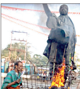
ଛକ ନାମକରଣକୁ ନେଇ ରହିଥିଲା ବିବାଦ ମାନସିକ ବିକାରଗ୍ରସ୍ତ ଗିରଫ

ବଲାଙ୍ଗୀର, ୧୫୪ (ସଂଚାର ବ୍ୟୁରୋ): ବଲାଙ୍ଗୀରର ପାଟଣାଗଡ଼ ବ୍ରହ୍ମପୁରା ବ୍ଲକ୍ ଜଳରେ ଥିବା ବିଜୁବାବୁଙ୍କ ପ୍ରତିମୂର୍ତ୍ତିରେ ନିଆଁ ଲଗାଇଦେଇଛନ୍ତି କେତେକ ଦୁର୍ଦ୍ଦଶା ବିଜୁବାବୁଙ୍କ ପ୍ରତିମୂର୍ତ୍ତି ଆଜି ସକାଳେ ଜଳୁଥିବାର ସ୍ଥାନୀୟ ଲୋକେ ଦେଖିବାକୁ ପାଇଥିଲେ। ତୁରନ୍ତ ପୁଲିସ୍ ସ୍ଥାନୀୟ ଲୋକଙ୍କ ସହଯୋଗରେ ନିଆଁକୁ ଲିଭାଇଥିଲା। ଏହି ଘଟଣା ପରେ ଥାନାରେ ଏକ ମାମଲା ରୁଜୁ ହୋଇଥିଲା। ସିସିଡିଏ ଫୁଟେଜ୍ ଆଧାରରେ ପୁଲିସ୍ ଘଟଣାର ତଦନ୍ତ ଆରମ୍ଭ କରିଥିଲା। ଏହି ଘଟଣାରେ ଜଣେ ମାନସିକ ଅଗ୍ରସର ବ୍ୟକ୍ତିକୁ ପୁଲିସ୍ ଗିରଫ କରିଥିବା ଜଣାପଡିଛି। ତେବେ ଏହାକୁ ଧିପୁଷ୍ପ-୬