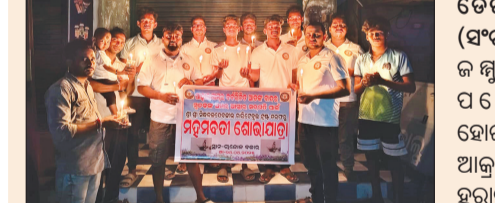
ଚେରାବିଶ, ୨୫୪ (ସଂଚାର ବ୍ୟୁରୋ): ଜିଲ୍ଲା - କାଶ୍ମୀର ଉପ ପହେଲଗାଓଁରେ ହୋଇଥିବା ଆଡ଼କ୍ଷତା ଆକ୍ରମଣରେ ପ୍ରାଣ ହରାଇଥିବା ସହିଦ ମାନଙ୍କ ପାଇଁ ଆଜି ସନ୍ଧ୍ୟାରେ ଚାନ୍ଦବାଲି ବନ୍ଦାରେ ଏକ କ୍ୟାଣ୍ଡେଲ ଶୋଭା ଯାତ୍ରା ଶ୍ରୀ ଶ୍ରୀ ସିଦ୍ଧ ବଳଦେବଜୀଉ ଚାରିଚେରୁଲ ଟ୍ରଷ୍ଟ ଡରଫଟରୁ କରାଯାଇଥିଲା । ଚେରାବିଶ ମାନେ ଯେଉଁଭଳି ଭାବେ ପର୍ଯ୍ୟଟକ ମାନଙ୍କୁ ନିର୍ମମ ଭାବେ ହତ୍ୟା କଲେ ଏହା ବହୁତ ନିନ୍ଦନୀୟ ଘଟଣା । ସାରା ଦେଶରେ ପୂରା ଶୋକାଳୁଳ ପରିସ୍ଥିତି ସୃଷ୍ଟି ହୋଇଛି ଏହି ଭଳି ଚେରାବିଶ ଆଡ଼କ୍ଷତା ଡେଖି - ବିଦେଶକୁ ନିନ୍ଦା କରାଯାଇଛି । ଏହି ଶୋଭା ଯାତ୍ରା ରେ ସହିଦ ପର୍ଯ୍ୟଟକ ମାନଙ୍କ ପାଇଁ ନାବେ ପ୍ରାର୍ଥନା ସହ ଚାନ୍ଦବାଲି ପାଠିକ ଛକରୁ ଆରମ୍ଭ କରି ବସ ଷ୍ଟାଣ୍ଡ ଯାଏ ପର୍ଯ୍ୟନ୍ତ କରି ମହମବତୀ ଜାଳି ଶୋଭାଯାତ୍ରା କରିଥିଲେ । ଏହି ଅମାନୁଷିକ କାଣ୍ଡରତାକୁ ନିନ୍ଦା କରିଥିଲେ । ଶେଷରେ ପାଳିଯାଇଥିବା ପ୍ରାଣ ମହାଙ୍ଗା ନିନ୍ଦା କରିଥିଲେ ।