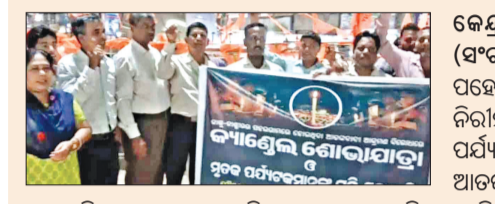
କେନ୍ଦ୍ରାପଡ଼ା, ୨୫୪ (ସଂଚାର ବ୍ୟୁରୋ): ପହେଲଗାଓଁ ଠାରେ ନିରାଶ ଭାରତୀୟ ପର୍ଯ୍ୟଟକ ମାନଙ୍କୁ ଆଡ଼କ୍ଷତା ଦ୍ୱାରା ଅମାନୁଷିକ ଭାବେ କରାଯାଇଥିବା ହତ୍ୟାର ଦୃଢ଼ ପ୍ରତିବାଦ କରି ଆମ ଗାଁ ସାହିତ୍ୟ ପରିଷଦ ପକ୍ଷରୁ କେନ୍ଦ୍ରାପଡ଼ା ସଂଘ ଶାସିତ ମହାବିଦ୍ୟାଳୟ ମୁଖ୍ୟ ଫାଟକ ଠାରୁ ଏକ ମହମବତୀ ଶୋଭାଯାତ୍ରା ଦାହାରି ତିନିମୁହାଣୀ ସ୍ଥିତ ସହିଦ ସ୍ମୃତିସ୍ତମ୍ଭ ଠାରେ ଏକ ପ୍ରତିବାଦ ସଭା କରାଯାଇଥିଲା । ବକ୍ତାମାନେ ଏକ ସ୍ୱରରେ ଦେଶ ମାତୃକାର ଉପହାସ କରାଯାଇଥିବା ଦୃଢ଼ ପ୍ରତିବାଦ କରି ଆମ ଗାଁ ସାହିତ୍ୟ ପରିଷଦ ପକ୍ଷରୁ କେନ୍ଦ୍ରାପଡ଼ା ସଂଘ ଶାସିତ ମହାବିଦ୍ୟାଳୟ ମୁଖ୍ୟ ଫାଟକ ଠାରୁ ଏକ ମହମବତୀ ଶୋଭାଯାତ୍ରା ଦାହାରି ତିନିମୁହାଣୀ ସ୍ଥିତ ସହିଦ ସ୍ମୃତିସ୍ତମ୍ଭ ଠାରେ ଏକ ପ୍ରତିବାଦ ସଭା କରାଯାଇଥିଲା । ବକ୍ତାମାନେ ଏକ ସ୍ୱରରେ ଦେଶ ମାତୃକାର ଉପହାସ କରାଯାଇଥିବା ଦୃଢ଼ ପ୍ରତିବାଦ କରି ଆମ ଗାଁ ସାହିତ୍ୟ ପରିଷଦ ପକ୍ଷରୁ କେନ୍ଦ୍ରାପଡ଼ା ସଂଘ ଶାସିତ ମହାବିଦ୍ୟାଳୟ ମୁଖ୍ୟ ଫାଟକ ଠାରୁ ଏକ ମହମବତୀ ଶୋଭାଯାତ୍ରା ଦାହାରି ତିନିମୁହାଣୀ ସ୍ଥିତ ସହିଦ ସ୍ମୃତିସ୍ତମ୍ଭ ଠାରେ ଏକ ପ୍ରତିବାଦ ସଭା କରାଯାଇଥିଲା ।