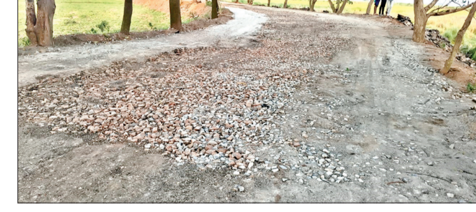
ନିର୍ମାଣ କାର୍ଯ୍ୟ ସମ୍ପର୍କରେ ଅନୁଧ୍ୟାନ ପ୍ରମୁଖ ରାସ୍ତା ସହିତ ବନ୍ୟା ପ୍ରତିରୋଧ ରାସ୍ତା ହୋଇ ଥିବାରୁ ଏହାର ନିର୍ମାଣର ଗୁରୁତ୍ୱ ରହିଛି । ଏଥିପାଇଁ ବହୁବାର ଅଞ୍ଚଳବାସୀଙ୍କ ପକ୍ଷରୁ ରାସ୍ତା ନିର୍ମାଣ ପାଇଁ ବାଧ୍ୟ ହୋଇ ଆସୁଥିଲା । ତେବେ ଏବେ ରାସ୍ତା ନିର୍ମାଣରେ କେଁ ଦେଖା ଦେଇଛି । ଅଭିଯୋଗ ଅନୁସାରେ ପ୍ରଥମେ ପୁରୁଣା ଭଙ୍ଗା ପିଚୁକୁ ବାହାର କରାଯିବ ଯେଉଁଠି ନାମମ୍ନ ମାତ୍ର କିଛି ପୁରୁଣା ପିଚୁ ରାସ୍ତା କଟରେ ଫୋପାଟା ଯାଇଥିବା ବେଳେ ଅଧିକ ପିଚୁ ଆଉ ପିଚୁ

ରାଜକନିକା, ୨୫୪ (ସଂଚାର ବ୍ୟୁରୋ): ରାଜକନିକା ବ୍ଲକ୍ ଗ୍ରାମ ଉନ୍ନୟନ ବିଭାଗ ସିନ୍ଦୂରପତା-ହାଟସାହି ରାସ୍ତା ଆରମ୍ଭ ହେଉ ଅନିୟମିତତା ପଦରେ ପଡ଼ିଲା । ରାସ୍ତାକୁ ବାହାରି ଥିବା ପୁରୁଣା ପରିତ୍ୟକ୍ତ ପିଚୁ ଓ ଗୋଡ଼ିକୁ ପୁନର୍ବାର ବ୍ୟବହାର ନେଇ ସାଧାରଣରେ ଅଭିଯୋଗ ହୋଇଛି । ଏମିତିକି ରାସ୍ତାର ସ୍ୱାଧିକୃ ନେଇ ମଧ୍ୟ ସନ୍ଦେହ ଦେଖାଦେଇଛି ।