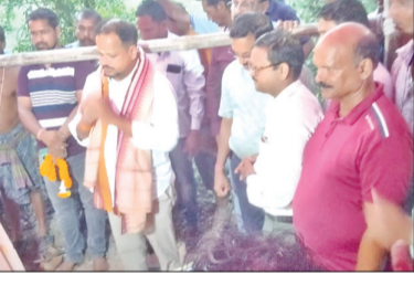
ପୁରୁଷୋତ୍ତମପୁର ବନ୍ଦାଲିଆରେ ପାଟ ନଳୀ ପୋଲର ଶିଳାନିର୍ମାଣ କାର୍ଯ୍ୟକ୍ରମରେ ଅନୁଷ୍ଠିତ ହୋଇପାରିବେ । ଏହି ଶିଳାନିର୍ମାଣ କାର୍ଯ୍ୟକ୍ରମରେ ବହୁ ସମର୍ଥକ ଉପସ୍ଥିତ ଥିଲେ ।

ମହାଙ୍ଗା, ୨୫୪ (ସଂଚାର ବ୍ୟୁରୋ): ଜଳ ନିକାସ ବିଭାଜନ କଟକ ବିଭାଗ ପକ୍ଷରୁ ମହାଙ୍ଗା ବ୍ଲକ୍ ଭଦ୍ରେଶ୍ୱର ପଞ୍ଚାୟତ ପୁରୁଷୋତ୍ତମପୁର ବନ୍ଦାଲିଆଠାରେ ପାଟ ନଳୀ ପୋଲ ନିର୍ମାଣ ଓ ପାଟଶାଳା ପୁନଃରୁଦ୍ଧ କାର୍ଯ୍ୟର ଶିଳାନିର୍ମାଣ କରାଯାଇଛି । ଏହି ପୋଲ ଓ ପାଟଶାଳା ପୁନଃରୁଦ୍ଧର ନିର୍ମାଣ କ୍ଷେତ୍ରରେ ତିନି ଗୋଟି ପଞ୍ଚାୟତ ଯଥା ଭଦ୍ରେଶ୍ୱର, ଗୋପାଳପୁର ଓ ଗୁରୁଜଙ୍ଗ ଗ୍ରାମ ପଞ୍ଚାୟତର ଶତାଧିକ ବାଷୀ ଓ ଜନସାଧାରଣ ଉପକୃତ ହୋଇପାରିବେ । ଏହି ଶିଳାନିର୍ମାଣ କାର୍ଯ୍ୟକ୍ରମରେ ବହୁ ସମର୍ଥକ ଉପସ୍ଥିତ ଥିଲେ ।