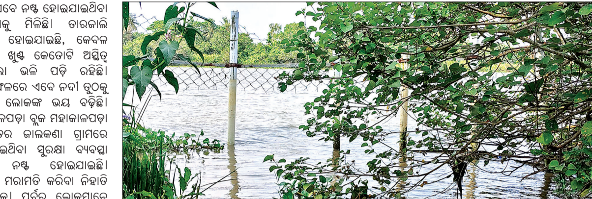
ସାରିଛନ୍ତି ଆକ୍ରମଣର ଶିକାର ନହେବ ସେକଥା କିଏ ଭିତ୍ତିଭୂମି ନିର୍ମାଣ ଓ ନଷ୍ଟ ହୋଇଯାଇଥିବା ସୁରକ୍ଷା ବାଡ଼ କୁ ମରାମତି କରାଇବା ପାଇଁ ଗ୍ରାମବାସୀ ଦାବି କରିଛନ୍ତି ।

ମହାକାଳପଡ଼ା, ୩୪ (ସଂଚାର ବ୍ୟୁରୋ): କୁମ୍ଭୀର କବଳରୁ ରକ୍ଷା ପାଇବା ତିଆରି ହୋଇଥିବା ତାର କାଳି ବାଡ଼ ଭାଙ୍ଗି ଚାଲାଣି ଖୁଣ୍ଟ ଅଛି ହେଲେ ସୁରକ୍ଷା ଦେବାକୁ ଯିବା ତାର କାଳି ନଷ୍ଟ ହୋଇ ଯାଇଛି । ଯେଉଁଥିପାଇଁ ଲୋକେ ଏବେ କୁମ୍ଭୀର ଭୟରେ ନଦୀକୁ ଯିବାକୁ ସାହାସ କରୁନାହାଁନ୍ତି । ବିପର୍ଯ୍ୟୟ ତାରତାତ ଲୋକଙ୍କ ମନରେ ଏବେ ଆଶଙ୍କା ସୃଷ୍ଟି କରିଛି । ନଦୀରେ ପାଦ ରଖିବାକୁ ଭୟ କରୁଛନ୍ତି ଲୋକେ ଦିନ ଯିଲା ସାଧାରଣ ବ୍ୟବହାର କାର୍ଯ୍ୟ ପାଇଁ ଏ ନଦୀ ଉପରେ ସମସ୍ତେ ନିର୍ଭର କରୁଥିଲେ, ହେଲେ କୁମ୍ଭୀରମାନଙ୍କ ପ୍ରାୟୁର୍ଭାବ ବଢ଼ିବା ପରେ ଲୋକ ନଦୀରେ ପାଦ ରଖିବାକୁ ଭୟ କରୁଛନ୍ତି । କୁମ୍ଭୀରକୁ ଦେଖି ଭୟଭୀତ ଅବସ୍ଥାରେ ଗ୍ରାମବାସୀ ଲୋକମାନଙ୍କ ସୁରକ୍ଷିତ ବ୍ୟବହାର ନିମନ୍ତେ ବନବିଭାଗ ତରଫରୁ ଯେଉଁ ତାରତାତର ବ୍ୟବସ୍ଥା କରାଯାଇଥିଲା ତାହା ଏବେ ନଷ୍ଟ ହୋଇଯାଇଥିବା ଦେଖିବାକୁ ମିଳିଛି । ତାରକାଳି ଭାଙ୍ଗି ହୋଇଯାଇଛି, କେବଳ ସିମେଣ୍ଟ ଖୁଣ୍ଟ କେତୋଟି ଅସ୍ଥିତ ହୋଇଲା ଭଳି ପଡ଼ି ରହିଛି । ଯାହା ଫଳରେ ଏବେ ନଦୀ ତୁଠୁକୁ ଯିବାକୁ ଲୋକଙ୍କ ଭୟ ବଢ଼ିଛି । ମହାକାଳପଡ଼ା ବ୍ଲକ୍ ମହାକାଳପଡ଼ା ପଞ୍ଚାୟତର କାଳକଣା ଗ୍ରାମରେ କରାଯାଇଥିବା ସୁରକ୍ଷା ଏବେ ନଷ୍ଟ ହୋଇଯାଇଛି । ଯାହାର ମରାମତି କରିବା ନିହାତି ଆବଶ୍ୟକ । ପୂର୍ବରୁ ଲୋକମାନେ କୁମ୍ଭୀର ଆକ୍ରମଣର ଶିକାର ହୋଇ କହିବ? ତୁରନ୍ତ ଧନ କାବଳ ସୁରକ୍ଷିତ ରଖିବା ଏବେ ମଧ୍ୟ ନଦୀରେ କୁମ୍ଭୀର ଦେଖି ଲୋକେ ଭୟଭୀତ ହେଉଛନ୍ତି । କିଏ ଯେ