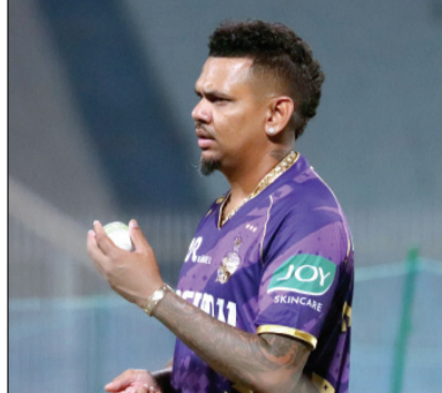
ଅଙ୍ଗକ୍ରମ ରତ୍ନପୁରୀ ୪୪ ଓ ରିଜୁ ସିଂ ୩୬ ରନ କରିଥିଲେ। ଅନ୍ୟ ମାନଙ୍କ ମଧ୍ୟରେ ସୁନୀଲ ନାରିନ

ଭୁଆଦିଲ୍ଲା, ୩୦୪: କୋଲକାତା ନାକେ ରାଜତର୍ପର ବୋଲର ସୁନୀଲ ନାରିନ ଏକ ନିଆରା ରେକର୍ଡ ନିଜ ନାମରେ କରିଛନ୍ତି। ମଙ୍ଗଳବାର ଦିଲ୍ଲୀ କ୍ୟାମ୍ପରେ ବିପକ୍ଷରେ ଡିଫେଣ୍ଡିଂ ବାମ୍ଫିୟନ କୋଲକାତା ପାଇଟର ରାଜତର୍ପର ବିଜୟୀ ହୋଇଥିଲା। ଏହି ମ୍ୟାଚରେ ୩ ଓ୍ୱେକେଟ୍ ନେଇ ପ୍ଲେୟର ଅଫ୍ ଦ ମ୍ୟାଚ ବିବେଚିତ ହୋଇଥିବା ସୁନୀଲ ନାରିନ ଏକ ନିଆରା ରେକର୍ଡ ନିଜ ନାମରେ କରିଛନ୍ତି। ସୁନୀଲ ଏକ ଏକିଟ କ୍ଲବରେ ସାମିଲ ହୋଇଛନ୍ତି। ଗୋଟିଏ ଦଳ ପକ୍ଷରୁ ବିଶ୍ୱରେ ସର୍ବାଧିକ ଓ୍ୱେକେଟ୍ ନେଇଥିବା ବୋଲରଙ୍କ ମଧ୍ୟରେ ଏକ ନମ୍ବର ପ୍ଲାନରେ ପହଞ୍ଚିଛନ୍ତି।