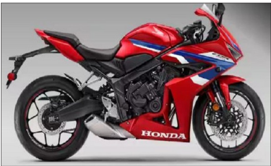
କୁଚ୍ ଆବଶ୍ୟକତାକୁ ଦୂର କରି ଗିଅର୍ ଶିଫ୍ଟିଂକୁ ଆରାମଦାୟକ କରିଥାଏ ଏବଂ ସ୍ପୋର୍ଟ ରାଇଡିଂକୁ ଅତ୍ୟନ୍ତ ସହଜ କରିଥାଏ। ଏହି ସହ ସହଜ ଟ୍ରାପିଡ୍ରେ ଗୁଡ୍ କଣ୍ଟ୍ରୋଲ୍ ଏବଂ ପରଫର୍ମାନ୍ସ ପ୍ରଦାନ କରିଥାଏ।

ନୂଆଦିଲ୍ଲୀ, ୧୨୫: ହୋଷ୍ଟା ମୋଟରସାଇକେଲ୍ ଏବଂ ସ୍କୁଟର ଇଣ୍ଡିଆ ଭାରତରେ ଏହାର ମୋଟୋ-ଆପ୍ରେଡ୍ ୨୦୨୫ ସିରିଜ୍‌ରୁ ଆରମ୍ଭ କରିଛି ଏବଂ ସିରିଆଲ୍‌ରୁ ଆରମ୍ଭ କରିଛି ଲକ୍ଷ କଲମ, ଯାହା ଦେଶର ପ୍ରଥମ ମୋଟରସାଇକେଲ୍ ଏହା ସହିତ ଯାହା ଇ-କୁଚ୍ ଟେକ୍ନୋଲୋଜି ସହିତ ମଧ୍ୟ ଲେଖି।