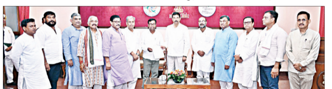
ପଞ୍ଚୁଆ ବର୍ଗଙ୍କ ଅଧିକାର ଓ ଉପଲବ୍ଧିକୁ ନେଇ ବୈଠକ ନ୍ୟାୟୀ ଦାବି ନେଇ ରାଜ୍ୟପାଳଙ୍କୁ କଂଗ୍ରେସର ସ୍ଥାନକପତ୍ର

ରାଜ୍ୟର ପ୍ରମୁଖ ମେଡିକାଲ କଲେଜ ଓ ହସ୍ପିଟାଲ ମଧ୍ୟରେ ଶ୍ରୀରାମଚନ୍ଦ୍ର ଭଞ୍ଜ ମେଡିକାଲ କେଲେଜ ଓ ହସ୍ପିଟାଲ (ଏସ୍‌ସିଏ) ଉପରେ ସର୍ବୋଚ୍ଚ ରୋଗୀ ସମସ୍ୟାର ସମାଧାନ ନ ହେଲେ ଆନ୍ଦୋଳନ ଚେତାବନୀ