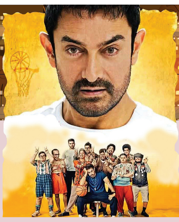
ଦର୍ଶକଙ୍କ ମଧ୍ୟରେ ଉତ୍ସାହ ରହିଛି। 'ସିତାରେ ଜମିନ୍ ପର୍' ଅମୀରଙ୍କ ୨୦୦୭ର ସୁପରହିଟ୍ ଫିଲ୍ମ 'ତାରେ ଜମିନ୍ ପର୍'ର ସ୍ତରୋତ୍ଥାପନ ସିନେକ୍ସ୍ଟ୍ରା ବୋଲି କଣାପଡ଼ିଛି।

ଅଧିକାଂଶ ସମୟରେ କାହାଣୀ ଓ ଚରିତ୍ରକୁ ନେଇ ପରୀକ୍ଷାକରିଆ କରିଥାଆନ୍ତି ଅମୀର ଖାନ୍। ସଂପୂର୍ଣ୍ଣ ନିଜର ନୂଆ ଚଳଚ୍ଚିତ୍ରରେ ୧୦ଜଣ ନବାଗତଙ୍କୁ ପରଦାକୁ ଆଣିବା ନେଇ ତାଙ୍କର ଉଦ୍ଦେଶ୍ୟ ପ୍ରକାଶ କରିଛନ୍ତି ଅମୀର। ବ୍ୟବସାୟ ଦୃଷ୍ଟିରୁ ନିର୍ଦ୍ଦେଶନାମାନେ ନିଜ ଫିଲ୍ମରେ ଖୁବ୍ କମ୍ ସୁଯୋଗ ଦେଉଥିବା ବେଳେ ଅମୀର କିଛି ସିନେଟିଭ ସହ ସଂପର୍କ ନଥିବା ୧୦ଜଣ ପ୍ରତିଭାବାନ୍ ଯୁବ କଳାକାରଙ୍କୁ ଲକ୍ଷ୍ୟ କରୁଛନ୍ତି। ଅମୀରଙ୍କ ନୂଆ ଛବି 'ସିତାରେ ଜମିନ୍ ପର୍'ର ନିଜସ୍ୱେ ଫାଷ୍ଟ ଲୁକ୍ ରିଲିଜ୍ ହେବାପରେ ଏକଥା ସାମ୍ନାକୁ ଆସିଛି। ଏହି ଫିଲ୍ମ ଘୋଷଣା ହେବା ପର ଠାରୁ