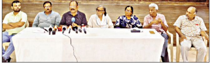
ମୁଖ୍ୟମନ୍ତ୍ରୀଙ୍କ ପ୍ରକାଶ, ସ୍ୱାସ୍ଥ୍ୟ ସଚିବ ନିର୍ଦ୍ଦେଶ ଦେଇଥିବା ଉଚ୍ଚ ଆସୋସିଏଟ ପ୍ରଫେସର ଓ ଯୁଗ୍ମଲୋକି ପ୍ରଫେସରଙ୍କ ଭୁଲ୍ ଦିକ୍ଷା ଓ ବାଧ୍ୟ କରି ଘରୋଇ ହସ୍ପିଟାଲକୁ ପଠାଇବା ଘଟଣାରେ ଲୋକ ଅସାନ୍ତତା ଦ୍ୱାରା ପାଠିତଙ୍କୁ ୭୯ ଲକ୍ଷ ୨୦ ହଜାର ଟଙ୍କାର କ୍ଷତିପୂରଣ ପ୍ରଦାନ ସମ୍ପର୍କରେ ଆଲୋଚନା ହୋଇଛି।

ଭୁବନେଶ୍ୱର, ୧୫୫(ସଂଚାର ବ୍ୟୁରୋ): ରାଜ୍ୟର ପ୍ରମୁଖ ମେଡିକାଲ କଲେଜ ଓ ହସ୍ପିଟାଲ ମଧ୍ୟରେ ଶ୍ରୀରାମଚନ୍ଦ୍ର ଭଞ୍ଜ ମେଡିକାଲ କେଲେଜ ଓ ହସ୍ପିଟାଲ (ଏସ୍‌ସିଏ) ଉପରେ ସର୍ବୋଚ୍ଚ ରୋଗୀ ସମସ୍ୟାର ସମାଧାନ ନ ହେଲେ ଆନ୍ଦୋଳନ ଚେତାବନୀ