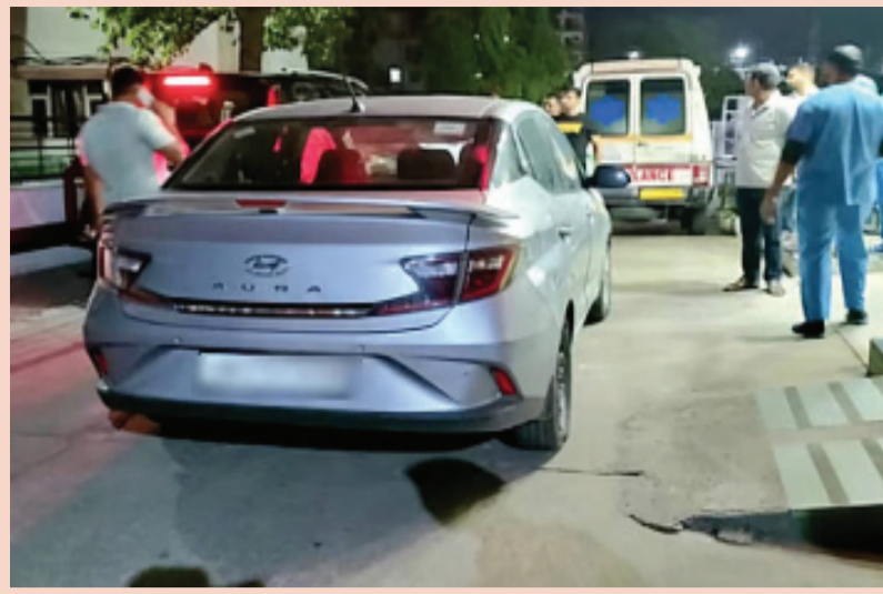
ଏବଂ ସେମାନଙ୍କର ଚିକିତ୍ସା ପାଇଁ, ଦୁଇ କିଶୋର ଝିଅ ଏବଂ ଗୋଟିଏ ପୁଅ ବ୍ୟବସାୟ କରୁଥିଲେ। କିନ୍ତୁ ବ୍ୟବସାୟରେ କ୍ଷତି ଏବଂ ରଣ କାରଣରୁ ବୋଲି ବିଚାର କରାଯାଇଛି। ପରିବାରର ଏକ ବୃଦ୍ଧ ଆଇଁଆଇଏଲ୍ ବ୍ୟବସାୟ ପ୍ରାୟ ଦଶ ବର୍ଷ ପୂର୍ବେ ପଞ୍ଚକୂଳରୁ ତେରାହୁନକୁ ସ୍ଥାନାନ୍ତରିତ ହୋଇଥିଲେ।

ବଞ୍ଚିଗଡ଼, ୨୭।୫: ହରିଆଣାର ପଞ୍ଚକୂଳରେ ଘଟିଯାଇ ଏକ ଅଭାବନାୟ ଘଟଣା। ତେରାହୁନର ଗୋଟିଏ ପରିବାରର ସାତ ଜଣ ସଦସ୍ୟ ବିଷ ପିଇ ଆତ୍ମହତ୍ୟା କରିଛନ୍ତି।