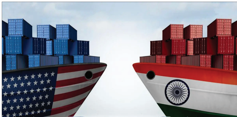
ଆକ୍ରମଣ ବୁଝାମଣା ଲାଗି ସେ ଆମେରିକା ସମ୍ପର୍କର ସହ ଆଲୋଚନା କରିଥିଲେ। ବାଣିଜ୍ୟ ଓ ଶିଳ୍ପ ମହା

ନୂଆଦିଲ୍ଲୀ, ୨୭ତା: ଭାରତ ଓ ଆମେରିକା ମଧ୍ୟରେ ବାଣିଜ୍ୟ ରାଜନୀତିକୁ ନେଇ ଚାଲିଥିବା ଆଲୋଚନାର ରତ୍ନାକ୍ର ପର୍ଯ୍ୟାୟରେ ଭାଗ ନେବା ଲାଗି ଆସକ୍ତା ସମ୍ପ୍ରଦାୟରେ ଆମେରିକାର ଏକ କ୍ଷମତା ସମ୍ପନ୍ନ ପ୍ରତିନିଧି ଦଳ ଭାରତ ଆସିବ।