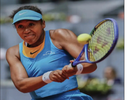
ଓସାକା ଓପନ୍ରେ ବିଜୟିନୀ ହୋଇଛନ୍ତି।

ପ୍ୟାରିସ୍, ୨୭ ମଇ: ୪ ଥର ଗ୍ରାଣ୍ଡ୍ ସ୍ଲାମ୍ ବିଜୟିନୀ ନାଓମି ଓସାକା ଏବଂ ଯୁଏସ୍ ଓପନ୍ ଉପବିଜେତା ଫ୍ରେଡ୍ ଫ୍ରେଞ୍ଚ ଓପନ୍ ଅଭିଯାନ ପ୍ରଥମ ରାଉଣ୍ଡରୁ ଶେଷ ହୋଇଛି। ମହିଳା ଏକକରେ ଜାପାନର ଓସାକା ୭-୬, ୧-୬, ୪-୬ ସେଟ୍‌ରେ ଷ୍ଟେନର ପୋଲି ବୋଦାସାଙ୍କୁ ଏବଂ ପୁରୁଷ ଏକକରେ ଅମେରିକାର ଫ୍ରେଡ୍ ୫-୭, ୬-୩, ୩-୬, ୧-୬ ସେଟ୍‌ରେ ଜର୍ମାନୀର ଡାନିଏଲ ଅଲ୍‌ମେୟରଙ୍କୁ ହାରିଯାଇଥିଲେ। ଅନ୍ୟ ଚାଳକ ପୁରୁଷ ଖେଳାଳି ବିଶ୍ୱର ୨ ନମ୍ବର କାର୍ଲୋସ୍ ଆଲ୍‌କାରାଜା, ନରଝେର କାସପର ରୁଡ୍, ଆମେରିକାର ବେନ୍ ସେଲ୍‌ଜର୍, ଗ୍ରୀସ୍ ଷ୍ଟେଫାନସ୍ ସିସିପାସ୍ ପ୍ରଥମ ରାଉଣ୍ଡ ବାଧା ଅତିକ୍ରମ କରିଛନ୍ତି। ଗତ ସଂସ୍କରଣ ବିଜେତା ଷ୍ଟେନର ଅଲ୍‌କାରାଜା ୬-୩, ୬-୪, ୬-୪