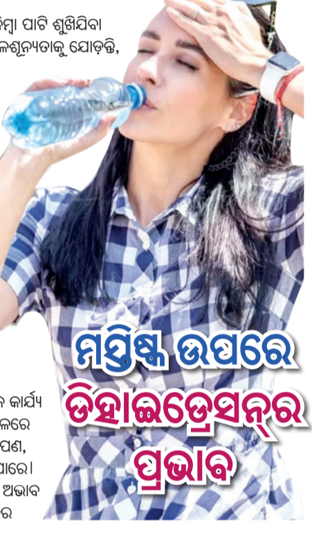
ମସ୍ତିଷ୍କ ଉପରେ ଡିହାଇଡ୍ରେସନ୍‌ର ପ୍ରଭାବ

ଅଧିକାଂଶ ଲୋକ ଶୋଷ ଲାଗିବା, ମୁଣ୍ଡ ବୁଲାଇବା କିମ୍ବା ପାଟି ଶୁଖିଯିବା ଭଳି ଶାରୀରିକ ଲକ୍ଷଣ ସହିତ ଡିହାଇଡ୍ରେସନ୍ ବା ଜଳଶୂନ୍ୟତାକୁ ଯୋଡ଼ି, କିଛି ମାନସିକ ସ୍ୱାସ୍ଥ୍ୟ ଉପରେ ଏହାର ପ୍ରଭାବକୁ ଅନିଚ୍ଛା କରାଯାଏ। ଡିହାଇଡ୍ରେସନ୍ ସିଧାସଳଖ ଧାନ, ଫୁଟି ଓ କାର୍ଯ୍ୟଦକ୍ଷତା ସମେତ ପ୍ରମୁଖ ଜୀବାଣୁକ୍ତ କ୍ଷେତ୍ରଗୁଡ଼ିକୁ ପ୍ରଭାବିତ କରେ। ଏକ ଅଧ୍ୟୟନ ଅନୁଯାୟୀ, ଶରୀରର ଜଳ ପରିମାଣ ୧-୨% ହ୍ରାସ ପାଇଲେ ବି ଜୀବାଣୁକ୍ତ କାର୍ଯ୍ୟଦକ୍ଷତାରେ ଉଲ୍ଲେଖନୀୟ ହ୍ରାସ ଘଟିପାରେ। ମନୋଭାବ, ସତର୍କତା ଓ ଜୀବାଣୁ ପ୍ରଭାବିତ କରୁଥିବା ସେଗୋଟିଏ ଓ ଗୋପାମିନ୍ ଭଳି ରାସାୟନିକ ବାର୍ଦ୍ଧିବାହକ ବା ନ୍ୟୁରୋଟ୍ରାନ୍ସମିଟ୍‌ରର ଉତ୍ପାଦନ ଏବଂ କାର୍ଯ୍ୟରେ ଜଳ ଗୁରୁତ୍ୱପୂର୍ଣ୍ଣ ଭୂମିକା ଗ୍ରହଣ କରେ। ସେହିପରି ଡିହାଇଡ୍ରେସନ୍ ହେଲେ ମସ୍ତିଷ୍କକୁ ଦୈନନ୍ଦିନ ମାନସିକ କାର୍ଯ୍ୟ କରିବା ପାଇଁ ଅଧିକ ପରିଶ୍ରମ କରିବାକୁ ପଡ଼ିଥାଏ, ଫଳରେ ମାନସିକ କ୍ଲାନ୍ତି ବୃଦ୍ଧି ପାଏ। ଏହି ଅତିରିକ୍ତ ତାପ, ଅକ୍ଷାପଣ, ଉତ୍ପାଦକତା ହ୍ରାସ ଓ ପ୍ରେରଣା ହ୍ରାସର କାରଣ ହୋଇପାରେ। ଯେତେବେଳେ ଶରୀରରେ ପର୍ଯ୍ୟାପ୍ତ ତରଳ ପଦାର୍ଥର ଅଭାବ ଥାଏ, ସେତେବେଳେ ବିକ୍ଷା, ଚିଡ଼ିଚିଡ଼ି ଏବଂ ଅବସାଦର