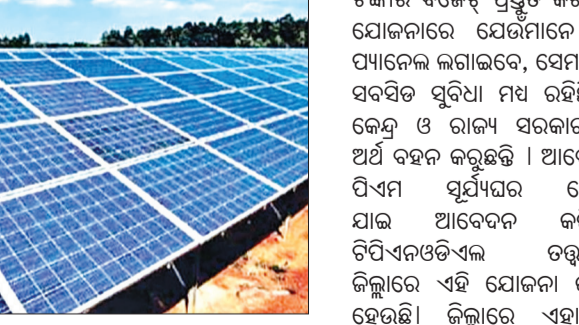
ବିଳ ତାପରୁ ଲୋକଙ୍କୁ ମୁକ୍ତ କରିବା ସହ ଅଧିକ ବିଦ୍ୟୁତ୍ ଶକ୍ତି ଉତ୍ପାଦନ କରିବା । ଏହି ଯୋଜନାରେ ଘରର ଛାତ ଉପରେ ସୋଲାର ପ୍ୟାନେଲ ସ୍ଥାପନ କରାଯାଇଛି ।

ଟଙ୍କା ବଜେଟ୍ ପ୍ରସ୍ତୁତ କରିଛନ୍ତି । ଏହି ଯୋଜନାରେ ପ୍ରତିମାନେ ସୋଲାର ପ୍ୟାନେଲ ଲଗାଇବେ, ସେମାନଙ୍କ ପାଇଁ ସର୍ବସିଡି ସୁବିଧା ମଧ୍ୟ ରହିଛି । ଉଭୟ କେନ୍ଦ୍ର ଓ ରାଜ୍ୟ ସରକାର ସର୍ବସିଡି ଅର୍ଥ ବହନ କରୁଛନ୍ତି । ଆବେଦନକାରୀ ପିଏମ୍ ସୂର୍ଯ୍ୟପର ଯୋଜନାରେ ଯୋଗ ଆବେଦନ କରିପାରିବେ । ଟିପିଏନଏଡିଏଲ ତତ୍ତ୍ୱାବଧାନରେ ଜିଲ୍ଲାରେ ଏହି ଯୋଜନା କାର୍ଯ୍ୟକାରୀ ହେଉଛି । ଜିଲ୍ଲାରେ ଏହାକୁ ନେଇ ବିଦ୍ୟୁତ୍ ଗ୍ରାହକଙ୍କୁ ଯୋଗଦେଇ ସଚେତନ କରାଯିବା କଥା ଚାହା ହେଉଛି । ଫଳରେ ସୂର୍ଯ୍ୟପର ଯୋଜନା ସମ୍ପୂର୍ଣ୍ଣ ଆଜି ମଧ୍ୟ ଅଧାରରେ ରହିଯାଇଛି ।