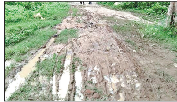
ତେରାବିଶ, ୨୧.୧୬ (ସଂଚାର ବ୍ୟୁରୋ): ତେରାବିଶ ବ୍ଲକ୍ ବେଶିପୁର ପଂଚାୟତ ଅନ୍ତର୍ଗତ ରାଏଭୁଷ୍ଟି ଗ୍ରାମ ଦଳିତ ସାହି ରାସ୍ତା ଶୋଚନୀୟ ହୋଇପଡ଼ିଛି। ଅସରାଏ ବର୍ଷା ହେଲେ ଏହି ସାହିର ଲୋକେ ଘରୁ ବାହାରକୁ