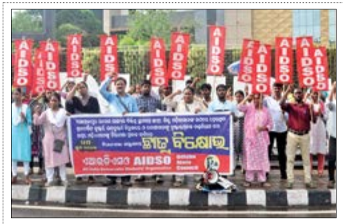
ଗୋପାଳପୁର ସମେତ ରାଜ୍ୟର ବିଭିନ୍ନ ସ୍ଥାନରେ ମହିଳା ଓ ଶିଶୁଙ୍କ ଉପରେ ବହୁଥିବା ନିର୍ଦାସିତା ପ୍ରତିରୋଧରେ ମଙ୍ଗଳବାର ମାଷ୍ଟର କ୍ୟାଣ୍ଡିଡ଼ାରେ ଏଆଇଭିଏସ୍ ପ୍ରଚାର କରାଯାଇଛି ।

ଭୁବନେଶ୍ୱର, ୨୫ତମ (ସଂଚାର ବ୍ୟବସ୍ଥା): ବିକାଶ କାର୍ଯ୍ୟ ଠପ୍: ଧାରଣାରେ ବସିଲେ ଜିଲ୍ଲା ପରିଷଦ ସଦସ୍ୟ । ଏହି ଯତ୍ନରେ ରେଳପଥର ବିକାଶ ଓ ଉନ୍ନତି ପାଇଁ ଯତ୍ନ ରଖାଯାଇଛି । ଏହି ଯତ୍ନରେ ରେଳପଥର ବିକାଶ ଓ ଉନ୍ନତି ପାଇଁ ଯତ୍ନ ରଖାଯାଇଛି ।