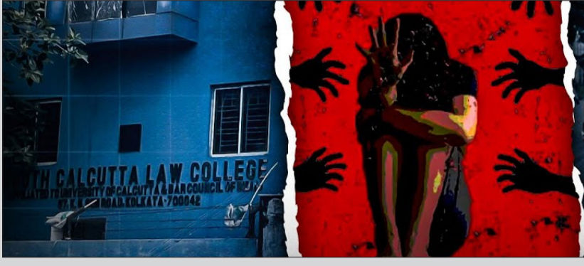
ଆମେ ପୁରୁଷା କର୍ମୀଙ୍କୁ ଗିରଫ କରିଛୁ, କାରଣ ଉପସ୍ଥିତ ସିପିଏଲି ଫୁଟେକ ରୁ ଜଣାପଡ଼ିଥିଲା। ତାଙ୍କର ଉତ୍ତର ଅସ୍ପଷ୍ଟ ଥିଲା। କଲେକ୍ଟର ତାଙ୍କର ଅଧିକାରୀ କହିଛନ୍ତି, 'ଗାର୍ଡ ତାଙ୍କ କର୍ତ୍ତବ୍ୟ ପାଳନ

କୋଲକାତା, ୨୮।୬: ଶନିବାର (ଜୁନ୍ ୨୮) ଦିନ କୋଲକାତା ପୋଲିସ ପ୍ରଥମ ବର୍ଷର ଆଇନ ଛାତ୍ରୀଙ୍କ ଗଣବଳୀକାର ମାମଲାରେ ପାଞ୍ଚ ଜଣିଆ ଏସଆଇଟି ଗଠନ କରାଯାଇଛି। ଏହି ଏସଆଇଟି-ଏସିଟି ପ୍ରତ୍ୟେକ ଜଣଙ୍କର ନେତୃତ୍ୱରେ ମାମଲାର ତଦନ୍ତ କରାଯିବ। ଏହି ମାମଲାରେ ଜଣେ ଅଧିକାରୀ ସୂଚନା ଦେଇଛନ୍ତି ଯେ ଶନିବାର (ଜୁନ୍ ୨୮) ଦିନ ହିଁ କୋଲକାତା ପୋଲିସ କଲେକ୍ଟର ଜଣେ ପୁରୁଷା କର୍ମୀଙ୍କୁ ଗିରଫ କରିଛି। ଏହା ସହିତ, କଲେକ୍ଟରଙ୍କ ସହଯୋଗୀ ଗାର୍ଡ ରୁମ୍‌ରେ ଏହି ଘଟଣା ସହିତ ଜଡ଼ିତ ଗିରଫ ବ୍ୟକ୍ତିଙ୍କ ସଂଖ୍ୟା ତାରିକ୍ତ ଦୁଇ ପାଇଛି। ଅଧିକାରୀ କହିଛନ୍ତି, 'ପଦାଧିକାରୀ ପାଇଁ ଅନେକ ରଖାଯାଇଥିବା ପୁରୁଷା କର୍ମୀଙ୍କୁ ପରେ ଗିରଫ କରାଯାଇଥିଲା।' ସେ କହିଛନ୍ତି, 'ଶନିବାର ସକାଳେ