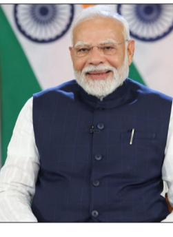
ନୂଆଦିଲ୍ଲୀ, ୨୮।୬: ପ୍ରଧାନମନ୍ତ୍ରୀ ନରେନ୍ଦ୍ର ମୋଦୀ ଆକାଶଯାନ ମହାକାଶ କେନ୍ଦ୍ର (ଆଇଏସଏସ)ରେ ଥିବା ଭାରତୀୟ ବାୟୁସେନା ଅଧିକାରୀ ଗୁପ୍ତ କ୍ୟାମେରା ଶୁଭାଂଶୁ ଶୁକ୍ଳାଙ୍କ ସହିତ ସିଧାସଳଖ କଥାବାର୍ତ୍ତା କରିଛନ୍ତି। ଏହି କଥାବାର୍ତ୍ତା କେବଳ ଭାରତର ମହାକାଶ ଭିତ୍ତିରେ ଏକ ନୂତନ ଅଧ୍ୟାୟ ନୁହେଁ, ବରଂ ଏହା ଭାରତର ବୈଜ୍ଞାନିକ କ୍ଷମତା ତଥା ବିଶ୍ୱ ମହାକାଶ ଗବେଷଣାରେ ଭାରତର ଅଂଶଗ୍ରହଣର ଏକ ପ୍ରତୀକ ପାଲଟିଛି।

ଆଇଏସଏସ ପରିବର୍ତ୍ତନ କରିବାକୁ ଯାଉଛନ୍ତି। ସେ ତାଙ୍କ ସହିତ ୧୪୦ କୋଟି ଭାରତୀୟଙ୍କ ଇଚ୍ଛା, ଆଶା ଏବଂ ଆକାଂକ୍ଷା ନେଇ ଯାଇଛନ୍ତି। ଆକ୍ସିଅମ୍-୪ ମିସନର ଡ୍ରାଗନ୍ ମହାକାଶଯାନ ଗୁରୁବାର ଦିନ ସଫଳତାର ସହ ଚଳି ପର୍ଯ୍ୟନ୍ତ କରିଛି, ଯାହା ଦ୍ୱାରା ଏହାର କୁଳ ମହାକାଶ ସ୍ପେସନରେ ଦୂର ସପ୍ତାହ ରହିଛି। ଆନୁଷ୍ଠାନିକ ଭାବରେ ଆରମ୍ଭ ହୋଇଛି। ସେମାନଙ୍କ ରହିଛି ସମୟରେ, ମିସନ ଦଳ ଏକ ମାଲକୋଗ୍ରାଭିଟି ପରିବେଶରେ ବୈଜ୍ଞାନିକ ପରୀକ୍ଷା, ପ୍ରଯୁକ୍ତିବିଦ୍ୟା ପ୍ରଦର୍ଶନ ଏବଂ ଶିକ୍ଷା ପ୍ରଦାନ କାର୍ଯ୍ୟକଳାପ କରିବେ। ଶୁଭାଂଶୁ ଶୁକ୍ଳା ଆଇଏସଏସରେ ମିସନ ଦଳ ଦ୍ୱାରା କରାଯିବାକୁ ଥିବା ୬୦ଟି ପରୀକ୍ଷା ମଧ୍ୟରୁ ସାତଟି ପରୀକ୍ଷାରେ ନେତୃତ୍ୱ ନେବେ। ଆକ୍ସିଅମ୍-୪ ମିସନ ଦ୍ୱାରା ଏବଂ ଭାରତୀୟ ମହାକାଶ ଗବେଷଣା ସଂଗଠନ (ଇସ୍ରୋ) ମଧ୍ୟରେ ଏକ ସଫଳ ସହଯୋଗକୁ ନିଶ୍ଚିତ କରିଛି। ଏହା ଆମେରିକା ରାଷ୍ଟ୍ରପତି ଡୋନାଲ୍ଡ ଟ୍ରମ୍ପ ଏବଂ ପ୍ରଧାନମନ୍ତ୍ରୀ ନରେନ୍ଦ୍ର ମୋଦୀଙ୍କ ଦ୍ୱାରା ପ୍ରଥମ ଭାରତୀୟ ମହାକାଶଗାରୀଙ୍କୁ ମହାକାଶ ସ୍ପେସନକୁ ପଠାଇବା ପାଇଁ ଦିଆଯାଇଥିବା ପ୍ରତିଶ୍ରୁତିକୁ ପୂରଣ କରିଛି।