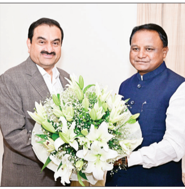
ବନ୍ଦରଭିତ୍ତିକ ଶିଳ୍ପ ବିକାଶ ନେଇ ଆଲୋଚନା

ଭୁବନେଶ୍ୱର, ୨୮।୬ (ସଂଚାର ବ୍ୟୁରୋ): ବିଶିଷ୍ଟ ଶିଳ୍ପପତି ତଥା ଆଦାନୀ ଗ୍ରୁପର ଅଧ୍ୟକ୍ଷ ଗୋତମ ଆଦାନୀ ଆଜି ରାଜ୍ୟ ଅତିଥି ଭବନ ଠାରେ ମୁଖ୍ୟମନ୍ତ୍ରୀ ମୋହନ ଚରଣ ମାଝଙ୍କ ସହିତ ସୌଜନ୍ୟମୂଳକ ସାକ୍ଷାତ କରିଛନ୍ତି। ଏହି ଅବସରରେ ଉଭୟଙ୍କ ମଧ୍ୟରେ ରାଜ୍ୟର ଶିଳ୍ପ ବିକାଶ ସମ୍ପର୍କରେ ଆଲୋଚନା ହୋଇଥିଲା। ବିଶେଷକରି ଶିଳ୍ପ ଭିତ୍ତିକ ବିକାଶ, ସବୁଜ ଶକ୍ତି ବା ଗ୍ରୀନ ଓ ରିନିଓବେଲ ଏକର୍ଡର ଉତ୍ପାଦନ ଏବଂ କୋଇଲା ଗ୍ୟାସିଫିକେସନ୍ ପ୍ରାଣ ସ୍ଥାପନ ଉପରେ ଆଲୋଚନା ହୋଇଥିଲା। ସୂଚନାଯୋଗ୍ୟ ଯେ, ଉତ୍କର୍ଷ ଓଡ଼ିଶା - ମେକ୍ ଇନ୍ ଓଡ଼ିଶା କନକ୍ସେଣ୍ଟ ପରେ ମୁଖ୍ୟମନ୍ତ୍ରୀଙ୍କ ନେତୃତ୍ୱ ରାଜ୍ୟ ସରକାର ରାଜ୍ୟରେ ଶିଳ୍ପ ବିକାଶରେ ଗତିକୁ ଦୃଢ଼ୀକୃତ କରିବା ଉପରେ ଗୁରୁତ୍ୱ ଦେଇଛନ୍ତି। ନିକଟରେ ଗୋପାଳପୁର ବନ୍ଦରର ଧ୍ୱଂସା-୬