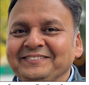
ନୂଆଦିଲ୍ଲୀ, ୨୮।୬: କେନ୍ଦ୍ର ସରକାର ୧୯୮୯ ବ୍ୟାଚ୍ ର ପଞ୍ଚାବ କ୍ୟାଡରର ଆଇପିଏସ୍ ଅଧିକାରୀ ହେଉଛନ୍ତି ପରାଗ ଜୈନ। ତାଙ୍କୁ ରିସର୍ଭ ଆକ୍ସ ଆନାଲିସିସ୍ ଫୁଲ୍ (ର) ର ନୂତନ ମୁଖ୍ୟ ଭାବରେ ନିଯୁକ୍ତ ହୋଇଛନ୍ତି। ସେ ରବି ସିଂହାଙ୍କ ସ୍ଥାନ ନେବେ।

ନୂଆଦିଲ୍ଲୀ, ୨୮।୬: କେନ୍ଦ୍ର ସରକାର ୧୯୮୯ ବ୍ୟାଚ୍ ର ପଞ୍ଚାବ କ୍ୟାଡରର ଆଇପିଏସ୍ ଅଧିକାରୀ ହେଉଛନ୍ତି ପରାଗ ଜୈନ। ତାଙ୍କୁ ରିସର୍ଭ ଆକ୍ସ ଆନାଲିସିସ୍ ଫୁଲ୍ (ର) ର ନୂତନ ମୁଖ୍ୟ ଭାବରେ ନିଯୁକ୍ତ ହୋଇଛନ୍ତି। ସେ ରବି ସିଂହାଙ୍କ ସ୍ଥାନ ନେବେ। ରବି ସିଂହାଙ୍କ ବର୍ତ୍ତମାନ କାର୍ଯ୍ୟକାଳ ଜୁନ୍ ୩୦ରେ ଶେଷ ହେଉଛି। ପରାଗ ଜୈନଙ୍କ କାର୍ଯ୍ୟକାଳ ଦୁଇ ବର୍ଷ ହେବ। ସେ ଚଳିତବର୍ଷ ଜୁଲାଇ ୧, ପର୍ଯ୍ୟନ୍ତ ଏକ ନିର୍ଦ୍ଦିଷ୍ଟ କାର୍ଯ୍ୟକାଳ ପାଇଁ ଏହି ଦାୟିତ୍ୱ ଗ୍ରହଣ କରିବେ। ପରାଗ ଜୈନ ବର୍ତ୍ତମାନ ବିମାନ ଗବେଷଣା କେନ୍ଦ୍ରରେ ନେତୃତ୍ୱ ନେଉଛନ୍ତି। ଯାହା 'ଅପରେସନ୍ ସିନ୍ଦୂର' ସମୟରେ ପାକିସ୍ତାନୀ ସଶସ୍ତ୍ର ବାହିନୀର ଆକ୍ରମଣ ଆଡ଼ାକୁ ଶିବିର ବିସ୍ତାରରେ ଗୁରୁତ୍ୱପୂର୍ଣ୍ଣ ଭୂମିକା ଗ୍ରହଣ କରିଥିଲା। ଗୁଜରାଟ ମହଲରେ 'ସୁପର ସ୍ଟାଏ' ଭାବରେ ଜଣାଶୁଣା ପରାଗ ଜୈନ ମାନବ ସ୍ୱତ୍ତ୍ୱରୁ ବୃଦ୍ଧିପ୍ରାପ୍ତ ହେବା ସହିତ ପ୍ରଭାବଶାଳୀ ଭାବରେ ପିଣ୍ଡା କରାଯାଇ ପାଇଁ ଜଣାଶୁଣା। ଏହି ବିଶେଷତା ଅନେକ ଗୁରୁତ୍ୱପୂର୍ଣ୍ଣ କାର୍ଯ୍ୟରେ ଗୁରୁତ୍ୱପୂର୍ଣ୍ଣ ରହିଛି ବୋଲି ଅଧିକାରୀମାନେ କହିଛନ୍ତି। ଯେତେବେଳେ ଆଡ଼ାକୁ ଗଠନ ପଞ୍ଚାବରେ ଆଡ଼ାକୁ ସୂଚି କରୁଥିଲେ ପରାଗ ଜୈନ ଭିତ୍ତି, ମାନସ, ହୋସିଆରପୁରରେ ଏକ ଅପରେସନାଲ୍ ଭୂମିକା ଗ୍ରହଣ କରିଥିଲେ। ଏହା ପୂର୍ବରୁ ସେ ରଞ୍ଜିତପୁର SSP ଏବଂ ଲୁଧିଆନାର ଡିଆଇଜି ଥିଲେ। ସେ ର'ରେ ପାକିସ୍ତାନ ଚେଷ୍ଟା ପରିଚାଳନା କରିଛନ୍ତି। ସେ ଧାରା ୩୭୦ ହଟାଇବା ଏବଂ ଅପରେସନ୍ ବାଲକୋଟ ସମୟରେ ଜଣ୍ଟି ଏବଂ କାଶ୍ମୀରରେ ମଧ୍ୟ କାର୍ଯ୍ୟ କରିଛନ୍ତି। ପରାଗ ଜୈନଙ୍କୁ ଜଣେ ଅତ୍ୟନ୍ତ ନମ୍ର ଅଧିକାରୀ ବୋଲି କୁହାଯାଏ। ସେ କାମାତା ଏବଂ ଶ୍ରୀଲଙ୍କାରେ ଭାରତୀୟ ପ୍ରତିନିଧି ଭାବରେ କାର୍ଯ୍ୟ କରିଛନ୍ତି। କାମାତାରେ ତାଙ୍କ ପୋଷ୍ଟ ସମୟରେ ସେ ସେଠାରେ ଖଲିସ୍ତାନ ସମର୍ଥକମାନଙ୍କୁ ବ୍ୟାଲେଜ୍ କରିଥିଲେ ଏବଂ ବାରମ୍ବାର ନୂଆଦିଲ୍ଲୀକୁ ଚେତାବନା ଦେଇଥିଲେ ଯେ ଏହା ବିପଦପୂର୍ଣ୍ଣ ହୋଇଯାଇଛି।