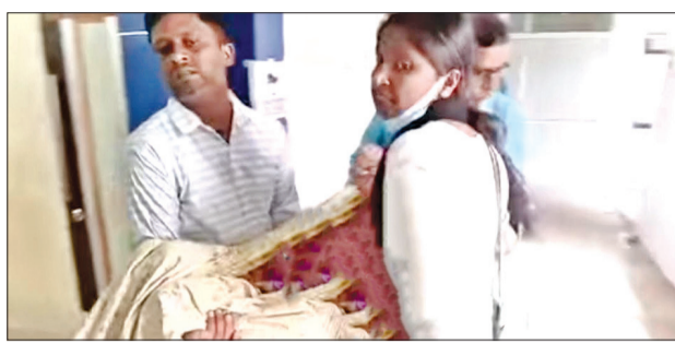
ପାଇଁ ଷ୍ଟେଟର ନଥିବା ବେଳେ ସମ୍ପର୍କୀୟ କିଛି ସମସ୍ୟାର ସମ୍ମୁଖୀନ ହେଉଛନ୍ତି ଉକ୍ତ ଭିଡିଓରୁ ଜଣାପଡିଛି।