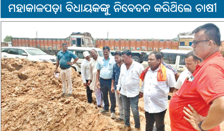
ମହାକାଳପଡ଼ା ବିଧାୟକଙ୍କୁ ନିବେଦନ କରିଥିଲେ ଦାଖ