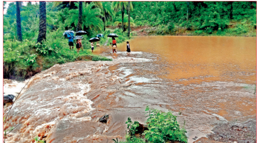
ଫିରିଙ୍ଗିଆ, ୧୧।୭(ସଂଚାର ବ୍ୟୁରୋ): ରାଜ୍ୟ ଯୋଜନା କାର୍ଯ୍ୟକାରୀ ପ୍ରସ୍ତୁତି କରନ୍ତି ସତ, ଓ କେନ୍ଦ୍ର ସରକାର ଗମନାଗମନ ପାଇଁ ଅନେକ କିଛି ପ୍ରଣାଳୀ ଗ୍ରହଣ କରୁଅଛନ୍ତି।

କରୁଥିବା ଅଭିଯୋଗ କରିଛନ୍ତି। ଏମିତି ଏକ ଦୁର୍ଗତ ଦେଖିବାକୁ ମିଳିଛି, କନ୍ଧମାଳ ଜିଲ୍ଲା ଫିରିଙ୍ଗିଆ ବ୍ଲକ୍ ଲୁଇସି ପଞ୍ଚାୟତର ୨ ଟି ଗାଁର ଲୋକ ସଂଖ୍ୟା ପ୍ରାୟତଃ ୫୦ ଘରରୁ ଅଧିକ ଲୋକଙ୍କ ପାଇଁ ବର୍ତ୍ତମାନ ଯାତାୟତରେ ବାଧକ ସାଜିଛି ବାଡ଼ିଙ୍ଗ କୂଟି ନାଳ। ପୂର୍ବରୁ ବର୍ଷା ଦିନ ଆସିଲେ ଏମାନଙ୍କ ପାଇଁ କାଠ ପୋଲ ଭରସା ହେଉଥିବାବେଳେ ପୋଲ ଭାଙ୍ଗି ଗଲେ ଏମାନଙ୍କ ପାଇଁ ଯୋଗାଯୋଗ ବିଚ୍ଛିନ୍ନ ହୋଇ ଦିନିକିଆ, ଅଙ୍ଗନୂପାତି ଶିକ୍ଷା, ସ୍ୱାସ୍ଥ୍ୟ ଏମିତି କି ପଞ୍ଚାୟତ କାର୍ଯ୍ୟକ୍ରମକୁ ରାସ୍ତା ସାମଗ୍ରୀ ଭଣ୍ଡା ହେବାକୁ ହେଉଛି ଏହି ବାଡ଼ିଙ୍ଗ କୂଟି ନାଳ ଅତିକ୍ରମ କରିବାକୁ ପଡୁଛି। ଏ ସବୁ ଯାତାୟତ ବାଧାପ୍ରାପ୍ତ ହେଉଛି ଯାହା ଫଳରେ ବହୁତ ଅସୁବିଧାର ସମ୍ମୁଖୀନ ହେଉଛନ୍ତି। ଗାଁ କୁ ଭଲ ରାସ୍ତା ନଥିବାରୁ ଆମ୍ଭମାନଙ୍କୁ ସେବାୟତ ବସ୍ତ୍ର ଅଛନ୍ତି ଫିରିଙ୍ଗିଆ ପଞ୍ଚାୟତ। ବାଡ଼ିଙ୍ଗ କୂଟି ନାଳ ପାଦୋରାପଡା ନାଳ ଯାତାୟତ ପାଇଁ ବାଧକ ସାଜିଛି ଏବଂ ନାଳ ରାଜଗୁଡା, ଝିଟିଙ୍ଗିପଡା ଲୁଇସି ପଞ୍ଚାୟତର ପାଦୋରାପଡା ଦେଇ ଯାଇଥିବା ରାସ୍ତା ମଝିରେ ପଡୁଛି। ଏହି ନାଳରେ ପ୍ରତିବର୍ଷ ଲୋକେ କାଠ ପୋଲ କରି କିମ୍ବା କାଠକୁ ଗଛ ସହ ଯୋଡ଼ି ଦିଅନ୍ତୁଥିବାବେଳେ ଯାତାୟତ କରିଥାନ୍ତି। ପ୍ରତିବର୍ଷ ବର୍ଷାରେ ପୋଲ ହୋଇଯାଏ ପୁଣି ନିକ ଖର୍ଚ୍ଚରେ କାଠ ଆଣି ପୋଲ ନିର୍ମାଣ କରି ଏମିତି କି ପ୍ରତ୍ୟେକ କାର୍ଯ୍ୟ ପାଇଁ କାଠ ପୋଲ ଉପରେ ନିର୍ଭର କରିବାକୁ ପଡୁଥାଏ। ବର୍ତ୍ତମାନ ଛିଦି ଦିନ ହେବ ବର୍ଷା ଲାଗି ରହିଥିବାରୁ ପାଦୋରାପଡା, ଝିଟିଙ୍ଗି ପଡା ନାଳରେ ପ୍ରବଳ ବର୍ଷା ପାଣି ଯାଉଥିବାରୁ ଲୋକେ ବିପଦପୂର୍ଣ୍ଣ ଭାବେ ୨ ଟି ଗାଁର ଲୋକ ଯାତାୟତ ପାଇଁ ବହୁ ଅସୁବିଧା ସମସ୍ୟା ହେଉଛନ୍ତି। କିନ୍ତୁ ଏହି ଝିଟିଙ୍ଗିପଡା ଓ ପାଦୋରାପଡା ନାଳରେ ଯାତାୟତ ସୁବିଧା ପାଇଁ ପୋଲ ନିର୍ମାଣ କରିବାକୁ ସମାଜ ସେବା ରାଜିତ ଦିଗାଳ, ସଞ୍ଜୋସ କର୍ଜ୍ଜର, ରବିନ୍ଦ୍ର ଦିଗାଳ, ନମ୍ବୁ କର୍ଜ୍ଜର, ନନ୍ଦ କର୍ଜ୍ଜର, ଗିରିଧାରୀ କର୍ଜ୍ଜର, ଲଳିତା କର୍ଜ୍ଜର, ସୁମିତ୍ରା କର୍ଜ୍ଜର, ଶିବାନୀ କର୍ଜ୍ଜର, ସାମନ୍ତ କର୍ଜ୍ଜର ଇତ୍ୟାଦି ସମସ୍ତ ଅଞ୍ଚଳବାସୀ ଦାବି କରିଛନ୍ତି।