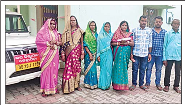
ବେଲପାଳ ସରପଞ୍ଚଙ୍କ ବିରୁଦ୍ଧରେ ଅନାୟା ପ୍ରସ୍ତାବ