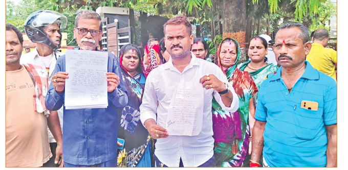
ଅବ୍ୟବସ୍ଥା ଘେରରେ ୨୦୦ ଖୁର୍ଦ୍ଧା

ତେନେକ କାମ ହୋଇନାହିଁ, ମୁଖ୍ୟ ରାସ୍ତାର ପାଟକ ଭାଙ୍ଗି ବାହାର ବର୍ଷା ଜଳକଲୋନୀର ଘର ଭିତରେ ପଶୁଛି। କିଛି ପରିବାର ଅଧା ଗଢ଼ା ହୋଇଥିବା ଘରେ ବହୁ ନୟନାୟ ଅବସ୍ଥାରେ ପରିବାର ଧରି ରହୁଛନ୍ତି। ପୁତ୍ର ଗୁଡ଼ିକ ଅତ୍ୟଧିକ ଗାଡ଼ ହୋଇଥିବାରୁ ଘର ଭିତରେ ବର୍ଷା ହେଲେ ଆଶୁ ଅ ଲେଖା ପାଣି ଜମି ରହୁଛି। ରୋଷେଇବାସ କରି ହେଉନାହିଁ। ଛୋଟ ଛୋଟ ଶିଶୁ ମାନେ ବର୍ଷା ପାଗରେ ପାଣି ଘେରରେ ରହି ଅସୁସ୍ଥ ହୋଇ ପଡ଼ୁଛନ୍ତି। କୁଡ଼ୁମି ସାହି ବାସିନ୍ଦାଙ୍କୁ ଏ ପର୍ଯ୍ୟନ୍ତ ଘର ଯୋଗାଇ ଦିଆଯାଇନାହିଁ। ପାଚେରୀକୁ ଲଗାଇ ଖଣ୍ଡେ ଖଣ୍ଡେ ଚିଣ ପକାଇ ଅଧ୍ୟାୟ ଭାବେ ବହୁ