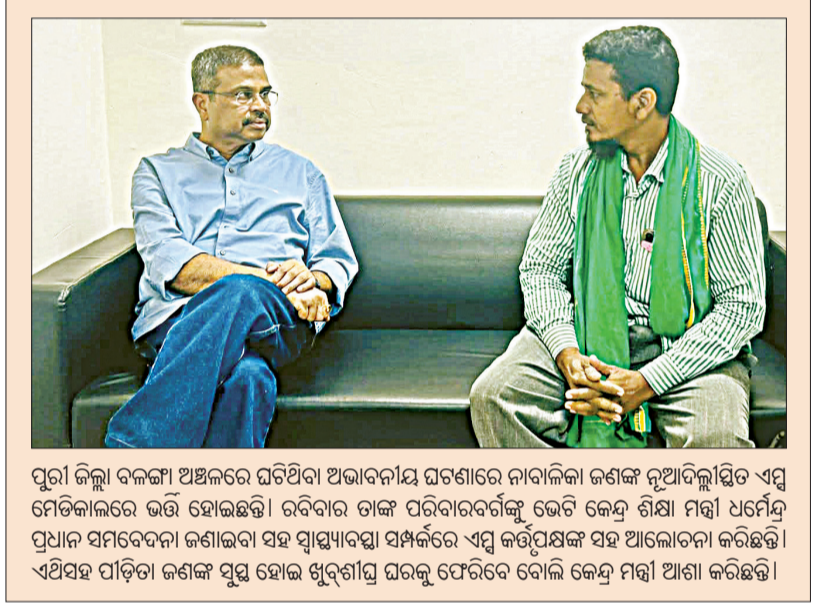
ପୁରୀ ଜିଲ୍ଲା ବଳଙ୍ଗା ଅଞ୍ଚଳରେ ଘଟିଥିବା ଅଭାବନାୟ ଘଟଣାରେ ନାବାଳିକା ଜଣଙ୍କୁ ନୂଆଦିଲ୍ଲୀରେ ଏସ୍ ପେଡ଼ିକାଲରେ ଭର୍ତ୍ତି ହୋଇଛନ୍ତି। ରବିବାର ତାଙ୍କୁ ପରିବାରବର୍ଗଙ୍କୁ ଭେଟି କେନ୍ଦ୍ର ଶିକ୍ଷା ମନ୍ତ୍ରୀ ଧର୍ମେନ୍ଦ୍ର ପ୍ରଧାନ ସମ୍ମାନଦାନ କରାଯାଇ ସହ ସ୍ୱାସ୍ଥ୍ୟାବସ୍ଥା ସମ୍ପର୍କରେ ଏସ୍ କର୍ତ୍ତୃପକ୍ଷରେ ସହ ଆଲୋଚନା କରିଛନ୍ତି। ଏଥିସହ ପାଡ଼ିତା ଜଣଙ୍କ ସୁସ୍ଥ ହୋଇ ଶୁଦ୍ଧାପ୍ତ ଘରକୁ ଫେରିବେ ବୋଲି କେନ୍ଦ୍ର ମନ୍ତ୍ରୀ ଆଶା କରିଛନ୍ତି।