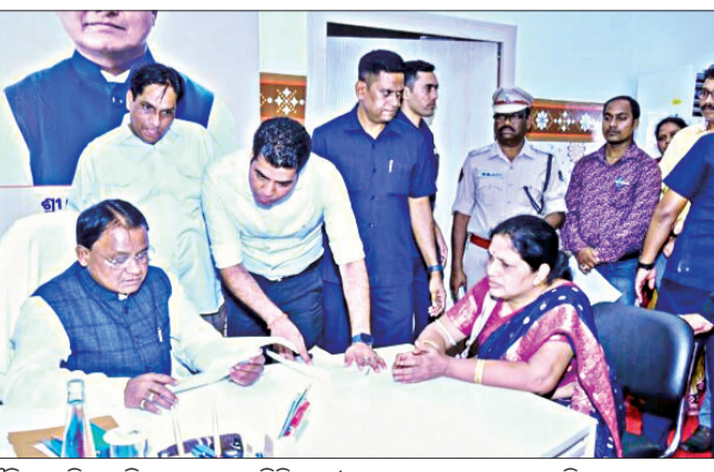
ରାଜନୈତିକ ରୁଚି ସେକିବା ଆରମ୍ଭ କରିଛନ୍ତି ନବୀନ ନିବାସ। ରାଜନୈତିକ ସ୍ତରରେ ଦେଖିବାକୁ ଗଲେ ପୂର୍ବ ଅପେକ୍ଷା ସରକାର ଅଧିକ ଲୋକାଭିମୁଖୀ ହୋଇଛି। ମୁଖ୍ୟମନ୍ତ୍ରୀ ପ୍ରାୟ ପ୍ରତି ସୋମବାର ସାଧାରଣ

ଭୁବନେଶ୍ୱର, ୨୦୧୭ (ସଂଚାର ବ୍ୟୁରୋ): ଗତ ଦେଢ଼ ବର୍ଷ ମଧ୍ୟରେ ମୋହନ ଚରଣ ମାଝୀଙ୍କ ନେତୃତ୍ୱରେ ରାଜ୍ୟ ସରକାର ବିକାଶଧାରୀ ଚଳାଇ ଇଂଜିନିୟରିଂ ସିଟ୍ ଦେଇଛନ୍ତି। ଏହି ସମୟ ଭିତରେ ସରକାର ନିର୍ବାଚନ ପ୍ରତିଷ୍ଠିତ ମୁକାବଳ ଶୁଭକ୍ରମା ଯୋଜନାରେ ୧ କୋଟିରୁ ଅଧିକ ମହିଳାଙ୍କୁ ୨ଟି କିସିରେ ୧୦ ହଜାର ଟଙ୍କା ପ୍ରଦାନ କରିବା ସରକାରଙ୍କ ପାଇଁ ଏକ ବଡ଼ ସଫଳତା। ଏପରିକି ରାଜ୍ୟ ନେତୃତ୍ୱ ଶକ୍ତିଶାଳୀ କରିବା ପାଇଁ ଖୋର୍ଦ୍ଧା ପ୍ରଧାନମନ୍ତ୍ରୀ ଗତ ଏକବର୍ଷ ଭିତରେ ୬ ଥର ଓଡ଼ିଶା ଆସିଛନ୍ତି, ଯାହା ଓଡ଼ିଶା ବିକାଶ ପ୍ରତି କେନ୍ଦ୍ରର ପ୍ରତିବଦ୍ଧତାକୁ ପ୍ରମାଣିତ କରିଛି। କିନ୍ତୁ ବିରୋଧୀ ଦଳକୁ ଏ ସଫଳତା ହଜମ ହେଉନା ଯେଉଁଥିପାଇଁ ପ୍ରତ୍ୟେକଟି ଘଟଣା ଦୁର୍ଘଟଣାରୁ