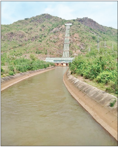
ଓ ପୋଡ଼ାଗଡ଼ ଭଳି ତିରସ୍ତୋତା ନଦୀମାନଙ୍କ ସମସ୍ତରେ ୧୧୦୦ଟି କିଲୋମିଟର ପରିବ୍ୟାପ୍ତ ଏକ ସୁରକ୍ଷିତ ଜଳଭଣ୍ଡାର ସୃଷ୍ଟି ହେଲା । ସେହି ଜଳରାଶିକୁ

କଳାହାଣ୍ଡି, ୨୦୧୭ (ସଂଚାର ବ୍ୟୁରୋ): ଇନ୍ଦ୍ରାବତୀ ପ୍ରକଳ୍ପ ପାଇଁ କଳାହାଣ୍ଡି ଜିଲ୍ଲାର ଏକ ଭିନ୍ନ ପରିଚୟ ସୃଷ୍ଟି ହୋଇଥିବା ବେଳେ ଏବେ ସେହି ପୂର୍ଣ୍ଣାଙ୍ଗ ପ୍ରକଳ୍ପ ପରିଷଦ ବର୍ଷ ପୂର୍ତ୍ତି କରିସାରିଛି । କଳାହାଣ୍ଡି ଜିଲ୍ଲାର ଅନେକ ମରୁଡ଼ି କ୍ଷେତ୍ରରେ ଫସଲ ପ୍ରଚାର କୁ ସିଧେଷ୍ଟରେ ଏକ ଉତ୍ପାଦନକାରୀ ଜିଲ୍ଲାର ମାନ୍ୟତା ଆଣିପାରିଛି । ଆର୍ଥିକ ବିକାଶକୁ ଦୃଢ଼ୀଭୂତ କରିପାରିଛି । ଇନ୍ଦ୍ରାବତୀର ଜଳସେଚନକୁ ପାଥେୟ କରି ଏବେ ଜିଲ୍ଲାର ୧.୧୮ ଲକ୍ଷ ହେକ୍ଟର ଜମିରେ ଜଳସେଚନ ହେବା ସହ ବୁଦ୍ଧ ଫସଲି ବାସ ମଧ୍ୟ ହୋଇପାରିଛି । ଅନ୍ୟପକ୍ଷେ ୬୦୦ମେଟାଓଫ୍ଟ ବିଜୁଳି ଉତ୍ପାଦନ କ୍ଷମତା ରଖିଥିବା ଇନ୍ଦ୍ରାବତୀ ବିଗତ ୨୫ବର୍ଷ ମଧ୍ୟରେ ୩୫୯୭.୨୫କୋଟି ଟଙ୍କାର ବିଦ୍ୟୁତ୍ ବିକ୍ରିକରି ରାଜ୍ୟ ମାନବିତ୍ୱରେ ନିଜକୁ ପ୍ରତିଷ୍ଠିତ କରିପାରିଛି ।