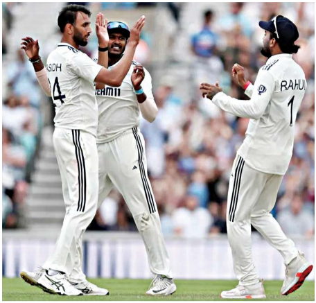
କେନିଙ୍ଗଟନ ଓଭାଲ,ମା଼ି଼: ରୋମାଞ୍ଚକର ମୋଡ଼ରେ ପହଞ୍ଚିଛନ୍ତି ଓଭାଲ ଟେଣ୍ଡେର । ଇଂଲଣ୍ଡକୁ ଡିଟିବାକୁ ଆଉ ମାତ୍ର ଗାଫ ରନ ଆବଶ୍ୟକ

ହେଉଥିବାବେଳେ ଭାରତକୁ ଆଉ ୪ଟି ଡ୍ରିକେଟ୍ ନେବାକୁ ହେବ । ତେବେ ଦୂର୍ଦ୍ଦି ଯୋଗୁଁ ଆଜି ଦିନର ଖେଳ ସମାପ୍ତ ହୋଇଛି । ଗା ୭ ୪ ରନର ଲକ୍ଷ୍ୟ ନେଇ ଖେଳୁଥିବା ଇଂଲଣ୍ଡ ୧୦୬ରେ ଗାଟି ଡ୍ରିକେଟ୍ ହରାଇ ଅତୁଆରେ