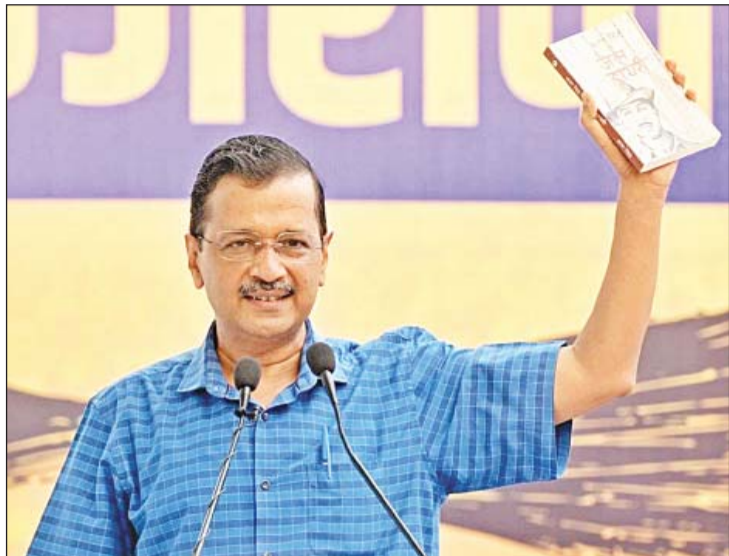
ସେ ତାଙ୍କ ପଦରୁ ଇସ୍ତଫା ଦେଇ ଜନତା ଦଳ କୋର୍ଟକୁ ଯିବେ। ନଭେମ୍ବର ଆଧାରରେ ସେ ପୁନର୍ବାର ମୁଖ୍ୟମନ୍ତ୍ରୀ ହେବେ। ଜନତା ଦଳ ଦାବିକରେ ତାହା ହେବ। ଉଲ୍ଲେଖ ଯୋଗ୍ୟ ଯେ,

ନୂଆଦିଲ୍ଲୀ, ୧୫୯: ସୁପ୍ରିମକୋର୍ଟରୁ ଜାମିନ ପାଇ କେଜରିୱାଲ ମୁଖ୍ୟମନ୍ତ୍ରୀ ପଦ ଛାଡ଼ିବେ ବୋଲି କହିଛନ୍ତି। ତେବେ କିଏ ତାଙ୍କ ସ୍ଥାନରେ କିଏ ମୁଖ୍ୟମନ୍ତ୍ରୀ ହେବେ ତାହା ସେ ସ୍ପଷ୍ଟ କରି ନାହାନ୍ତି। ତାଙ୍କ ଭଳି କେଜରିୱାଲ ମୁଖ୍ୟମନ୍ତ୍ରୀ ପଦ ଛାଡ଼ିବେ ବୋଲି କହିଛନ୍ତି। ତେବେ କିଏ ତାଙ୍କ ସ୍ଥାନରେ କିଏ ମୁଖ୍ୟମନ୍ତ୍ରୀ ହେବେ ତାହା ସେ ସ୍ପଷ୍ଟ କରି ନାହାନ୍ତି। ତାଙ୍କ ଭଳି କେଜରିୱାଲ ମୁଖ୍ୟମନ୍ତ୍ରୀ ପଦ ଛାଡ଼ିବେ ବୋଲି କହିଛନ୍ତି। ତେବେ କିଏ ତାଙ୍କ ସ୍ଥାନରେ କିଏ ମୁଖ୍ୟମନ୍ତ୍ରୀ ହେବେ ତାହା ସେ ସ୍ପଷ୍ଟ କରି ନାହାନ୍ତି।