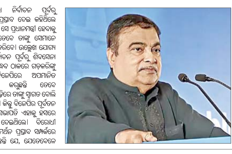
ତାଙ୍କୁ ବିରୋଧୀ ଦଳର ଜଣେ ନେତା ପ୍ରଧାନମନ୍ତ୍ରୀ ପଦ ପାଇଁ ସମର୍ଥନ ପ୍ରସ୍ତାବ ଦେଇଥିଲେ। ସେତେବେଳେ ସେ ତାଙ୍କୁ ଆପଣମାନେ ମତେ କାହିଁକି ସମର୍ଥନ କରିବେ? ମୁଁ କାହିଁକି ଆପଣମାନଙ୍କୁ ସମର୍ଥନ ନେବି ବୋଲି କହିଛନ୍ତି। ମୁଁ ମୋ ଦଳ ଏବଂ ସଙ୍ଗଠନ ପ୍ରତି ସମ୍ପୂର୍ଣ୍ଣ ଅନୁଗତ ବୋଲି ଗଡ଼କରି ତାଙ୍କୁ କଥାବ ଦେଇଥିବା କହିଥିଲେ। ମୋ ବିବେକ ଅନୁଯାୟୀ ମୁଁ ସବୁ ବେଳେ କାର୍ଯ୍ୟ କରିଛି ଓ କରିଚାଲିବି ବୋଲି ଗଡ଼କରି କହିଛନ୍ତି। ଏହା ହିଁ ଭାରତୀୟ ଗଣତନ୍ତ୍ରୀ ମୂଳ ଭିତ୍ତି ବୋଲି ଗଡ଼କରି କହିଛନ୍ତି।

ମୁମ୍ବାଇ, ୧୫୯: ଲୋକସଭା ନିର୍ବାଚନ ପୂର୍ବରୁ ବିରୋଧୀ ଦଳ ତାଙ୍କୁ ପ୍ରଧାନମନ୍ତ୍ରୀ ପଦ ଲାଗି ସମର୍ଥନ ପ୍ରସ୍ତାବ ଦେଇଥିଲେ। କିନ୍ତୁ ସେ ଏହାକୁ ପ୍ରତ୍ୟାଖ୍ୟାନ କରିବା ସହ ତାଙ୍କର ଏଭଳି ଲକ୍ଷ୍ୟ ବା ଆକାଂକ୍ଷା ନାହିଁ ବୋଲି ସ୍ପଷ୍ଟ କରିଥିବା କହିଛନ୍ତି କେନ୍ଦ୍ର ସଚିବ ପରିବହନ ମନ୍ତ୍ରୀ ନାଟିକା ଗଡ଼କରି। ନାଟିକା ଗଡ଼କରି ଯୋଗଦେବା ଅବସରରେ ଗଡ଼କରି କହିଛନ୍ତି ଯେ, ସେ କାହାର ନାମ ନେବାକୁ ଚାହୁଁନାହାନ୍ତି। କିନ୍ତୁ ବିରୋଧୀ ଦଳର ଜଣେ ପ୍ରମୁଖ ନେତା ତାଙ୍କୁ