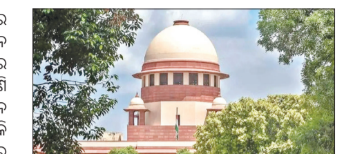
ନିର୍ବାଚନ କମିସନ କହିଛନ୍ତି ଠିକ୍ ଅଛି, ତଳର କର୍ମୀଙ୍କ ଉପରେ ନିର୍ଦ୍ଦେଶ ଯଦି ଏହା ଆପଣଙ୍କ ନିର୍ଦ୍ଦେଶ, ତେବେ କରୁ କୋର୍ଟ କହିଥିଲେ ଯେ, ଆପଣ

ନୂଆଦିଲ୍ଲୀ, ୧୪ଟା: ସୁପ୍ରିମକୋର୍ଟରେ ବିଚାରଣା ଆରମ୍ଭ ହେବା ପରେ ନିର୍ବାଚନ କମିସନଙ୍କୁ ପଚାରିଥିଲେ ଯେ, କାହିଁକି ହଟାଯାଇଥିବା ୬୫ ଲକ୍ଷ ଲୋକଙ୍କର ତଥ୍ୟ ସାର୍ବଜନୀନ କରାଯାଇନାହିଁ । ଏହାକୁ ସାର୍ବଜନୀନ କରାଯାଉ ।