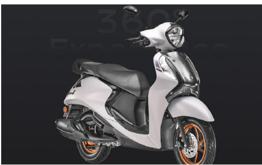
ନୂତନ କଳାରେ ଡିଜାଇନ୍ କରାଯାଇଛି । ଏଥିରେ ଫାଇନଲ୍ ଡିଜାଇନ୍ ମୋଟର ଆଉ ମାଧ୍ୟମରେ ଡିଜାଇନ୍ କରାଯାଇଛି । ୨୦୨୫ ଯାମାହା ଫ୍ୟାସିନୋ ୧୨୫ରେ ଏକ ନୂଆ କଲର

ନୂଆଦିଲ୍ଲୀ, ୧୫/୮: ଯାମାହା ମୋଟର ଇଣ୍ଡିଆ ଗୁରୁବାର ୨୦୨୫ ଫ୍ୟାସିନୋ ୧୨୫ ହାଇବ୍ରିଡ୍ ଏଫଆଇ ସ୍କୁଟର ଲକ୍ଷ କରିଛି । ୨୦୨୫ ଫ୍ୟାସିନୋ ୧୨୫ ଏଫଆଇ ହାଇବ୍ରିଡ୍ ସ୍କୁଟର ରହିଛି ଆହୁରି ଅଧିକ ଫିଟ୍ ଏବଂ କଲର ଅସନା କମ୍ପାନିର ସୁତରା ଅନୁସାରେ ୨୦୨୫