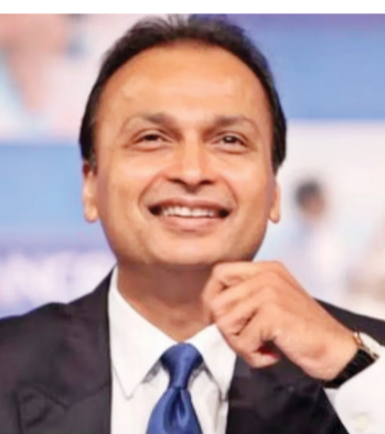
ଅନିଲ ଅମ୍ବାନୀଙ୍କ କମ୍ପାନୀ ରିଲାଏନ୍ସ ଇନସୁରାନ୍ସ (ଆରଇନସୁ) ପାଇଁ ଏକ ଖୁସି ଖବର ଅଛି । କମ୍ପାନୀ ରୁପ୍ୟାନ୍ ସୁତରା ଦେଇଛି ଯେ ଏହା ଆରାବଲି ପ୍ରାଇଭେଟ୍ ଲିମିଟେଡ୍ ବିରୁଦ୍ଧରେ ୫୨୬କୋଟି ଟଙ୍କାର ମଧ୍ୟସ୍ତର ପୁରସ୍କାର ପାଇଛି ।

ମୁମ୍ବାଇ, ୧୫/୮: ଅନିଲ ଅମ୍ବାନୀଙ୍କ କମ୍ପାନୀ ରିଲାଏନ୍ସ ଇନସୁରାନ୍ସ (ଆରଇନସୁ) ପାଇଁ ଏକ ଖୁସି ଖବର ଅଛି । କମ୍ପାନୀ ରୁପ୍ୟାନ୍ ସୁତରା ଦେଇଛି ଯେ ଏହା ଆରାବଲି ପ୍ରାଇଭେଟ୍ ଲିମିଟେଡ୍ ବିରୁଦ୍ଧରେ ୫୨୬କୋଟି ଟଙ୍କାର ମଧ୍ୟସ୍ତର ପୁରସ୍କାର ପାଇଛି । କମ୍ପାନୀ ଏକ୍ସକେକ୍ୟୁଟିଭ୍ ଫାଇଲିଂରେ ସୁତରା ଦେଇଛି ଯେ ୨୦୧୮ରେ ଆରାବଲି ପ୍ରାଇଭେଟ୍ ଲିମିଟେଡ୍ ବିରୁଦ୍ଧରେ ଶେଷ କରିବା ପରେ ରିଲାଏନ୍ସ ଇନସୁରାନ୍ସ ମଧ୍ୟସ୍ତର ପ୍ରତ୍ୟୁତ୍ଥାନର ସାହାଯ୍ୟ ଲୋଡ଼ିଥିଲା ।