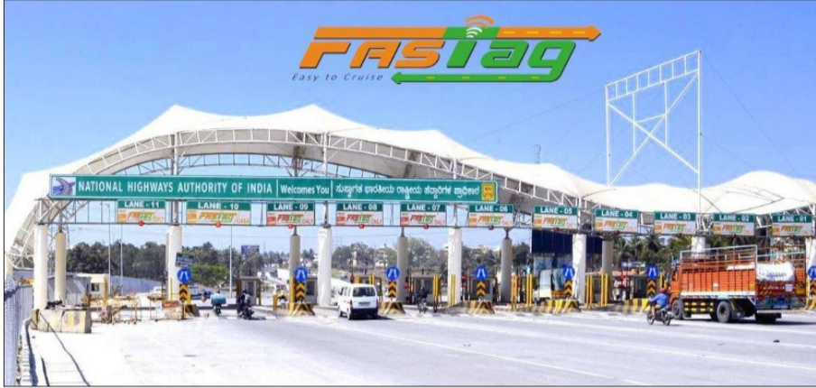
୧.୩୯ ଲକ୍ଷ କାରବାର ରେକର୍ଡ କରାଯାଇଛି। କୁହାଯାଉଛି ଯେ ପ୍ରାୟ ୨୦,୦୦୦ - ୨୫,୦୦୦ ଯୁକ୍ତ ସବୁବେଳେ ରାଜମାର୍ଗ ଯାତ୍ରା ଆପ୍ ବ୍ୟବହାର କରୁଛନ୍ତି ଏବଂ ବାର୍ଷିକ ପାସ୍ ଯୁକ୍ତମାନଙ୍କୁ ଗୋଟି ଫି ଶୁଳ୍କ କାଟିବା ପାଇଁ SMS