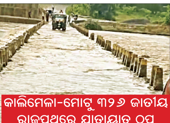
କାଲିମେଳା-ମୋଗୁ ୩୨୬ ଜାତୀୟ ରାଜପଥରେ ଯାତାୟତ ଠିକ୍

କାଲିମେଳା, ୧୬ ଅଗଷ୍ଟ (ସଂଚାର ବ୍ୟୁରୋ): ଲଗାଣ ବର୍ଷରେ ଭୂକମ୍ପ ଏମ୍‌ଜି ୯୨ ବ୍ରିଜ୍ ଉପରେ ୩ ଫୁଟ ବର୍ଷା ଜଳ ପ୍ରବାହିତ । କାଲିମେଳା - ମୋଗୁ ୩୨୬ ଜାତୀୟ ରାଜପଥରେ ଯାତାୟତ ଠିକ୍ ହୋଇଯାଇଛି । ଉଭୟ ପଟେ ଅନେକ ଯାନବାହାନ ଅଟକ ରହିଛି । ଅନ୍ୟପକ୍ଷରେ ସମସ୍ୟା କରୁଛି ତଳୁଆ ପୋଲ । ପ୍ରତିବର୍ଷ ବର୍ଷା ଯୋଗୁଁ ୩୨୬ ଜାତୀୟ ରାଜପଥ ଉପରେ ଥିବା ଏମ୍‌ଜି ୯୨ ପୋଲଟି ଭୁକ୍ତି ଯାଇଛି, ଫଳରେ ଜନ ସାଧାରଣ ନାହିଁ ନ ଥିବା ଅସୁବିଧାର ସମ୍ମୁଖୀନ ହେଉଥିବାର କହିଛନ୍ତି । ଅନ୍ୟ ପକ୍ଷରେ ୩୨୬ ବର୍ଷ ତଳେ ଏହି ପୋଲ ନିକଟରେ ଏକ ହାଇଲେଭ ପୋଲ ନିର୍ମାଣ କରାଯାଇଥିଲେ ମଧ୍ୟ ତାହା ବି ଅସମ୍ପୂର୍ଣ୍ଣ ହୋଇ ପଡ଼ିବୋଲି । ଏଥିସହିତ ବିପଦପୂର୍ଣ୍ଣ ଭାବରେ କିଛି ଅମାନିଆ ଗାଡ଼ି ଚାଳକ ପୋଲ ଉପରେ ଗାଡ଼ି ନେଇ ଯାଉଥିବାର ଦେଖା ଯାଇଛି । ତେଣୁ ଯଥା ଶୀଘ୍ର ଅସମ୍ପୂର୍ଣ୍ଣ ଅବସ୍ଥାରେ ଥିବା ପୋଲଟି ସମ୍ପୂର୍ଣ୍ଣ କରାଯାଇପାରିବେ ଏହି ସମସ୍ୟା ଆଉ ରହିବ ନାହିଁ ବୋଲି କହିଛନ୍ତି ସ୍ଥାନୀୟ ବାସିନ୍ଦା ।