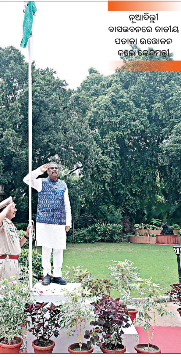
ନୂଆଦିଲ୍ଲୀ ବାସଭବନରେ ଜାତୀୟ ପତାକା ଉତ୍ତୋଳନ କଲେ କେନ୍ଦ୍ରମନ୍ତ୍ରୀ