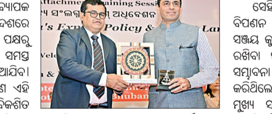
ରଘୁନାଥ କ୍ଷେତ୍ରରେ ଓଡ଼ିଶାରେ ଦେଶର ସୁଯୋଗ ରହିଛି। ବିଭିନ୍ନ ବ୍ୟାପକରେ ଅବସ୍ଥାପିତ ଭାରତୀୟ ଦୁତାବାସ ସମ୍ପର୍କ ମଧ୍ୟ ରଘୁନାଥ ଦୃଷ୍ଟି ଦିଗରେ ସମସ୍ତ ପ୍ରକାର ସହଯୋଗ ଯୋଗାଇ ଦିଆଯିବ।

ଭୁବନେଶ୍ୱର, ୩୧ (ସଂଚାର ବ୍ୟୁରୋ): ରଘୁନାଥ କ୍ଷେତ୍ରରେ ଓଡ଼ିଶାରେ ଦେଶର ସୁଯୋଗ ରହିଛି। ବିଭିନ୍ନ ବ୍ୟାପକରେ ଅବସ୍ଥାପିତ ଭାରତୀୟ ଦୁତାବାସ ସମ୍ପର୍କ ମଧ୍ୟ ରଘୁନାଥ ଦୃଷ୍ଟି ଦିଗରେ ସମସ୍ତ ପ୍ରକାର ସହଯୋଗ ଯୋଗାଇ ଦିଆଯିବ।