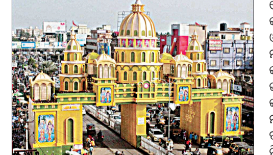
କଟକ ସହରରେ ନିରାପତ୍ତ ଓ ସୁରାମ ଭାବେ ଦୁର୍ଗାପୂଜା ପାଳନ ସୁନିଶ୍ଚିତ କରିବା ପାଇଁ ସାଂସ୍କୃତିକ ପରମ୍ପରା, ସୁରକ୍ଷା ନିୟମ ଓ ଗ୍ରାମିକ ପରିଚାଳନାକୁ ବିଚାରକୁ ନେଇ ଜିଲ୍ଲାପାଳଙ୍କ ମାନକ କାର୍ଯ୍ୟ ପତ୍ର (ଏସ୍ଓପି) ଜାରି କରାଯାଇଛି।

କଟକ, ୩୧ (ସଂଚାର ବ୍ୟୁରୋ): କଟକ ସହରରେ ନିରାପତ୍ତ ଓ ସୁରାମ ଭାବେ ଦୁର୍ଗାପୂଜା ପାଳନ ସୁନିଶ୍ଚିତ କରିବା ପାଇଁ ସାଂସ୍କୃତିକ ପରମ୍ପରା, ସୁରକ୍ଷା ନିୟମ ଓ ଗ୍ରାମିକ ପରିଚାଳନାକୁ ବିଚାରକୁ ନେଇ ଜିଲ୍ଲାପାଳଙ୍କ ମାନକ କାର୍ଯ୍ୟ ପତ୍ର (ଏସ୍ଓପି) ଜାରି କରାଯାଇଛି। ଏଥିସହ କଟକ ସହରରେ ଦୁର୍ଗାପୂଜା ଉତ୍ସବ ସହ ଜଡ଼ିତ ସମସ୍ତ ପୂଜା କମିଟି, ଅଂଶଦାର ଓ ଅଂଶଗ୍ରହଣକାରୀଙ୍କ ପାଇଁ ପ୍ରସ୍ତୁତ।