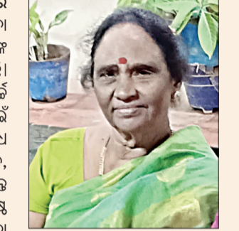
ଆୟୁଷ୍ମାନ ବୟୋବନ୍ଦନ ଯୋଜନା ବରିଷ୍ଠ ନାଗରିକମାନଙ୍କ ପାଇଁ ଦୁଃଖ କାଳର ସାହାରା ସାଜିଛି।

ଭୁବନେଶ୍ୱର, ୩୧ (ସଂଚାର ବ୍ୟୁରୋ): ଆୟୁଷ୍ମାନ ବୟୋବନ୍ଦନ ଯୋଜନା ବରିଷ୍ଠ ନାଗରିକମାନଙ୍କ ପାଇଁ ଦୁଃଖ କାଳର ସାହାରା ସାଜିଛି। ବଡ଼ ବଡ଼ ହସିଚାଲମାନଙ୍କରେ ଖର୍ଚ୍ଚ ବହୁଳ ଚିକିତ୍ସା ସେବାକୁ ପାଇଁ ଏବେ ଦେୟମୁକ୍ତ ଭାବେ ସହଜଲବ୍ଧ ହୋଇଛି।