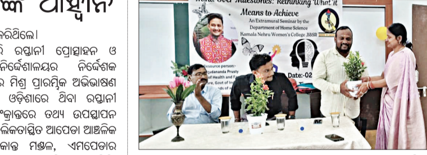
ଭୁବନେଶ୍ୱର, ୩୧ (ସଂଚାର ବ୍ୟୁରୋ): କମଳା ନେହେରୁ ମହିଳା ମହାବିଦ୍ୟାଳୟର ଗୃହ ବିଜ୍ଞାନ ବିଭାଗ ତରଫରୁ ମାନସିକ ସ୍ୱାସ୍ଥ୍ୟ ସମୁଦାୟ ଏକ ସେମିନାର କଲେଜ ପରିସରରେ ଅନୁଷ୍ଠିତ ହୋଇଯାଇଅଛି।