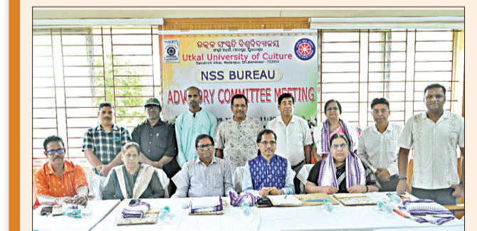
ଭୁବନେଶ୍ୱର, ୩୧ (ସଂଚାର ବ୍ୟୁରୋ): ଉତ୍କଳ ସଂସ୍କୃତି ବିଶ୍ୱବିଦ୍ୟାଳୟର ଜାତୀୟ ସେବା ଯୋଜନା ଆନୁକୂଲ୍ୟରେ ବାର୍ଷିକ ଉପଦେଷ୍ଟା କମିଟି ବୈଠକ ଅନୁଷ୍ଠିତ ହୋଇଯାଇଛି।