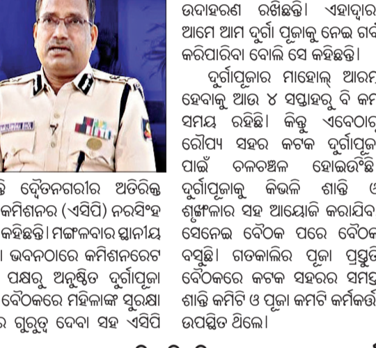
କମିଶନରେଟ୍ ପୁଲିସର ଦୁର୍ଗାପୂଜା ପ୍ରସ୍ତୁତି ବୈଠକରେ ମହିଳାଙ୍କ ସୁରକ୍ଷା ଉପରେ ଏସିପିଙ୍କ ଗୁରୁତ୍ୱାରୋପ କରାଯାଇଛି।

ଭୁବନେଶ୍ୱର, ୩୧ (ସଂଚାର ବ୍ୟୁରୋ): ଦୁର୍ଗାପୂଜାର ଆୟୋଜନ ଏବଂ ପରିଚାଳନା ଏପରି ହେବା ଆବଶ୍ୟକ, ଯେପରି କଣେ ମହିଳା ମେଢ଼ ଭିତରେ ନିଜକୁ ସୁରକ୍ଷିତ ମନେ କରିବେ। ଏକ ଭୟ ମୁକ୍ତ ବାତାବରଣରେ ତାଙ୍କୁ ଭୁଲି ପାରିବେ। ସେହିଭଳି ପୂଜା ସମୟରେ ମେଲୋଡି ପରିବେଷଣ ସମୟରେ କଣେ ବାପା ତାଙ୍କୁ ସହ ଏକାଠି ବସି ମେଲୋଡି କାର୍ଯ୍ୟକ୍ରମ ଦେଖିପାରିବେ ଓ ଶୁଣିପାରିବେ।