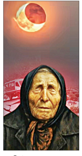
ନୂଆଦିଲ୍ଲୀ, ୬।୯: ସେପ୍ଟେମ୍ବର ୬ ରେ ହେବାକୁ ଯାଉଛି ବର୍ଷର ସବୁଠୁ ବଡ଼ ଚନ୍ଦ୍ର ଗ୍ରହଣ। ଯାହା କୁମ୍ଭ, ରାଶି

ଅଧୀନରେ ଘଟିବ, ଯାହାର ଅଧିକାରୀ ହେଉଛନ୍ତି ଶନି। ଏହି ଗ୍ରହଣ ମାନସିକ ସ୍ତରରେ ଅନେକଙ୍କ ପାଇଁ ବ୍ୟାଲେଞ୍ଜ ଆଣିପାରେ। କର୍କଟ, କନ୍ୟା, ତୁଳା, ମକର ଏବଂ ମୀନ ରାଶିର ବ୍ୟକ୍ତିମାନେ ଏହି ସମୟରେ ମାନସିକ ସଂକ୍ରାନ୍ତିରେ ବିଶେଷ ଧ୍ୟାନ ଦେବା ଆବଶ୍ୟକ। ଏହି ଗ୍ରହଣ ସମୟରେ ଏବଂ ପରେ ମଧ୍ୟ ଏହି ରାଶିର ଲୋକମାନେ ମାନସିକ ଚାପ ଅନୁଭବ କରିପାରନ୍ତି। କର୍କଟ: କର୍କଟ ରାଶିର ବ୍ୟକ୍ତିମାନେ ବ୍ୟକ୍ତିଗତ କାରଣରୁ ମାନସିକ ଚାପ ଅନୁଭବ କରିପାରନ୍ତି। ଏହି ସମୟରେ ସେମାନେ ଅଧିକ ସମ୍ବେଦନଶୀଳ ହୋଇପାରନ୍ତି। ମିଥୁନ: ମିଥୁନ ରାଶିର ବ୍ୟକ୍ତିମାନେ ନିଜ ଭାବନାକୁ ନିୟନ୍ତ୍ରଣ କରିବାକୁ ପରାମର୍ଶ ଦିଆଯାଉଛି। ସଂକ୍ରାନ୍ତି ଏବଂ ଆତ୍ମ-ଯତ୍ନ ଉପରେ ଧ୍ୟାନ ଦେବା କଠିନ ହୋଇପାରେ। ମକର: ମକର ରାଶିର ବ୍ୟକ୍ତିମାନେ ସମ୍ପର୍କ ସମ୍ବନ୍ଧୀୟ ସମସ୍ୟାର ସମ୍ମୁଖୀନ ହୋଇପାରନ୍ତି। ଏହି ସମୟରେ ସେମାନଙ୍କୁ ଧୈର୍ଯ୍ୟ ରଖିବା ଏବଂ ଆଲୋଚନା ମାଧ୍ୟମରେ ସମସ୍ୟା ସମାଧାନ କରିବାକୁ ପରାମର୍ଶ ଦିଆଯାଉଛି। ମୀନ: ମୀନ ରାଶିର ଲୋକମାନେ