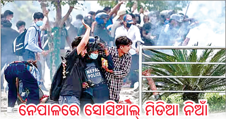
ନେପାଳରେ ସୋସିଆଲ୍ ମିଡିଆ ନିଆଁ