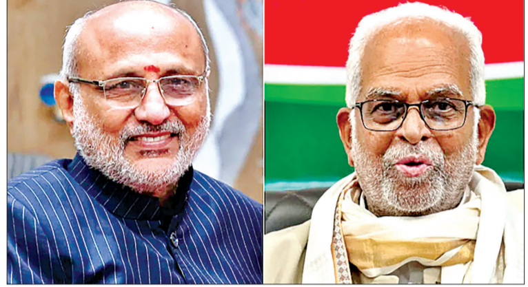
ନିର୍ବାଚନ ସମ୍ପର୍କରେ ଭୋଟ୍ ଗ୍ରହଣ ପୂର୍ତ୍ତା ୧୦ଟା ବେଳେ ଆରମ୍ଭ ହେବ ଏବଂ ୫ଟା ପର୍ଯ୍ୟନ୍ତ ଜାରି ରହିବ। ସଂସଦରେ ସମ୍ପାଦକ ମତଦାନ କରିବେ। ଏଥି