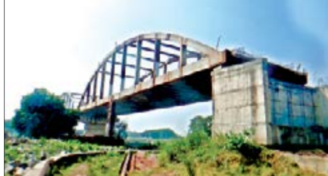
ଅବଧି ସରିଲା ପରେ ବି ସତ ହେଉଛି ଧନୁ ସେତୁ ସ୍ୱପ୍ନ

ସେପଟେ ଯାକପୁର ଜିଲ୍ଲାପାଳ ଓ ସାଂସଦ କହୁଛନ୍ତି ଜମି ଅଧିଗ୍ରହଣ ଲାଗି ପଡ଼ିବାରୁ, ବେଶ୍ୟା କରୁଛୁ ଖୁବ ଶୀଘ୍ର ସମାଧାନ କରି କାର୍ଯ୍ୟ ସାରିବାକୁ ସରକାର ବଦଳିଲା କିନ୍ତୁ ପୂର୍ଣ୍ଣା ଠିକାଦାର ପ୍ରତି ରେ ଯାକପୁର ପୂର୍ଣ୍ଣ ବିଭାଗ। ପାଣି ରେ ପଡ଼ିଛି ଶହ ହେକ୍ଟର ଜମି ଓ ଶହ ଶହ ନିର୍ମୂଳ କିନ୍ତୁ ସବୁ ସେତୁ ଦର୍ଶି ଦର୍ଶି ହେବ ନିର୍ମୂଳ ହେଉଥିବା ବେଳେ ଲୋକ ଙ୍କ ସମସ୍ୟା କୁ ଖାତିର କରୁଛି ଯାକପୁର ପୂର୍ଣ୍ଣ ବିଭାଗ।