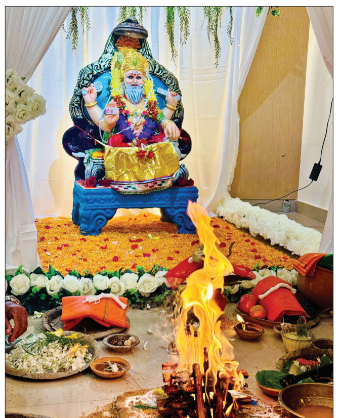
ସଂଚାର କାର୍ଯ୍ୟାଳୟରେ ଉତ୍ସାହ ଭାଙ୍ଗିପାରି ସହ ପାଳିତ ହୋଇଛି ବିଶ୍ୱକୀର୍ତ୍ତୀ ପୂଜା

ସଂଖ୍ୟାଦୃଷ୍ଟିରୁ ବିରଳ ରେକର୍ଡ଼ କରିବା, ଗିନିଜ ବୁକ୍ ଅଫ୍ ୱାର୍ଲ୍ଡ୍ ରେକର୍ଡ଼ରେ ସ୍ଥାନ ପାଇବା ଓ ଅନ୍ୟ ରାଜ୍ୟ ପାଇଁ ଦୃଷ୍ଟାନ୍ତ ସାଜିବା ଓଡ଼ିଶା ସରକାରଙ୍କ ପାଇଁ ଗୌରବର କଥା, କିନ୍ତୁ ତା'ର ବଡ଼ ଲକ୍ଷ ହେଉଛି ଆଗାମୀ ପ୍ରତିକ୍ଷା ପାଇଁ ଏକ ସୁସ୍ଥ-ସୁନ୍ଦର-ସମୃଦ୍ଧ-ସୁଯ୍ୟ ସୃଷ୍ଟି ଓଡ଼ିଶା ନିର୍ମାଣ କରିବା। ସୁନ୍ଦରଗଡ଼ ଜିଲ୍ଲା ୧୪,୨୧,୬୧୮ ଚାରା ରୋପଣ ସହ ଏହି ଅଭିଯାନରେ ଶୀର୍ଷରେ ରହିଛି। କୋରାପୁଟ ୧୧,୦୧,୬୨୪ ଚାରା ରୋପଣ ସହିତ ଦ୍ୱିତୀୟ ଏବଂ କେନ୍ଦୁଝର ୧୦,୪୨,୯୨୭ ଚାରା ରୋପଣ ସହିତ ତୃତୀୟ ସ୍ଥାନରେ ରହିଛି। ମୟୂରଭଞ୍ଜ ୯,୧୭,୬୫୯ ଏବଂ କଳାହାଣ୍ଡି ୭,୭୭,୫୧୦ ଚାରା ରୋପଣ ସହିତ ଚତୁର୍ଥ ଏବଂ ପଞ୍ଚମ ସ୍ଥାନରେ ରହିଛନ୍ତି । ୧,୩୧,୮୮୫ ଚାରା ରୋପଣ ସହିତ ଦେବଗଡ଼ ତାଲିକାର ଶେଷରେ ରହିଛି।