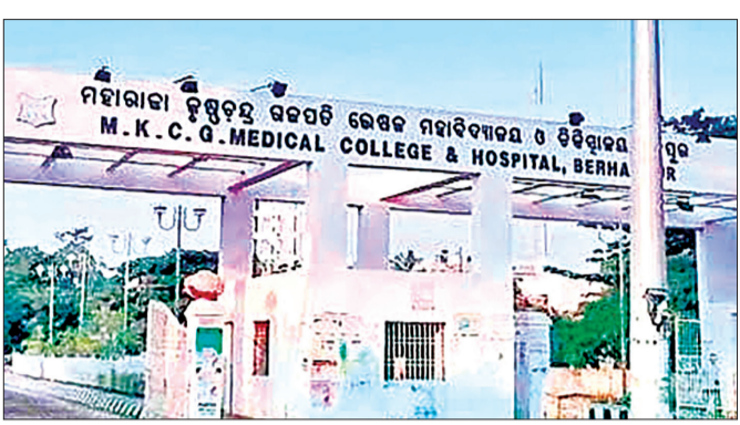
ଗଦା ସମସ୍ୟା ଥିବା ସତ୍ତ୍ୱେ ପ୍ରଶାସନିକ ଅବହେଳାକୁ ଅନେକ ସମୟରେ ଚାନ୍ଦା କରାଯାଇଛି। ଏପରି ସ୍ଥିତି ପୁନର୍ବାର ଜଣେ ଅଧିକାରୀଙ୍କୁ ଉକ୍ତ ସ୍ଥାନରେ ବସାଇବାକୁ ଲୋକେ ସହଜରେ ଗ୍ରହଣ କରିପାରୁନାହାନ୍ତି। ବର୍ତ୍ତା ହେଉଛି,

ଜିଲ୍ଲାପାଳ (ଏଏସିଏମ୍) ଭାବେ ନିଯୁକ୍ତି ପ୍ରଦାନ କରାଯାଇଥିଲା। କିନ୍ତୁ ଉକ୍ତ ଦିନ ହିଁ ବଦଳିକୁ ସ୍ଥଗିତ ରଖାଯାଇଥିବା ଆଉ ଏକ ତିଠି ସାମ୍ବାଲୁ ଆସିଥିଲା। ସମ୍ପ୍ରତି ଗତ ୧୭ ତାରିଖରେ ରାଜ୍ୟ ସରକାରଙ୍କ ପକ୍ଷରୁ ତାଙ୍କ ବଦଳିକୁ ସମ୍ପୂର୍ଣ୍ଣ ବାତିଲ କରାଯାଇଛି। ସରକାରଙ୍କ ଏଭଳି ପଦକ୍ଷେପ ପରେ ନାନା ଆଲୋଚନା ବଢ଼ିଛି। ପୂର୍ବ ବିଜେଡି ସରକାର ଭଳି ବର୍ତ୍ତମାନର ଭାବପା ସରକାରରେ ମଧ୍ୟ ବାବୁ ରାଢ଼ ବାଲିଥିବା ଆଲୋଚନା ହେଉଛି। କିଭଳି ଏବଂ କେଉଁ ପରିସ୍ଥିତିରେ ଜଣେ ଅଧିକାରୀଙ୍କ ବଦଳି ଉପରେ ଟ୍ରେକ୍ ଲଗାଗଲା ତାହା ସମସ୍ତଙ୍କୁ ଆଶ୍ଚର୍ଯ୍ୟ କରିଛି। ଏମ୍ବେସିଡିରେ ଗଦା