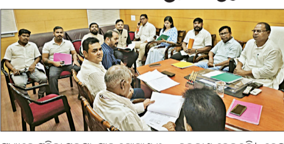
ମଧ୍ୟରେ ମହିଳା ସୁରକ୍ଷା, ସାର ଯୋଗାଣ ଓ ଚାଷୀଙ୍କ ସ୍ୱାର୍ଥ ରକ୍ଷା, ରାଜ୍ୟ ସ୍ୱାର୍ଥର ସୁରକ୍ଷା

ଭୁବନେଶ୍ୱର, ୧୭୯୮ (ସଂଚାର ବ୍ୟୁରୋ) : ବିଧାନସଭା ଅଧିବେଶନ ଆରମ୍ଭ ପୂର୍ବରୁ ଦୁଇ ପ୍ରମୁଖ ବିରୋଧୀ ଦଳ ପକ୍ଷରୁ ରଣନୀତି ପ୍ରସ୍ତୁତ ହୋଇଛି। ସରକାରକୁ ଯେଉଁ ଲାଗି ବିକେନ୍ଦ୍ର ଆଲୋଚନା କରାଯାଇଥିଲା, ସେହି ବିକେନ୍ଦ୍ର ପ୍ରସଙ୍ଗ କରିଥିବା ବେଳେ କଂଗ୍ରେସ ସରକାର ବିରୋଧରେ ଅନାସ୍ଥା ଆଣିବ ବୋଲି କହିଛି।