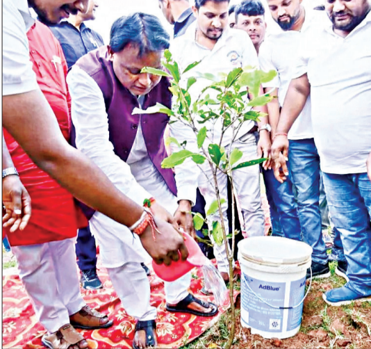
କେବଳ ଭାରତ ଇତିହାସରେ ନୁହେଁ, ସମଗ୍ର ବିଶ୍ୱ ଇତିହାସରେ ସୃଷ୍ଟି ଅକ୍ଷରରେ ଲିପିବଦ୍ଧ ହୋଇ ରହିବ। ଯେତେବେଳେ ଚାରା ରୋପଣ, ସାମାଜିକ ଏକତା ଓ ଏକ ଅଭିଯାନକୁ କିପରି ଆୟୋଜନରେ ପରିବର୍ତ୍ତନ କରାଯାଏ, ସେକଥା ସାମାଜିକ ଆସିବ। ଏକ ପେଟୁ ମା କେ ନାମ ଦ୍ୱିତୀୟ ସଂସ୍କରଣ

ଭୁବନେଶ୍ୱର, ୧୭୯୮ (ସଂଚାର ବ୍ୟୁରୋ) : ଏକ ଅନନ୍ୟ ଉତ୍ସାହ ଏବଂ ଏକ ଅଧ୍ୟାୟର ଉଦ୍ଦୀପନା ସୃଷ୍ଟି କରିଛି ଆଜି ଓଡ଼ିଶା। ମା' ଓ ମାତୃଭୂମି, ପ୍ରକୃତି ଓ ପରିବେଶକୁ ଓଡ଼ିଆମାନେ କେତେପ୍ରାଣରେ ଭଲ ପାଆନ୍ତି, ତାହା ଆଜି ପ୍ରମାଣିତ କରି ଦେଖାଇ ଦେଇଛନ୍ତି। ଓଡ଼ିଆମାନେ ଏକାଧାରରେ ହେଲେ କୋଶାଳ ଗଡ଼ିପାଉଛନ୍ତି, ଓଡ଼ିଆମାନେ ଏକାଧାରରେ ହେଲେ କଳ୍ପନା ଠାରୁ ଅଧିକ କିଛି କରିପାରନ୍ତି - ମାତ୍ର ୧୨ ଘଣ୍ଟା ଭିତରେ ପାଖାପାଖି ୧.୫ କୋଟି ଚାରା ରୋପଣ କରି ପ୍ରମାଣିତ କରି ଦେଖାଇଦେଇଛନ୍ତି ଓଡ଼ିଆମାନେ ସାରା ବିଶ୍ୱକୁ ସେମାନେ କିପରି ଏକ ମହାନ କାଳ୍ପନା କରି ସେପ୍ଟେମ୍ବର ୧୭, ୨୦୨୫ ତାରିଖ