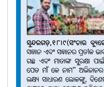
ସୁନ୍ଦରଗଡ଼, ୧୮।୯(ସଂଚାର ବ୍ୟୋରୋ): ନିଜ ମାଆଙ୍କ ପ୍ରତି ପ୍ରେମ, ସମ୍ମାନ ଏବଂ ସମ୍ମାନର ପ୍ରତୀକ ଭାବରେ ଏକ ଗଢ ଲଗାହେଲାକୁ ଏବଂ ଗଢ ଏବଂ ମାତାଙ୍କ ସୁରକ୍ଷା ପାଇଁ ପ୍ରତିଶ୍ରୁତିବଦ୍ଧ ହେଉଛି “ଏକ ପେଡ଼ ମାଁ କେ ନାମ” ଅଭିଜାନର ମୂଳ ଲକ୍ଷ୍ୟ। ଏହି ଅଭିଯୋଗ ଲକ୍ଷ୍ୟ ସାଧାରଣ ଲୋକଙ୍କୁ, ବିଶେଷକରି ଯୁବପିଢ଼ିଙ୍କୁ, ନିଜ ମାଆଙ୍କ ନାମରେ ତାରା ରୋପଣ କରିବାକୁ ହତେତନତା ସୃଷ୍ଟି କରିବା ଏବଂ ପ୍ରେରଣା ଦେବା। ଏହି “ଏକ ପେଡ଼ ମାଁ କେ ନାମ” ଅଭିଜାନର ଦ୍ୱିତୀୟ ସଂସ୍କରଣରେ ଭାରତର ପ୍ରଧାନମନ୍ତ୍ରୀ ନରେନ୍ଦ୍ର ମୋଦିଙ୍କ ୭୫ ଚମ ଜନ୍ମ ଦିବସରେ ୭୫ ଲକ୍ଷ ତାରା ରୋପଣ କରିବାର ଉଦ୍ଦେଶ୍ୟ ନେଇ ରାଜ୍ୟ ବ୍ୟାପୀ ବ୍ୟାପକ ଦୃଶ୍ୟରୋପଣ କାର୍ଯ୍ୟକ୍ରମ ଅନୁଷ୍ଠିତ ହୋଇଥିଲା। ଏହି ପରିପ୍ରେକ୍ଷାରେ ସ୍ୱେଚ୍ଛାସେବୀ ଅନୁଷ୍ଠାନ “ସେବକ”ର ପ୍ରତ୍ୟକ୍ଷ ତତ୍ତ୍ୱାବଧାନରେ ବାଲୁଆ ସୁରକ୍ଷା ଦୃଶ୍ୟରୋପଣର ଅଭିଜାନ “ଗ୍ରାମ ମୋଡ଼େରା କ୍ୟାମ୍ପେନ” ଚଳେଇଛି ଗୋଟିଏ ଦିନରେ ଓଡ଼ିଶାର ବିଭିନ୍ନ ଜିଲ୍ଲାରେ ୧୫୭୦୫ ଦୃଶ୍ୟରୋପଣ କରାଯାଇଛି। ସୁନ୍ଦରଗଡ଼, ଖାରସୁଗୁଡ଼ା, ସମ୍ବଲପୁର, ବୋଧ, ସୁବର୍ଣ୍ଣପୁର, ଅନୁଗୋଳ, ଦେବଗଡ଼ ଓ କେନ୍ଦୁଝର ଜିଲ୍ଲାର ୪୪୭ ଟି ସ୍ଥାନରେ ଏହି ଦୃଶ୍ୟରୋପଣ କରାଯିଥିବା ବେଳେ ଏଥିରେ ସାମିଲ ହୋଇଛନ୍ତି ୧୦ ହଜାରରୁ ଉର୍ଦ୍ଧ୍ୱ ଲୋକ। ସେବକ ଦ୍ୱାରା ପରିଚାଳିତ ସ୍ୱୟଂ ସହାୟକ ଗୋଷ୍ଠୀ, ବନ ସୁରକ୍ଷା ସମିତି, କୃଷକ ସଂଗଠନ, ଉପାଦାନ ଗୋଷ୍ଠୀ, ଗ୍ରାମ୍ୟ ସୁରକ୍ଷା ସଂଗଠନ, ଛାତ୍ର ଛାତ୍ରୀ ତଥା ସେବକର କର୍ମକର୍ତ୍ତା ମାନେ ଏହି ଦୃଶ୍ୟରୋପଣ କରିବା ସହିତ ଏହାର ସୁରକ୍ଷା ନିମନ୍ତେ ଗପସ୍ୱ ପାଠ କରିଥିଲେ। ତଳିତ ସେପ୍ଟେମ୍ବର ମାସ ଆରମ୍ଭରୁ ଏଠି ନିମନ୍ତେ ବିଭିନ୍ନ ପ୍ରକାର ପ୍ରସ୍ତୁତି ଆରମ୍ଭ କରାଯାଇଥିଲା ତଥା ଗ୍ରାମ୍ୟ ସୁରକ୍ଷା ବୈଠକ, ଲକ୍ଷ୍ୟ ଆଧାରିତ ଗୋଷ୍ଠୀ ବୈଠକ, ବାଲ୍ମୁକି ଗୋଷ୍ଠୀ ଦ୍ୱାରା ବିଦ୍ୟୁତ କାର୍ଯ୍ୟ ଶସତା ପ୍ରସ୍ତୁତ କରାଯାଇଥିଲା।