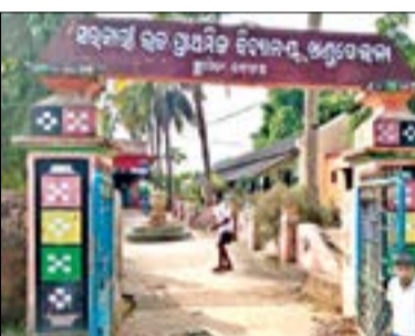
ପରିବର୍ତ୍ତେ ବିଦ୍ୟାଳୟର ପ୍ରଧାନ ଶିକ୍ଷକ, ପୂର୍ବତନ ପ୍ରଧାନଶିକ୍ଷକ, ଓ ପରିଚାଳନା କମିଟିର ସଭାପତିଙ୍କ ବିରୋଧରେ ମିଥ୍ୟା, ଭିତ୍ତିହୀନ ଓ କୋପକଲିତ ଅଭିଯୋଗ କରି ଥାନାରେ ମାମଲା ରଜୁ କରିଛନ୍ତି।