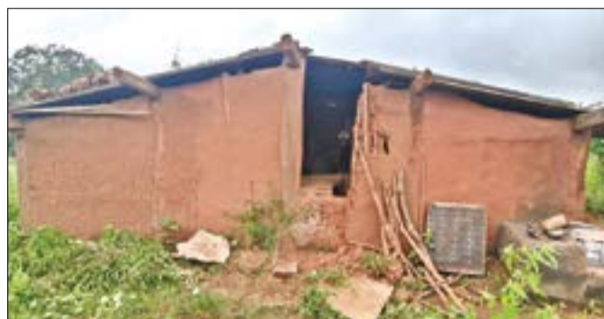
ବେନଗାଁ ଏପଟେ ସର୍ବସ୍ୱାକ୍ତ କରି ଉଠିବା ସହିତ ଧାନ, ଚାଉଳ, ମାଛ, ପଶୁ, ଶଶୀଳା ହରିଜନଙ୍କ ଘର ସମ୍ପୂର୍ଣ୍ଣ ବିନି ଓ ଆସବା ପତ୍ରକୁ ମାଡ଼ି ଦଳି ଚଳି

ଲାଞ୍ଜିଗଡ଼, ୧୮।୯(ସଂଚାର ବ୍ୟୋରୋ): କଳାହାଣ୍ଡି ଜିଲ୍ଲା ଦକ୍ଷିଣ ଦିଗରେ ବିଶୁଦ୍ଧାପୁର ରେଜି ଅଞ୍ଚଳରେ ବର୍ଷ ସାରା ଜଙ୍ଗଲୀ ହାତୀ ଉପଦ୍ରବ ବୃଦ୍ଧି ପାଇବାରେ ଲାଗିଛି। ଦିନକୁ ଦିନ ଜଙ୍ଗଲୀ ହାତୀପଲ ଗାଁ ମୁହାଁ ହୋଇ ଫସଲ ନଷ୍ଟ କରିବା ସହ ଅନେକ ଲୋକଙ୍କ ଘରଦ୍ୱାର ଭଙ୍ଗାଢ଼ୁଡ଼ା କରୁଥିବା ଦେଖିବାକୁ ମିଳୁଛି। ହାତୀ ମଣିଷ ଲଢ଼େଇ ଭିତରେ ଦୁର୍ଗମ ଅଞ୍ଚଳରେ ଲୋକେ ଗ୍ରାହଣୀୟ ଚାଲୁଛନ୍ତି। ଏହି ଭଳି ଏକ ଘଟଣା ଘଟିଛି ମୁଖ୍ୟାଳୟ ସେକ୍ଟର ବେନଗାଁ ପଞ୍ଚାୟତ ଅନ୍ତର୍ଗତ ଘୋଡ଼ାପୋଖରୀଗାଁରେ।