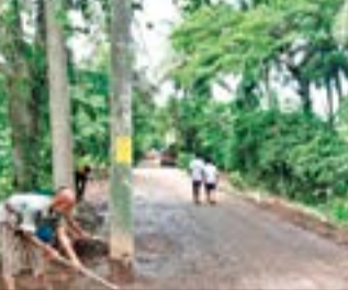
ପୁନଃନିର୍ମାଣ କରାଯାଇଥିଲା। ରାସ୍ତା ସମ୍ପ୍ରଦାନ ଫଳରେ ବଛାଲୋ ଗ୍ରାମ ଆରମ୍ଭରୁ ବଛାଲୋ ସ୍ଥଳ ପର୍ଯ୍ୟନ୍ତ ପ୍ରାୟ ୫ କି.ମି. ବିଦ୍ୟୁତ ଖୁଣ୍ଟ ରାସ୍ତା ମଧ୍ୟରେ ହୋଇଛି। ରାସ୍ତା ନିର୍ମାଣ ସମୟରେ ବିଭାଗ ତରଫରୁ ଖୁଣ୍ଟକୁ ନ ହଜାଇ ରାସ୍ତା ନିର୍ମାଣ କରାଯାଇଛି। ଯାହାଫଳରେ ରାସ୍ତା ମଧ୍ୟରେ ଖୁଣ୍ଟ ଥିବାରୁ ଅଧିକାଂଶ ସମୟରେ ଦୁର୍ଭିତ୍ତା ଘଟୁଥିବା ବେଳେ

ନାଉଗାଁ, ୧୮।୯(ସଂଚାର ବ୍ୟୋରୋ): ନାଉଗାଁ ବ୍ଲକ ଅନ୍ତର୍ଗତ ବଛାଲୋ ଗ୍ରାମ ଦେଇ ଗ୍ରାମ୍ୟ ଉନ୍ନୟନ ବିଭାଗ ପକ୍ଷରୁ ରାସ୍ତା ନିର୍ମାଣ କରାଯାଇଛି। ଦୀର୍ଘ ଦିନ ହେବ ଏହି ରାସ୍ତା ନିର୍ମାଣ କରାଯାଇଥିଲେ ମଧ୍ୟ ରାସ୍ତା ମଝିରେ ବିଦ୍ୟୁତ ଖୁଣ୍ଟ ଥିବାରୁ ଯାତାୟତରେ ଅସୁବିଧା ବାଧ୍ୟ କରୁଛି। ଏପରିକି ଅନେକ ସମୟରେ ଦୁର୍ଭିତ୍ତା ଘଟିବାର ନିଜେ ମଧ୍ୟ ରହିଛି। ଉକ୍ତ ରାସ୍ତା ନିର୍ମାଣ ପୂର୍ବରୁ ବିଦ୍ୟୁତ ବିଭାଗ ଦ୍ୱାରା ଉକ୍ତ ପଞ୍ଚାୟତକୁ ବିଦ୍ୟୁତ ସଂଯୋଗ ପାଇଁ ବିଦ୍ୟୁତ ଖୁଣ୍ଟ ପକାଯାଇଥିଲା। ପରେ ଗ୍ରାମ୍ୟ ଉନ୍ନୟନ ବିଭାଗ ଦ୍ୱାରା ଉକ୍ତ ରାସ୍ତାକୁ ସମ୍ପ୍ରଦାନ କରାଯିବା ସହ