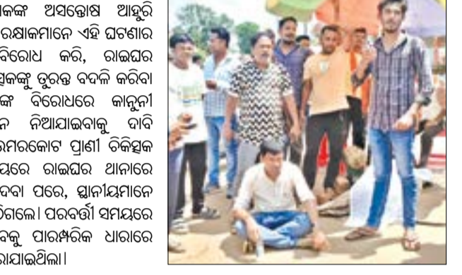
ପାଇଁ ଲୋକଙ୍କ ଅସନ୍ତୋଷ ଆହୁରି ବଢ଼ିଲା। ଗୋରକ୍ଷାକମଳେ ଏହି ଘଟଣାର କଠୋର ବିରୋଧ କରି, ରାଇଘର ପ୍ରାଣୀ ଚିକିତ୍ସକଙ୍କୁ ତୁରନ୍ତ ବଦଳି କରିବା ସହିତ ତାଙ୍କ ବିରୋଧରେ କାର୍ଯ୍ୟାନୁଷ୍ଠାନ ନିଆଯାଇବାକୁ ଦାବି କରିଛନ୍ତି। ଉପରକୋଟ ପ୍ରାଣୀ ଚିକିତ୍ସକ ଏହା ବିଷୟରେ ରାଇଘର ଥାନାରେ ଏତେଲା ଦେବା ପରେ, ସ୍ଥାନୀୟମାନେ ରାସ୍ତାରୁ ଉଠିଗଲେ। ପରବର୍ତ୍ତୀ ସମୟରେ ଗାଈର ଶବକୁ ପାରମ୍ପରିକ ଧାରାରେ ସଂସ୍କାର କରାଯାଇଥିଲା।

ଅବହେଳା ପ୍ରାୟତଃ ଘଟୁଥାଏ ଏବଂ ଏହାର ଫଳରେ ପଶୁମୃତ୍ୟୁ ଘଟିବା ସାଧାରଣ ଘଟଣାରେ ପରିଣତ ହୋଇଛି। ଆଶ୍ଚର୍ଯ୍ୟକର ଲୋକଙ୍କ କହିବା ଅନୁସାରେ, ଚିକିତ୍ସକଙ୍କୁ ଫୋନ କରାଯାଇଥିଲା, କିନ୍ତୁ ସେ ଆସିବାକୁ ପ୍ରତିବାଦ କରୁଥିଲେ ଏବଂ ପରେ ମୋବାଇଲ୍ ସ୍ୱିଚ୍ ଅଫ୍ କରିଦେଇଥିଲେ। ଘଟଣା ପରେ ଉପରକୋଟ ପ୍ରାଣୀ ଚିକିତ୍ସକ ସ୍ଥଳକୁ ପହଞ୍ଚିଲେ ଏବଂ ସ୍ଥାନୀୟଙ୍କୁ ସହିତ ନେଇ ରାଇଘର ପ୍ରାଣୀ ଚିକିତ୍ସକ କାର୍ଯ୍ୟାଳୟକୁ ଗଲେ। କିନ୍ତୁ ସେଠାରେ ତାଲା ଲାଗିଥିବା