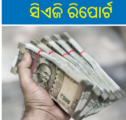
କୋଟି ଟଙ୍କା, ଛତିଶଗଡ଼ (୮୫୯୨ କୋଟି ଟଙ୍କା), ତେଲଙ୍ଗାନା (୫୯୪୪ କୋଟି ଟଙ୍କା), ଉତ୍ତରାଖଣ୍ଡ (୫୩୧୦ କୋଟି ଟଙ୍କା), ମଧ୍ୟପ୍ରଦେଶ (୪୦୯୧ କୋଟି ଟଙ୍କା) ଏବଂ ଗୋଆ (୨୩୯୯ କୋଟି ଟଙ୍କା)।

ଭୁବନେଶ୍ୱର, ୨୩।୯ (ସଂଚାର ବ୍ୟବସ୍ଥା): ଆର୍ଥିକ ପରିଚାଳନା କ୍ଷେତ୍ରରେ ସାରା ଦେଶ ପାଇଁ ଏକ ସଫଳ ମଡେଲ ପାଇଁ ଓଡ଼ିଶାକୁ ସିଏକି ପ୍ରଶଂସା କରିଛନ୍ତି। ପ୍ରଥମ ଥର ପାଇଁ ସିଏକି ରାଜ୍ୟ ଫାଇନାନ୍ସ ଉପରେ ଏକ ରିପୋର୍ଟ ଜାରି କରିଛନ୍ତି, ଯେଉଁଥିରେ ୨୦୨୨-୨୩ ଆର୍ଥିକ ବର୍ଷରେ ରାଜସ୍ୱ ବଳକା କ୍ଷେତ୍ରରେ ଓଡ଼ିଶା ଦେଶର ତୃତୀୟ ସ୍ଥାନରେ ଥିବା ଦର୍ଶାଯାଇଛି। ତାଲିକାର ପ୍ରଥମ ସ୍ଥାନରେ ୩୭,୨୬୩ କୋଟି ଟଙ୍କା ରାଜସ୍ୱ ବଳକା ସହ ଉତ୍ତରପ୍ରଦେଶ ଶୀର୍ଷ ସ୍ଥାନରେ ରହିଛି। ଏହା ପଛକୁ ଦ୍ୱିତୀୟ ଓ ତୃତୀୟ ସ୍ଥାନରେ ଯଥାକ୍ରମେ ଗୁଜରାଟ ଓ ଓଡ଼ିଶା ନାମ ରହିଛି। ଓଡ଼ିଶାର ରାଜସ୍ୱ ବଳକା ୧୯,୪୫୬ କୋଟି ଟଙ୍କା ଥିବା ରିପୋର୍ଟରେ ଦର୍ଶାଯାଇଛି। ସିଏକିର ରିପୋର୍ଟ କହିଛି ଯେ ୨୦୨୨-୨୩ରେ ୧୨ଟି ରାଜ୍ୟ ରାଜସ୍ୱ ବଳକା ଏବଂ ୧୨ଟି ରାଜ୍ୟ ରାଜସ୍ୱ ନିଅଣ୍ଟିଆ ଥିଲେ। ରାଜସ୍ୱ ବଳକା ଥିବା ରାଜ୍ୟଗୁଡ଼ିକ କ୍ରମାନ୍ୱୟରେ ହେଉଛି ଉତ୍ତରପ୍ରଦେଶ, ଗୁଜରାଟ (୧୯,୮୬୫ କୋଟି ଟଙ୍କା), ଓଡ଼ିଶା, ଝାଡ଼ଖଣ୍ଡ (୧୩,୫୬୪ କୋଟି ଟଙ୍କା), କର୍ଣ୍ଣାଟକ (୧୩,୪୯୬