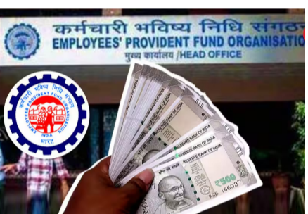
ଅର୍ଥ, ଟେଣ୍ଡ ସେମାନଙ୍କୁ ନିଜ ଆବଶ୍ୟକତା ଅନୁଯାୟୀ ଏହା ବ୍ୟବହାର କରିବାର ସୁଧାଧାର ମିଳିବ। ଉଚିତ।" ବର୍ତ୍ତମାନ ଇପିଏଫଓ ସହଯୋଗୀଙ୍କୁ ୫୮ ବର୍ଷ ବୟସରେ ସେବା ନିରୁଦ୍ଧି ପରେ କିମ୍ବା ଦୁଇ ମାସରୁ ଅଧିକ ସମୟ ବେକାର ରହିଲେ ମାତ୍ର ସମ୍ପୂର୍ଣ୍ଣ ଅର୍ଥ ଉଠାଣ କରିପାରିବେ। ଆଂଶିକ ଉଠାଣ

ନୂଆଦିଲ୍ଲୀ, ୨୩।୯: କେନ୍ଦ୍ର ସରକାର କର୍ମଚାରୀ ଭବିଷ୍ୟ ନିଧି ସଂଗଠନ (ଇପିଏଫଓ) ନିୟମରେ ପରିବର୍ତ୍ତନ ଆଣି ସହଯୋଗୀଙ୍କୁ ସେମାନଙ୍କର ସଞ୍ଚୟକୁ ଅଧିକ ସୁଧାଧାରରେ ସହ ବ୍ୟବହାର କରିବାର ସୁଯୋଗ ଦେବାକୁ ଚିନ୍ତା କରୁଛନ୍ତି। ରିପୋର୍ଟ ଅନୁଯାୟୀ, ଗୃହ ନିର୍ମାଣ, ବିବାହ ଏବଂ ଶିକ୍ଷା ଭଳି ଉଦ୍ଦେଶ୍ୟ ପାଇଁ ଟଙ୍କା ଉଠାଣ ସାମାନ୍ୟ କରାଯାଇପାରିବ। ଉପରେ ଅଧିକାରୀମାନେ କାମ କରୁଛନ୍ତି। ଦୁଇ ଜଣ ବରିଷ୍ଠ ସରକାରୀ ଅଧିକାରୀ ଗଣମାଧ୍ୟମକୁ କହିଛନ୍ତି ଯେ, ଏକ ବର୍ଷ ମଧ୍ୟରେ ଏହି ପରିବର୍ତ୍ତନ ଆଣିବାକୁ ଯୋଜନା ରହିଛି। କଣ୍ଠେ ଅଧିକାରୀ କାମ ନ ପ୍ରକାଶ କରିବା ସର୍ତ୍ତରେ କହିଛନ୍ତି, "ଏହା ସହଯୋଗୀଙ୍କ ନିଜ