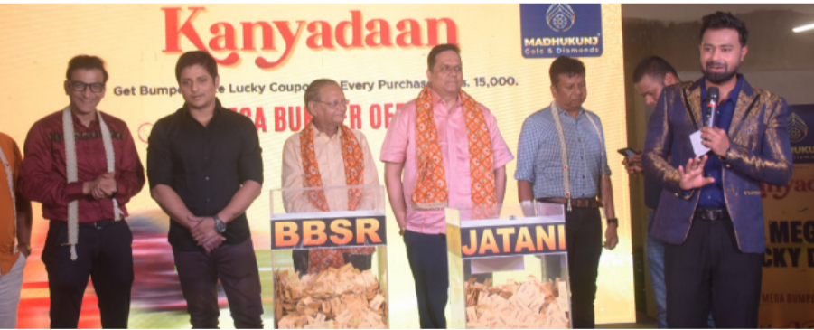
ମେଘା ବନ୍ଧନ ଅନୁଭବ। ସୁଖଦାନ ଏହି ଗ୍ରାହକ ସହ ଯୋଡ଼ି ହେବା ମୋ ପାଇଁ ଖୁସିର ବିଷୟ। ମଧୁକୁଞ୍ଜର କନ୍ୟାଦାନ ମେଘା ବନ୍ଧନ ଅଫର ଗତବର୍ଷ ଅଗଷ୍ଟ ୧୫ରେ ଆରମ୍ଭ ହୋଇଥିଲା। ଏଥିରେ ୧୫ ହଜାର ଟଙ୍କାର କିଶାକିଶି କରିଥିବା ଗ୍ରାହକଙ୍କୁ