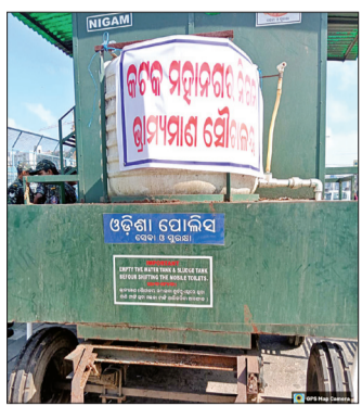
ସିଏମସି ଛକରେ ଯେଉଁ ଭ୍ରାମ୍ୟମାଣ ଶୌଚାଳୟ ରଖାଯାଇଛି ତାହାର ଅବସ୍ଥା କହିଲେ ନସରେ କେଉଁ ଶୌଚାଳୟରେ ପାରିନାହିଁ ତ କେଉଁ ଶୌଚାଳୟ ପ୍ୟାନରେ ମଇଳା ସଫାକରିବା ପଡିବାରୁ

କଟକ, ୩୦।୯ (ସଂଚାର ବ୍ୟୁରୋ): କଟକ ସହରରେ ଦଶହରା ଧୁମ୍‌ଧାମ୍‌ରେ ଓ ଶାନ୍ତିଶ୍ରୀମନ୍ଦିର ସହ ପାଳନ ହେବାପାଇଁ ଜିଲ୍ଲା ପ୍ରଶାସନ, କଟକ ମହାନଗର ନିଗମ, ପୁଲିସ ପ୍ରଶାସନ, ଜନସ୍ୱଚ୍ଛତା ନିଧି ଓ ପୁଲିସ୍‌ମାନଙ୍କୁ ନେଇ ବାରମ୍ବାର ବୈଠକ ହୋଇଥିଲା। ସହରରେ ପରିମଳ ବ୍ୟବସ୍ଥା ବିପର୍ଯ୍ୟୟ ନହେବା ସହ ଦଶହରା ଦେଖିବା ପାଇଁ ଦୂରଦୂରାନ୍ତରୁ ଆସୁଥିବା ଜନସାଧାରଣ, କାର୍ଯ୍ୟକାରୀ ପୁଲିସ୍, ଗ୍ରାମିକ ପୁଲିସ୍ ଓ ବ୍ୟବସାୟୀଙ୍କ ସୁବିଧା ନିମନ୍ତେ ସହରର ମୁଖ୍ୟ ଜନଗହଳପୂର୍ଣ୍ଣ ସ୍ଥାନରେ ଭ୍ରାମ୍ୟମାଣ ଶୌଚାଳୟ ରଖିବା ସହ ସଠିକ୍ ସେବା ଯୋଗାଇଦେବା ପାଇଁ କଟକ ମହାନଗର ନିଗମ ତରଫରୁ ବ୍ୟବସ୍ଥା ସଂପୂର୍ଣ୍ଣ ବିଫଳ ହୋଇଛି। କଟକ ସହରର ରାଣାହାଟ, ଓଏମସି ଛକ ଓ ଅନ୍ୟାନ୍ୟ ସ୍ଥାନରେ