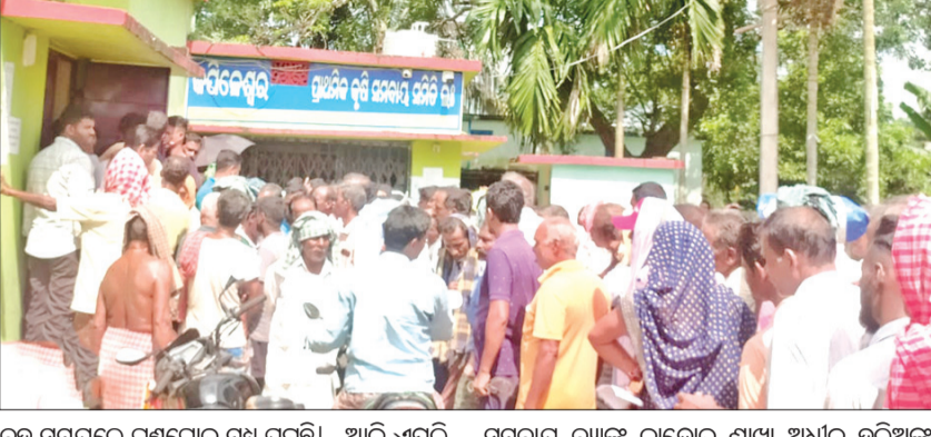
ବନ୍ଧୁ ସମୟରେ ଗଞ୍ଜଗୋଳ ମଧ୍ୟ ଘରୁଛି । ଆଜି ଏପରି ଅଭାବନାୟ ଘଟଣା ଦେଖିବାକୁ ମିଳିଛି କଟକ କେନ୍ଦ୍ର ସମବାୟ ବ୍ୟାଙ୍କ ବାଣିଜ୍ୟ ଶାଖା ଅଧୀନ ହରିସଙ୍କ ସ୍ଥିତ କପିଳେଶ୍ୱର ସେବା ସମବାୟ ସମିତିରେ ।

ରାଷ୍ଟ୍ରୀୟ ସାର ଯୋଗାଇ ଦେବାକୁ ପ୍ରତିଶ୍ରୁତି ଦେଇଥିଲେ ମଧ୍ୟ ସେଥିରେ ବିଫଳ ହୋଇଛନ୍ତି । ଯାହା ଫଳରେ ପ୍ରତ୍ୟେକ ସମବାୟ ସମିତିକୁ ଆସୁଥିବା ସାର ନେବା ପାଇଁ ରାଷ୍ଟ୍ରୀୟ ସମିତି ପ୍ରତିଯୋଗିତା ହେବା ସହ