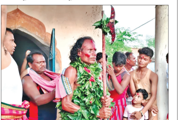
ଧର୍ମାମାଳୟିତ କଳାପାର ମନ୍ଦିରରେ ଦଶରା ଯାତ୍ରା ପ୍ରବଳ ଉତ୍ସାହ ଉଦ୍ଧାପନା ସହ ସମାପନ ହୋଇଯାଇଛି ।