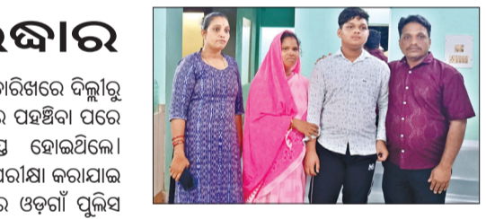
ସ୍କୁଲ ବ୍ୟାଗ୍ ନେଇ ନାବାଳକ ଜଣକ ଘରୁ ଆସିଥିଲା । ହେଲେ ସ୍କୁଲ କୁଟି ପରେ ସେ ଘରକୁ ନତପରିବାରକୁ ଏ ସମ୍ପର୍କରେ ନାବାଳକର ମା' ଓଡ଼ିଶା ଆନରେ ଲିଖିତ ଅଭିଯୋଗ କରିଥିଲେ ।

ନୟାଗଡ଼, ୩୦।୯ (ସଂଚାର ବ୍ୟୁରୋ): ନୟାଗଡ଼ ଜିଲ୍ଲା ଓଡ଼ିଶା ରେଭିନ୍ୟୁ ସରକାରୀ ଉଚ୍ଚବିଦ୍ୟାଳୟର ନିଖୋଜ ୧୦ମ ଶ୍ରେଣୀ ଛାତ୍ରକୁ ଓଡ଼ିଶା ପୁଲିସ୍ ଦିଲ୍ଲୀ ପାଇଁ ଚାଲିଯିବା ସହ ହାତ ସ୍ଥିତ ଥାନା ଲାଲକିଳା ନିକଟ ଦଙ୍ଗଳା ସାହେବ ଅଞ୍ଚଳରୁ ଉଦ୍ଧାର କରିଥିବା ଜଣାପଡ଼ିଛି । ନାବାଳକ ଛାତ୍ର ଜଣକ ଗତ ୧୨ତାରିଖରୁ ନିଖୋଜ ଥିଲା । ଓଡ଼ିଶା ପୁଲିସ୍ ଏକାଧିକ ଥର ଧରିବାକୁ ଉଦ୍ୟମ କରି ଅସଫଳ ହୋଇଥିଲେ ମଧ୍ୟ ସେପ୍ଟେମ୍ବର ମାସ ୩୦ ତାରିଖରେ ଦିଲ୍ଲୀରୁ ଉଦ୍ଧାର କରି ଓଡ଼ିଶା ଆନରେ ପହଞ୍ଚିବା ପରେ ପରିବାର ଲୋକେ ଆଶ୍ୱସ୍ତ ହୋଇଥିଲେ । ପ୍ରଥମେ ନାବାଳକର ସ୍ୱାସ୍ଥ୍ୟ ପରୀକ୍ଷା କରାଯାଇ ସଫଳ ପ୍ରକ୍ରିୟା ସରିବା ପରେ ଓଡ଼ିଶା ପୁଲିସ୍ ନାବାଳକକୁ ତାର ଅଭିଭାବକଙ୍କୁ ହସ୍ତାନ୍ତର କରିଛି । ସୂଚନାନ୍ୁସାରେ, ନୟାଗଡ଼ ଜିଲ୍ଲା ଓଡ଼ିଶାରେ ଗତ ୧୨ ତାରିଖ ଶୁକ୍ରବାର ସକାଳ ୧୦ଟା ବେଳେ ସ୍କୁଲକୁ ଯାଉଛି ବୋଲି କହି