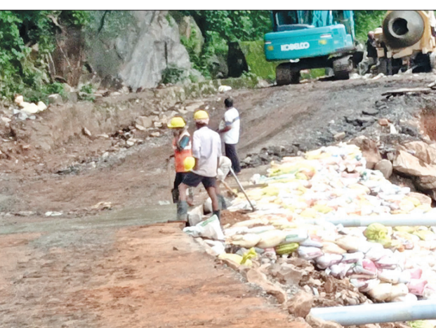
କନ୍ଧମାଳ ଜିଲ୍ଲାପାଳ ବେଦ ଭୃଷ୍ଟକଳ ଇତି ମଧ୍ୟରେ ଦୁଇ ଥର କଳିଙ୍ଗା ଘାଟି ଭୃଷ୍ଟକଳ ସ୍ଥଳ ଦୁଇ ତରାଫ କରାଗଲେଣି। ଗତ ୨୨ତାରିଖ ଦିନ ଦ୍ୱିତୀୟ ଭୃଷ୍ଟକଳ ପରେ କନ୍ଧମାଳ ଜିଲ୍ଲାପାଳ ନିଜ ପ୍ରତିକ୍ରିୟାରେ କହିଥିଲେ ୩୦ତାରିଖ ପର୍ଯ୍ୟନ୍ତ ଏହି ରାସ୍ତାରେ ଯାନବାହନ ଯାତାୟତ କରିବ ନାହିଁ। ଏହାର ଅର୍ଥ ଲୋକ ଆଶା କରିଥିଲେ ୩୦ ତାରିଖ ଭିତରେ କାର୍ଯ୍ୟ ସମାପ୍ତ ହୋଇଥିବ। ରାସ୍ତାରେ ଗାଡ଼ି ଚାଡ଼ିବା କହିଥିଲେ ୩୦ତାରିଖ ପର୍ଯ୍ୟନ୍ତ ଏହି ରାସ୍ତାରେ ଯାନବାହନ ଯାତାୟତ କରିବ ନାହିଁ। ଏହାର ଅର୍ଥ ଲୋକ ଆଶା କରିଥିଲେ ୩୦ ତାରିଖ ଭିତରେ କାର୍ଯ୍ୟ ସମାପ୍ତ ହୋଇଥିବ। ରାସ୍ତାରେ ଗାଡ଼ି ଚାଡ଼ିବା

ସୁ.ଉଦୟଗିରି, ୩୦।୯(ସଂଚାର ବ୍ୟୁରୋ): ଗଞ୍ଜାମ ଓ କନ୍ଧମାଳ ଜିଲ୍ଲାର ଲୋକଙ୍କ ଲାଭପ୍ରାପ୍ତ ଲାଇଫ୍ ଲୁହାଯାଉଥିବା ୧୫୭ ନମ୍ବର କାଟାୟ ରାଜପଥର କଳିଙ୍ଗା ଘାଟିରେ ଯାନବାହନ ଠକ୍ ହୋଇଯାଇଛି। ଭୃଷ୍ଟକଳ ଯୋଗୁଁ ୩୦୦୦ଟି ରାସ୍ତା ଯୋଗ ହୋଇଥିବା ଯୋଗୁଁ ଏହି ରାସ୍ତାରେ ଯାତାୟତ ସମ୍ପୂର୍ଣ୍ଣ ବନ୍ଦ ରହିଥିବା ବେଳେ ତଦାପାଦ ବେଳେ ବର୍ତ୍ତମାନ ଯାତ୍ରୀବାହୀ ଏବଂ ମାଲବାହୀ ଗାଡ଼ି ଯାତାୟତ କରୁଛି। ଏହି କାରଣରୁ ଅଧିକ ୫୫ କିମି ଦୂରତା ପଡୁଛି। ଏହା ସମୟ ସାପେକ୍ଷ ହେବା ସହ ଆର୍ଥିକ କ୍ଷତି ସହିବାକୁ ପଡୁଛି। ସାଧାରଣ ଲୋକ ୪୦ କିମି ବଦଳରେ ୧୦କିମି ରାସ୍ତା ଯିବାକୁ ପଡୁଛି। କଳିଙ୍ଗା ଘାଟିରେ ଗୋଟିଏ ସ୍ଥାନରେ ଦୁଇଦୁଇ ଥର ଭୃଷ୍ଟକଳ ଘଟି ପରିସ୍ଥିତି ଅଣାୟତ କରିଥିବା ବେଳେ ଖୁବ କମ ସମୟ ଭିତରେ କାଟାୟ ରାଜପଥ କର୍ତ୍ତୃପକ୍ଷ ଅଭାବେ ରାସ୍ତା ନିର୍ମାଣ କରିବା ନେଇ ଅଞ୍ଚଳବାସୀ ଆଶା ବାଣୀ ବସିଥିବା ବେଳେ ଇତି ମଧ୍ୟରେ ୧୫ଦିନ ବିଝୋରକ ରାସ୍ତା କାମ ସରିବ କି ଆଗାମୀ ଦଶ ଦିନ ପର୍ଯ୍ୟନ୍ତ ସରିବ ଆଶା କରାଯାଉଛି।