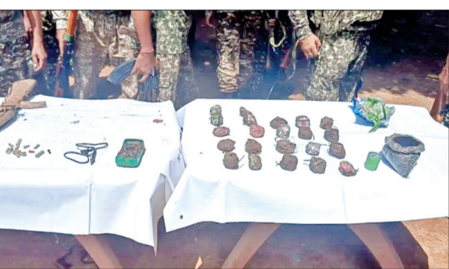
ଏହି ତମ୍ବୁରୁ ପ୍ରେସର ବୋମା, ବନ୍ଧୁକ, ବିଦ୍ୟୁତ୍ ଚାର, ବାରୁତ ଭଳି ବିଝୋରକ ଜବତ କରାଯାଇଛି। ପୁଲିସ ଏବଂ ସୁରକ୍ଷାକର୍ମୀଙ୍କୁ ଚାର୍ଜେଟ୍ କରିବା ପାଇଁ ନନ୍ଦଳ ଏଠାରେ ଲୁଚାଇ ରଖିଥିବା ପୁଲିସ କହିଛି। ଏହି ତଡ଼ାଉରେ ଆକଟିବିପି ଯଦନ ଏବଂ ଜିଲ୍ଲା ପୁଲିସ ସାମିଲ ଥିଲେ।

ମାଲକାନଗିରି, ୩୦।୯(ସଂଚାର ବ୍ୟୁରୋ): ସାମାଜିକ ଛତିଶଗଡ଼ରେ ନନ୍ଦଳ ଦମନ ଅଭିଯାନ କୋରସୋରେ ଚାଲିଛି। ଲଗାତାର ଅପରାଧନରେ ନନ୍ଦଳ ଧରାଶାୟୀ ହେବା ସହ ନନ୍ଦଳ ଲୁଚାଇ ରଖିଥିବା ସମସ୍ତ ତମ୍ବୁରୁ ଯଦନ ଉଦ୍ଧାର କରି ଚାଲିଛନ୍ତି। ଏହି କ୍ରମରେ ଆଜି ପୁଣି ନାରାୟଣପୁର ଜିଲ୍ଲାର ଆନୁଷ୍ଠାନିକ ଜଙ୍ଗଲରେ ସକ୍ରିୟ ଅପରାଧନ କରୁଥିବା ବେଳେ ଏକ ତମ୍ବୁରୁ ଉଦ୍ଧାର କରିଛନ୍ତି। ଧନୋରୀ ଥାନା ଅନ୍ତର୍ଗତ ଗୋହାନ୍ତର ଓ ଡୋୟାପାରା ମଧ୍ୟରେ ରହିଥିବା ଜଙ୍ଗଲରେ ଏହି ତମ୍ବୁରୁ ଉଦ୍ଧାର କରିଛନ୍ତି ସୁରକ୍ଷାକର୍ମୀ।