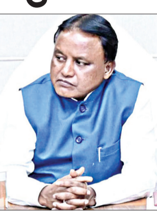
ଭୁବନେଶ୍ୱର ସେବା ପୁନଃସ୍ଥାପିତ ହୋଇଛି। ମୁଖ୍ୟମନ୍ତ୍ରୀ କହିଛନ୍ତି ଯେ ପରିସ୍ଥିତି ସାମାନ୍ୟ ହେଲେ ମଧ୍ୟ ପୁଲିସ୍ ସତର୍କ ରହିବାକୁ

ସହାୟ ବ୍ୟକ୍ତିମାନଙ୍କ ଉପରେ କଡ଼ା ନଜର ରଖିବାକୁ ପୁଲିସ୍ ପ୍ରଶାସନକୁ ନିର୍ଦ୍ଦେଶ ଦେଇଛନ୍ତି। ବୈଠକରେ ସମାକ୍ଷା କରି ମୁଖ୍ୟମନ୍ତ୍ରୀ କହିଛନ୍ତି ଯେ ଏକ ଶାନ୍ତପୂର୍ଣ୍ଣ ରାଜ୍ୟ ଭାବେ ପରିଚିତ ଓଡ଼ିଶାରେ ଛବିକୁ ମଳିନ କରିବା ପାଇଁ କେତେକ ଉଦ୍ଦେଶ୍ୟ ପ୍ରଶୋଦିତ ଗୋଷ୍ଠୀ ଉଦ୍ୟମ କରୁଛନ୍ତି। ସେମାନଙ୍କୁ ଦୃଢ଼ ହସ୍ତରେ ଦମନ କରିବାର ଆବଶ୍ୟକତା ରହିଛି ବୋଲି ମୁଖ୍ୟମନ୍ତ୍ରୀ ମତ ଦେଇ କହି ଏପରି ବ୍ୟକ୍ତିମାନଙ୍କ ଉପରେ ସତର୍କ ଦୃଷ୍ଟି ରଖିବାକୁ ମୁଖ୍ୟମନ୍ତ୍ରୀ ଶ୍ରୀ ମାଝୀ ପୁଲିସ୍ ଉଚ୍ଚ ପଦାଧିକାରୀମାନଙ୍କୁ ନିର୍ଦ୍ଦେଶ ଦେଇଥିଲେ।